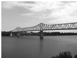
Мост через Огайо