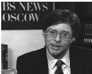
Стив в студии Московского бюро CBS News

Многие известные общественные и политические деятели приходили к нам в московское бюро CBS News на интервью и для комментариев. Стив Коэн один из немногих журналистов, которые работают легко и красиво. Он и выполнит то, что задумал в эфире, и не создаст вокруг себя никаких проблем – ни технических, ни моральных.