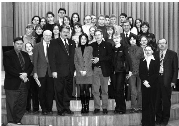
Со студентами и профессорами РГТЭУ, 2006 г.

Анализируя недавние межгосударственные отношения США и России, Стивен Коэн по существу закладывает основу для становления прагматичных взаимовыгодных, но доверительных отношений между Россией и США в будущем. Он позволяет нам, его друзьям в России, сохранить чувство уважения и надежды на гражданское общество США, верить в возможность сотрудничества с США. Благодаря Коэну мы видим, что в США есть не только злобные недоброжелатели, но и наши потенциальные партнеры, люди, с которыми можно и нужно иметь дело и