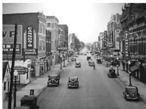
Овенсборо, 1938 год