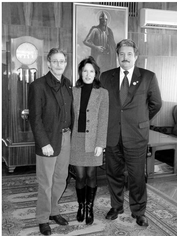
В кабинете ректора РГТЭУ, профессора С.Н. Бабурина