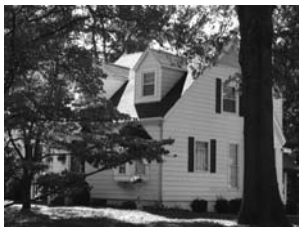
Дом семьи Коэнов