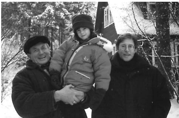
На даче в Переделкино, Новый 1994 год

О, если бы за чистототу морали Наивных в президенты выбирали!