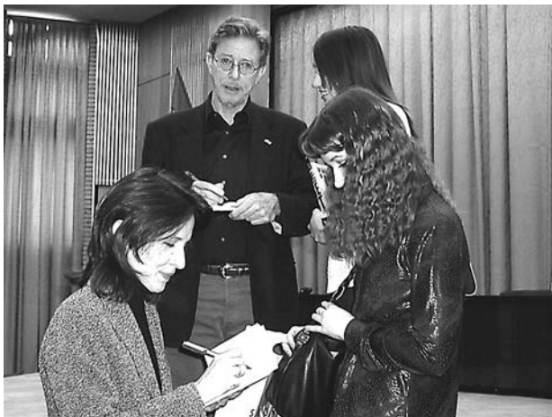
Катрин и Стив со студентами Российского государственного торгово-экономического университета

Возьмите его книги, посвященные гибели Советского Союза и процессам, протекающим в российско-американских отношениях уже на рубеже XX и XXI века. Стивен Коэн один из первых заговорил об ошибочности действий администрации США в отношении слепой поддержки «реформаторского» движения в России и пагубности разрушения Советского Союза. Как объективный исследователь, Стивен подчеркнул и привел очень много доказательств того, что гибель Советского Союза не была неизбежной, что она стала результатом сложения разных сил: и внутреннего социально-экономического кризиса в СССР, и усилий правящих кругов США и западного мира по разруше-