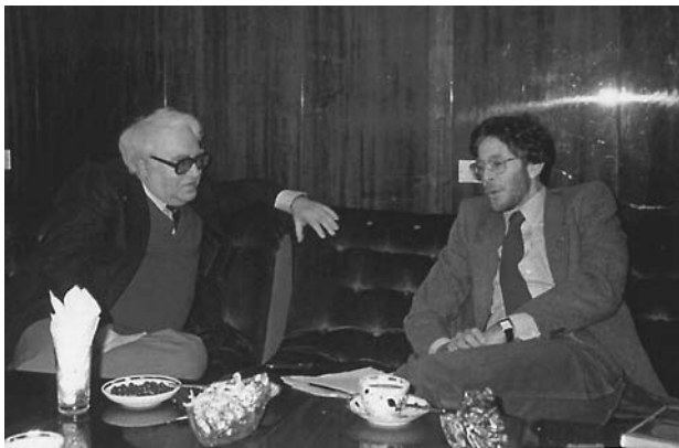
М.Ф. Шатров и Стив Коэн

ко возможно, со всем тем, что осталось от этой религиозной, в кавычках, веры в «Краткий курс», которая командовала всей нашей общественно-политической жизнью.