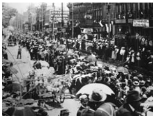
Овенсборо, 30-е годы XX века