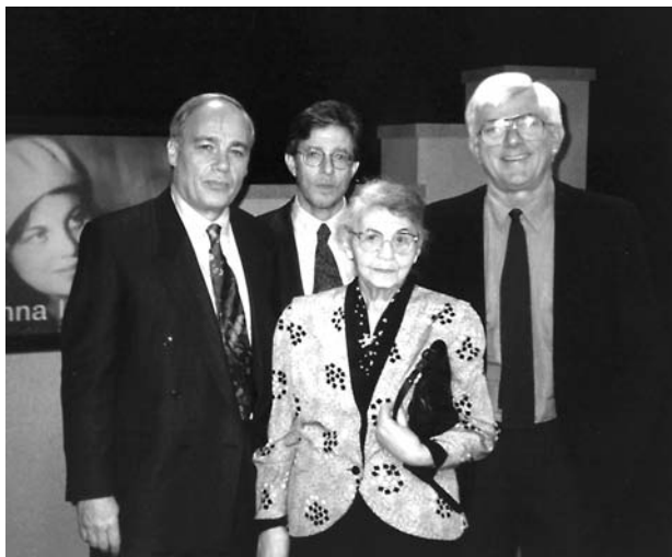
В.В. Познер, Стив и знаменитый в СССР Фил Донахью с А.М. Лариной-Бухариной в Нью-Йорке, в начале 1990-х гг.

По сути дела, он в среде советологов стоял в этом смысле особняком. Сколь горячо Коэн поддерживал Горбачева, столь страстно он осуждал Ельцина. Помню горячий спор, в котором и я принимал участие, когда Стив буквально поносил Ельцина за развал СССР. Я тогда сказал ему, что все-таки СССР - всего лишь видоизмененная Российская империя, а империи, как известно, не вечны. Коэн был не согласен. Если и империя, считал он, то нового типа, поскольку у этой империи