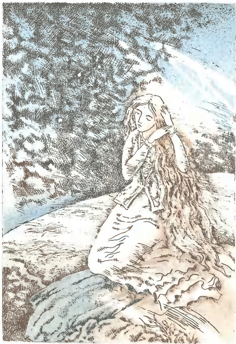
«ЗАЯТУЛЯК И ХЫУХЫЛУ»