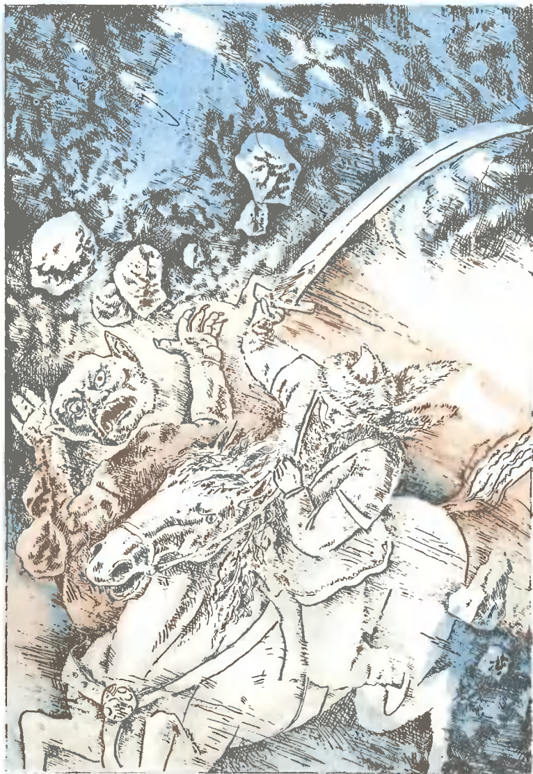
« УРАЛ-БАТЫР »