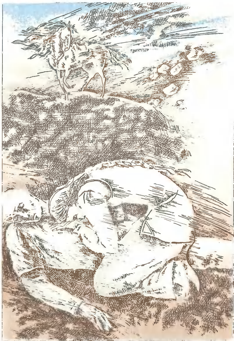
«КУЗЫКУРПЯС И МАЯНХЫЛУ»