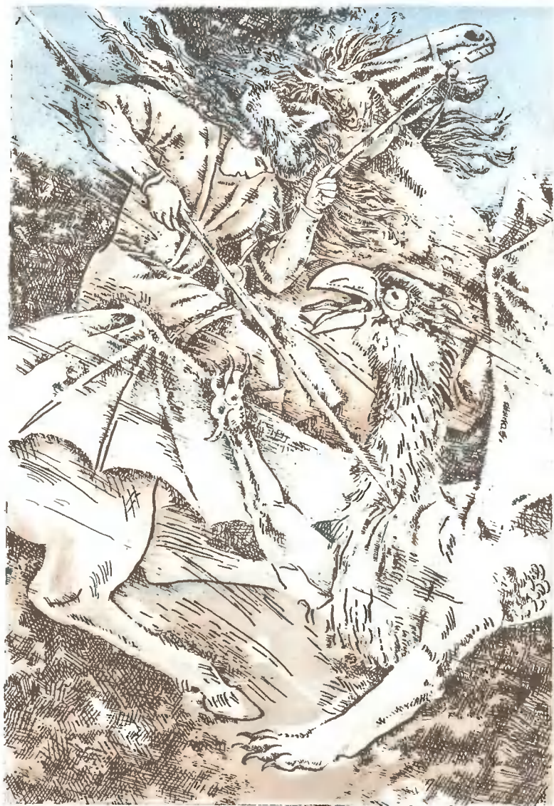
«АЛДАР И ЗУХРА»