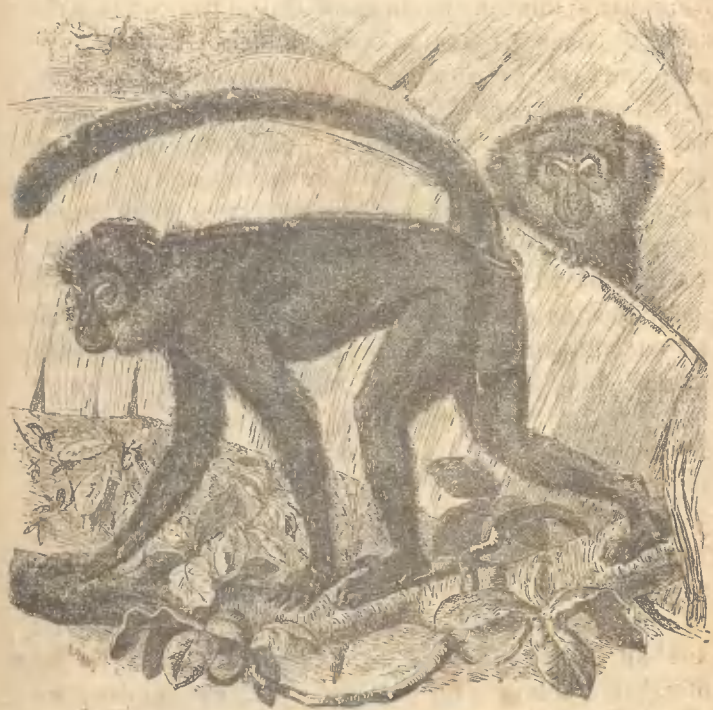
Рис. 16. Черномазая мартышка.

въ большихъ лѣсахъ небольшими стадами; при чемъ старые самцы обыкновенно живутъ отдѣльно. Этимъ черномазая мартышка отличается отъ всѣхъ другихъ мартышекъ. Въ неволѣ онѣ встрѣчаются