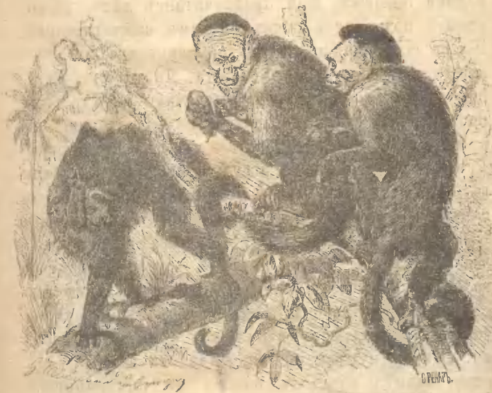
Рис. 6. Налъво—Рогатый Сапаку, а направо—Кай (Обитатель лѣсовъ.)

наружномъ видѣ всехъ визгуновъ раздѣляютъ на довольно большое количество видовъ. Все эти различія собственно незначительны, такъ что описы-