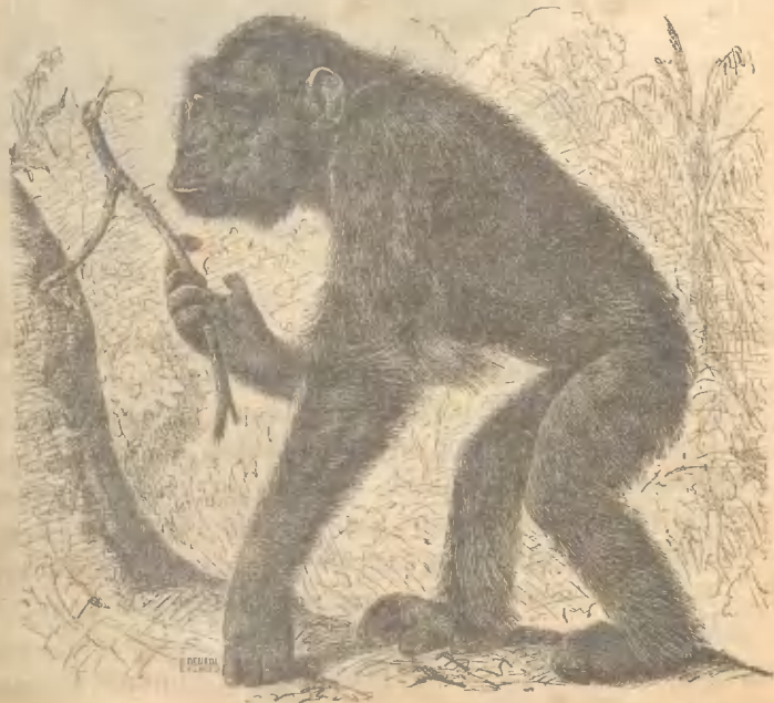
Рис. 8. Шимпанзе.

кими, короткими, бѣлыми волосами; ходитъ шимпанзе на четверенькахъ; при ходьбѣ пальцы на рукахъ онъ прижимаетъ къ ладони и опирается на землю тыльной стороной, ногами же онъ пользуется или также пригибая пальцы къ ступнѣ, или ступая всей ступней. На однѣхъ ногахъ онъ не можетъ долго держаться и при этомъ всегда ищетъ опоры для рукъ или закидываетъ ихъ за опрокинутую назадъ голову для равновѣсія.