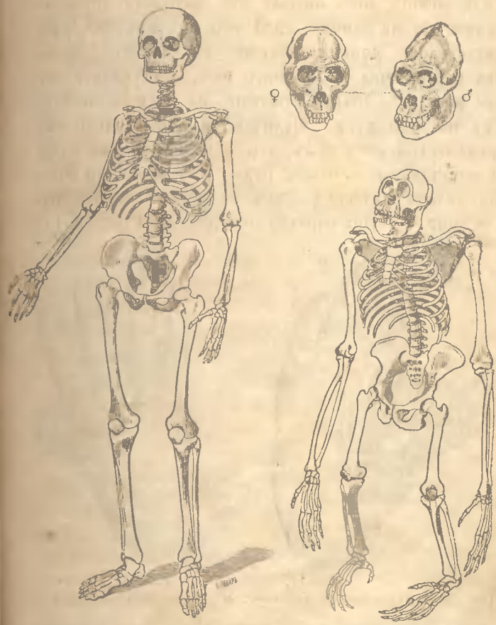
Рис. 2. Налѣво костякъ человѣка. Направо костякъ одной изъ человѣкообразныхъ обезьянъ — гориллы. ♀ черепъ самки гориллы; ♂ черепъ самца гориллы.

Взгляните на это изображеніе и вы увидите, что руки у обезьяны длиннѣе, а ноги короче, чѣмъ у