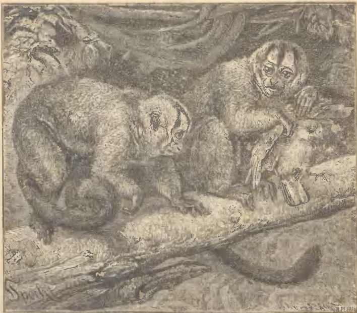
Рис. 10. Мирикипа.

извѣстна. Она проводитъ время на деревьяхъ или въ дуплахъ. Ночью ищетъ себѣ пищу, а днемъ возвращается въ дупло, гдѣ и спитъ цѣлый день. Когда ихъ испугнуть днемъ, то обезьяна, ослабленная яркимъ дневнымъ свѣтомъ не въ состояніи