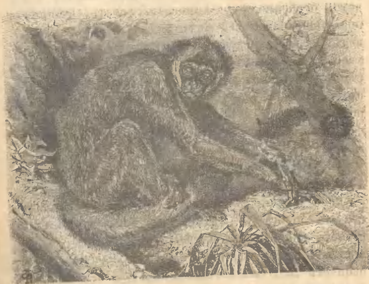
Рис. 3. Одна изъ паукообразныхъ—Чамекъ.

Другой родъ цѣпкохвостыхъ обезьянъ это паукообразныя обезьяны, длинныя, сухощавыя съ малень-