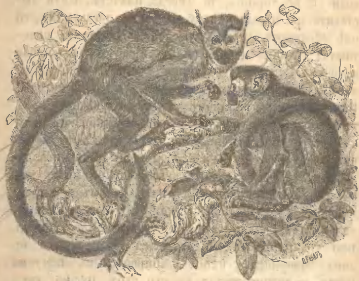
Рис. 7. Мертвая голова.

При этомъ онѣ настолько пугливы, что боятся даже пошевелинуться, чтобы не обнаружить этимъ своего присутствія. Да и днемъ, при малѣйшемъ подозрительномъ шумѣ, онѣ быстро убѣгаютъ, несясь по верхушкамъ деревьевъ и перепрыгивая довольно