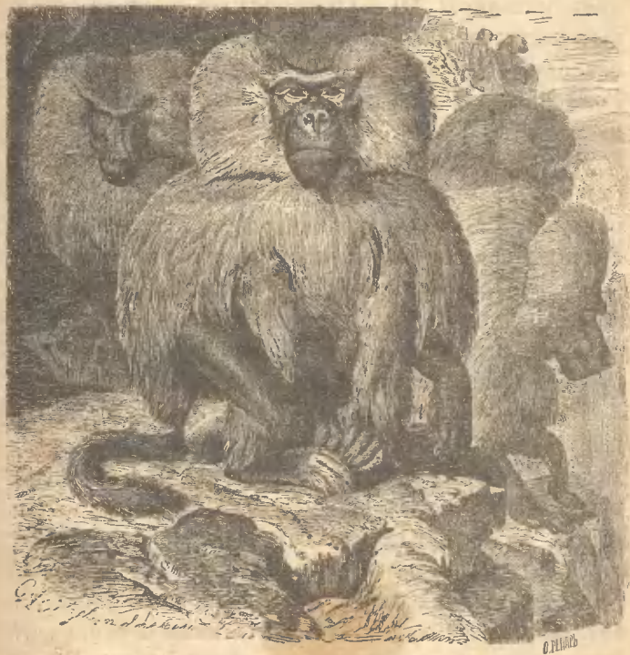
Рис. 20. Гамадриль.

пищей они не оставляютъ въ покоѣ ни одного камня. Если одной, двумъ или тремъ обезьянамъ не подъ силу сдвинуть камень съ мѣста, то онѣ садятся вокругъ въ большомъ числѣ и непремѣн-