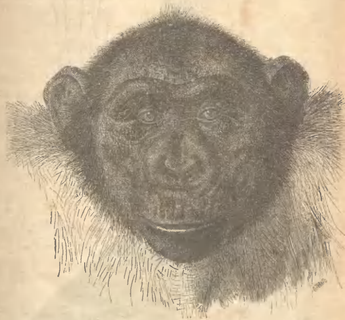
Рис. 6. Голова Шимпанзе.

Шимпанзе. Уже было упомянуто о другой чело- вѣкообразной обезьянѣ шимпанзе. Этотъ шимпанзе значительно менѣе, чѣмъ горилла, хотя все-таки старые самцы достигаютъ 2 аршинъ и 5 вершковъ, а самки 1 аршина и 13 вершковъ. Голова имѣетъ форму шара (рис. 6), но приплюснутаго. Продольный гребень на головѣ, отличающій самца гориллы, у шимпанзе не развивается. Дуги надъ глазами не вздуты. Челюсти выдаются и зубы наклонены впередъ, носъ плоскій и вдавленный. Кости стройны и красивы и костякъ шимпанзе очень похожъ на костякъ чело- вѣка. Щеки шимпанзе морщинисты, грязно-желтаго тѣлеснаго цвѣта, который въ старости получаетъ черно-бурый грязновато-черный