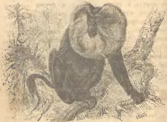
Рис. 22. Силенъ.

породы или других обезьянъ, но и въ женщинъ, которыхъ имъ часто приходится видѣть. Если они увидятъ, что мужчина ласкаетъ предметъ ихъ страсти, ревность ихъ не имѣетъ границъ. Въ бѣшенствѣ они часто ломаютъ свои клѣтки. Только съ большимъ трудомъ можно приручить мандриловъ