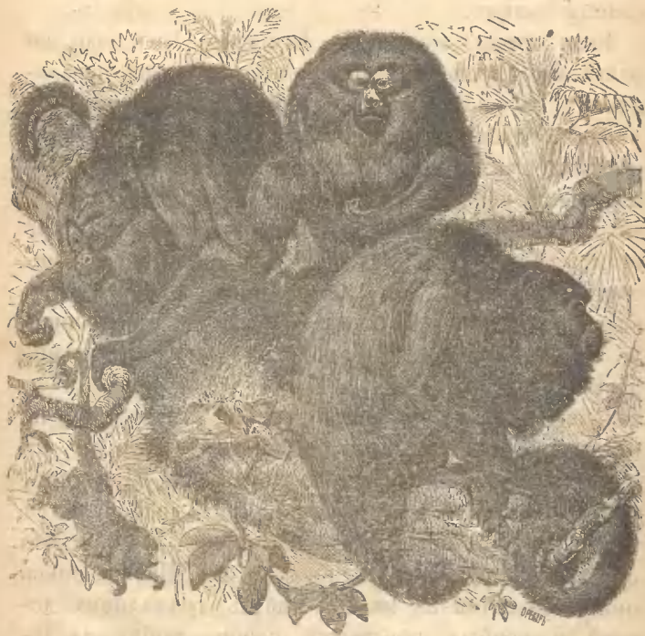
Рис. 2. Семейство Ревуновъ.

съ каждой изъ многочисленныхъ породъ этихъ обезьянъ. Начнемъ съ цѣпкохвостыхъ. Самыми крупными изъ цѣпкохвостыхъ безспорно являются Ревуны (рис. 2). Они отличаются необыкновенно