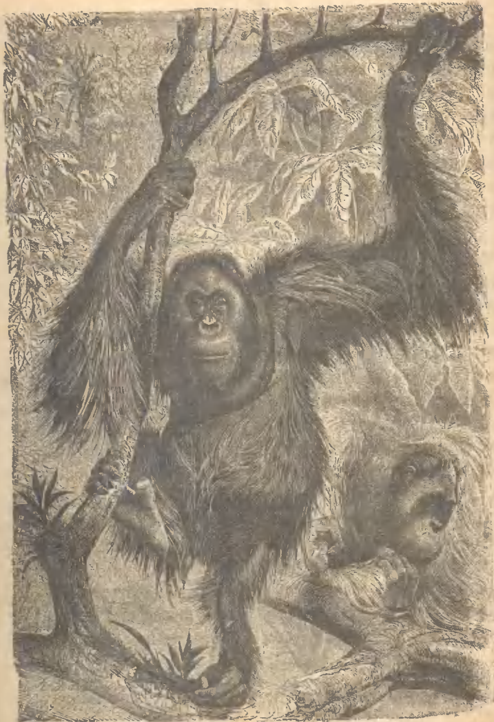
Рис. 9. Орангъ-утаны на свободѣ.

любить мяса. Когда одному изъ нихъ дали живого воробья, то онъ сначала испугался, но потомъ загрызъ его, выдернулъ нѣсколько перьевъ, попробовалъ мяса и выкинулъ вонъ. Нижняя челюсть выдается сильно впередъ, какъ у очень старыхъ беззубыхъ людей. На спинѣ и на груди шерсть рѣдкая, а по бокамъ густая и растетъ длинными космами. На лицѣ волосы растутъ въ видѣ бороды; а цвѣтъ ихъ темноржавый или рыжій. Въ виду того, что орангъ-утанъ живетъ въ странахъ, соседнихъ съ нами; онъ давно уже сталъ извѣстенъ нашимъ дѣдамъ и о немъ составила масса сказокъ и небылицъ. Позднѣйшимъ ученымъ долго приходилось разбираться въ этихъ слухахъ, чтобы отличить правду отъ вымысла. Одинъ изъ такихъ ученыхъ Уоллесъ говоритъ, что орангъ-утанъ живетъ не въ самой Азiи, а на островахъ, лежащихъ у ея полуденныхъ береговъ, Суматрѣ и Явѣ, особенно на послѣднемъ. Любитъ онъ болотныя, лѣсистыя мѣстности, а гдѣ сухо, тамъ его нѣтъ. Ходитъ также, какъ и прежде описанныя обезьяны на кулакахъ, а не на подошвахъ, осторожно пробираясь черезъ лѣсъ. Звѣри на него почти не нападаютъ, такъ какъ боятся; только крокодилъ *) и тигровая змѣя рѣшаются вступить съ нимъ въ борьбу, но и здѣсь, какъ говорятъ живущіе тамъ народы, орангъ-утанъ всегда почти остается побѣдителемъ. При случаѣ орангъ-утанъ вступаетъ въ борьбу съ