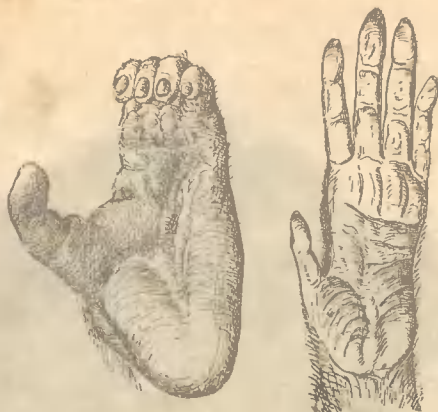
Рис. 7. Пальцо ступни шимпанзе. Направо кисть.