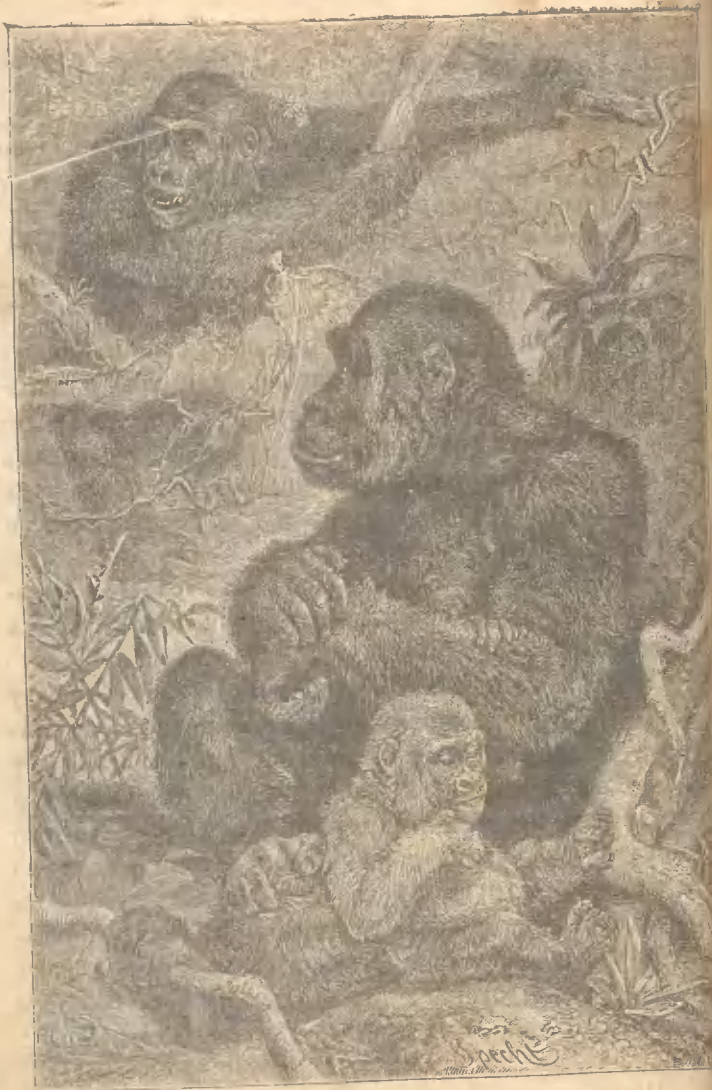
Рис. 4. Семья Гориллы на отдыхѣ въ лѣсу.

на него; громадный ростъ, впалые глаза, защищенные пучками длинныхъ волосъ, дѣлають его похожимъ скорѣе на великана; лицо, уши и руки лишены волосъ; тѣло, напротивъ, покрыто, хотя и неособенно густо, темными волосами. Отъ человѣка онъ отличается своими ногами, не имѣющими икръ. Онъ чаще всего ходитъ на ногахъ и, бѣгая по землѣ, складываетъ руки на затылкѣ. Спитъ онъ на деревьяхъ и строитъ себѣ навѣсы отъ дождя. Пища его состоитъ изъ орѣховъ и другихъ плодовъ, которые онъ находитъ въ лѣсахъ. Мяса не ѣстъ никогда. Говорить не можетъ и разума у него не больше чѣмъ у всякаго животнаго. Если тамошнимъ жителямъ, въ этихъ лѣсахъ случится ночью развести огонь, то поутру, какъ только они оставятъ мѣсто ночлега, тотчасъ-же являются Понго (гориллы), садятся у огня и сидятъ до тѣхъ поръ, пока онъ не потухнетъ; они не понимаютъ, что для поддержанія его нужно подкладывать дровъ. Понго часто собираются въ стада и убиваютъ немало негровъ. *) Часто также они нападаютъ на слоновъ, **) которые пасутся по близости, и такъ сильно колотятъ ихъ своими мощными кулаками, что онѣ съ ревомъ убѣгаютъ. Этихъ Понго никогда не удается поймать живыми, такъ какъ десять человѣкъ не въ состоянii удержать