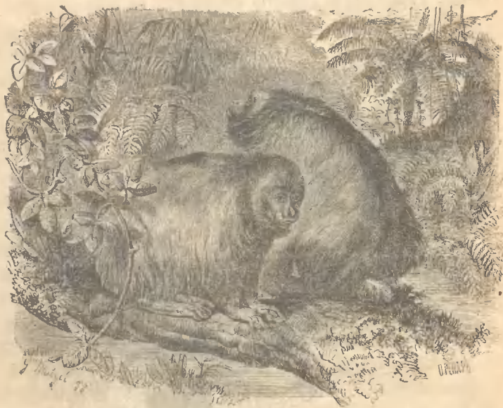
Рис. 9. Уакари.

постоянно слѣдовала за нимъ какъ собака. Когда же портной работалъ, обезьяна сидѣла у него на плечѣ. Если хозяинъ уходилъ безъ нея, то она не могла сидѣть дома и обыкновенно уходила разыскивать его по знакомымъ.