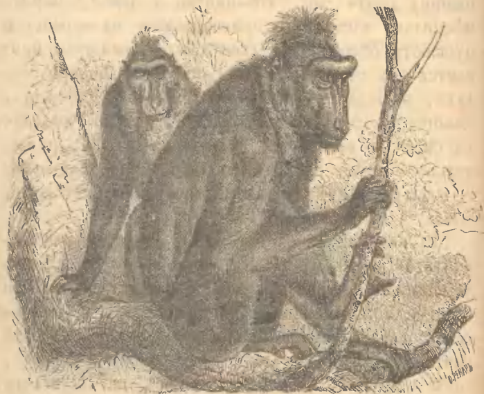
Рис. 19. Хохлатый павіанъ.

ники и вожаки, ничего неизвѣстно. Ведутъ себя такія стада очень смиренно и не пользуются своей силой. Одному путешественнику пришлось встрѣтить на дорогѣ такое стадо, которое сначала окружило его; но ударами кнута удалось скоро разо-