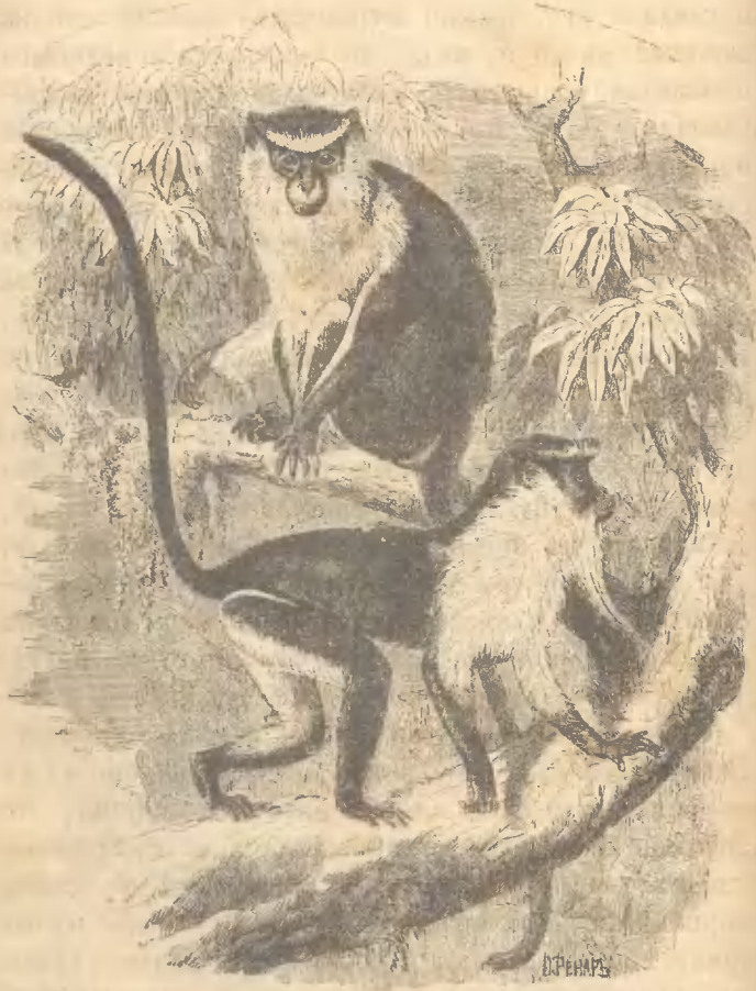
Рис. 15. Одна изъ мартышекъ—Діана.

встрѣчаются въ нсволѣ, такъ какъ ихъ любятъ за попятливость и веселость нрава. Одна изъ нихъ, по имени Муйдо, довольно долго жила въ семьѣ ученаго. Здѣсь она пользовалась полной свободой, бѣгала по всеѣмъ комнатамъ, прыгала по столамъ и шкафамъ, причеиъ никогда ничего не разбивала, влѣзала на окна, бѣгала въ саду и очень любила гулять вмѣстѣ съ хозяевами. Особенно она любила пугать проходящихъ, быстро и съ шумомъ выскакивая на нихъ изъ засады, но при этомъ никому не дѣлала пикакого вреда. Хозяевъ слушалась и по первому приказанью влѣзала въ клѣтку и сама затворяла за собой дверцу. Если она сильно проказила, то стоило только шикнуть на нее, чтобы эти проказы прекратились. Любила она разсматривать книжки съ картинками и сначала, видя нарисованнаго паука или кузнечика, пыталась схватить его и съѣсть. Ъла она то что и всеѣ другіе въ домѣ. Когда у этого ученаго родился сынъ, то обезьяна страшно полюбила ребенка, не отходила отъ него и такъ заботливо ухаживала, что можно было оставлять ихъ однихъ безъ надзора. Но въ этой дружбѣ оказалось пѣкоторое неудобство. Муйдо считалъ ребенка своей собственностью и когда другіе хотѣли взять ребенка, то онъ боялся какъ бы не обидѣли крошку и потому не позволялъ никому дотрогиваться до ребенка. Муйдо постоянно нападалъ на няньку и даже укусилъ однажды жену ученаго. Черномазая мартышка (рис. 16) отличается чернымъ цвѣтомъ тѣла и чернымъ лицомъ и руками; только верхнія вѣки у нихъ бѣлыя. Живутъ онѣ