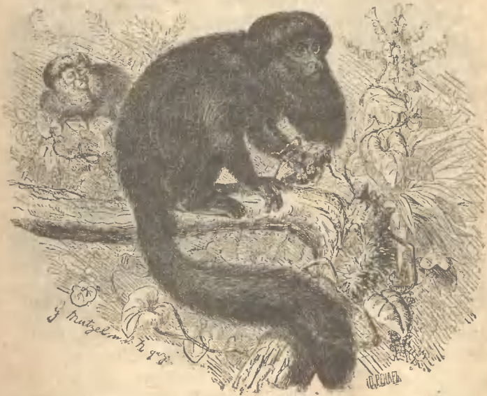
Рис. 8. Шіу.

совъ, собираются большими обществами и наполняютъ тогда воздухъ своимъ пропитательнымъ крикомъ. Эти саки чрезвычайно осторожны и проворны: при малѣйшемъ шумѣ все стадо пускается въ бѣгство и скрываются въ лѣсу, такъ что охотнику рѣдко удастся достать живьемъ хоть одну обезьяну.