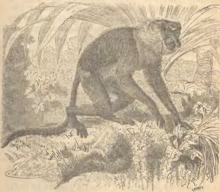
Рис. 13. Носатая обезьяна.

лишенія. Даже маленькимъ мартышкамъ они позволяютъ бить себя, всячески мучить и издѣваться. Индусы никогда не держатъ буденговъ у себя въ домахъ, тогда какъ другихъ обезьянъ очень часто можно найти на дворѣ индуса, особенно на ко-