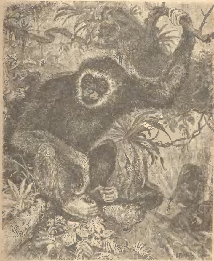
Рис. 10. Одинъ изъ Гиббонъ—Ларъ.

человѣкомъ и этому послѣднему очень сильно достается отъ него. Ночуетъ орангъ на деревѣ, гдѣ строитъ себѣ гнѣздо сажени на 3 на 4 отъ земли. Прикрываетъ отъ дождя его листьями. Говорятъ, что каждый день орангъ-утанъ строитъ себѣ новое гнѣздо, но это по всей вѣроятности невѣрно, такъ какъ тогда почти всѣ деревья, въ той мѣстности, гдѣ они водятся, были бы покрыты этими гнѣздами, — хотя извѣстно достоверно, что онъ рѣдко въ теченіи двухъ дней возвращается къ одному и тому же дереву. Когда солнце поднимется высоко и роса на травѣ и деревьяхъ высохнетъ, орангъ-утанъ поднимается съ своего ложа и отправляется на поиски пищи; питается онъ плодами почками и молодыми побѣгами. Путешествуетъ преимущественно по деревьямъ, а не по землѣ. Лазить большой мастеръ, чему особенно помогаютъ его длинныя руки. Выше упомянутому ученому удалось поймать маленькаго орангъ-утана, завязнуваго въ болотѣ послѣ того, какъ мать его была убита. Звѣренокъ былъ здоровъ и силенъ; когда его принесли въ домъ, то прекрѣпко вцѣпился въ бороду ученаго и тотъ на силу освободился отъ него. Зубовъ у него не было и только черезъ нѣсколько дней показались два передніе зуба. Когда ученому пришлось кормить своего плѣнника, то онъ сталъ втупикъ, такъ какъ молока не могли достать и должны были придумать что-нибудь, замяняющее молоко; остановились на рисовомъ отварѣ съ сахаромъ. Звѣренокъ велъ себя совсѣмъ, какъ маленькій ребенокъ и чтобы унять его крикъ,