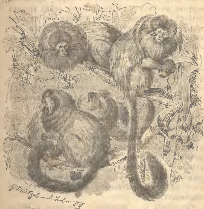
Рис. 11. Розалия.

ее разсердить, то у нея надувается шея, волосы гривы приподымаются и она дѣлается похожей на разсерженного африканскаго льва, только въ ма-