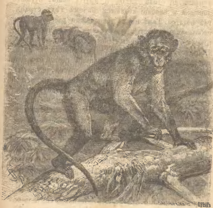
Рис. 17. Китайская обезьяна.

дичей; только болѣе нахальна и своевольна, такъ какъ поклоненіе и безнаказанность ее испортили. Какъ и другихъ обезьянъ ее можно выучить разнымъ штукамъ. Фокусники ее выучиваютъ плясать,