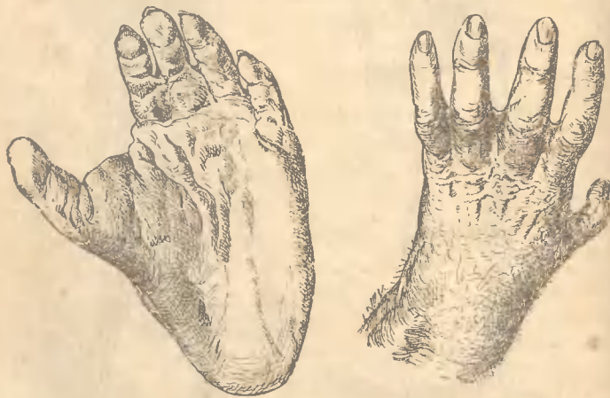
Рис. 3. Пальцо ступня Гориллы. Направо кисть ея руки.

между собой; вотъ почему ихъ называли четверо-рукими; но на самомъ дѣлѣ это не такъ. Если вы приглядитесь повнимательнѣй къ костяку чело-вѣка и обезьяны и сравните ихъ, то увидите что ноги обезьянъ похожи больше на ноги чело-вѣка, чѣмъ на свои руки. Отличаются они только отъ чело-вѣческой ноги тѣмъ, что у чело-вѣка всѣ паль-цы поставлены въ одинъ рядъ, а у обезьяны боль-шой палецъ смѣщенъ, какъ на рукѣ и короче дру-гихъ (рис. 3). Шея гораздо короче чело-вѣческой. Го-