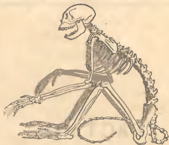
Рис. 11. Костякъ Хульмана.

велика въ сравненіи со всей головой. Тазовыя кости узки и совсѣмъ не походятъ на тазъ человѣка и даже гориллы. Этотъ костякъ скорѣе напоминаетъ намъ какое-нибудь другое животное. Нашли очень