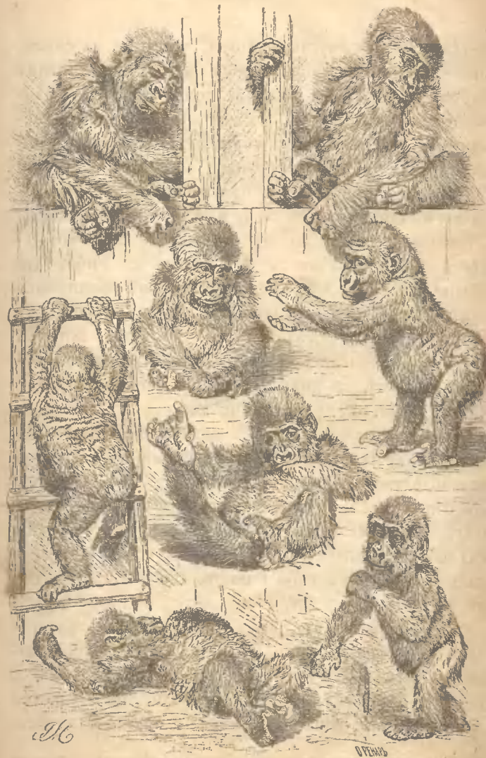
Рис. 5. Различныя положенія молодого Гориллы проживавшаго въ Берлигѣ.

фрукты; иногда даже при этой продѣлкѣ онъ притворялся за собою дверь шкафа, затѣмъ преспокойно съѣдалъ свою добычу, или будучи замѣченъ, убѣгалъ съ нею. Любилъ онъ очень стучать по пустымъ внутри предметамъ и, проходя мимо бочекъ рѣдко пропускалъ случай, чтобы не побарабанить по нимъ. Незнакомыхъ звуковъ, какъ напримѣръ звукъ грома, онъ страшно боялся и у него даже отъ страха дѣлался поносъ. На пятый мѣсяцъ своего пребывания у доктора онъ захворалъ и проболѣлъ 4 недѣли. Когда его привезли въ Европу, то онъ началъ кашлять и черезъ полтора года умеръ отъ чахотки, сопровождаемой болѣзнями желудка. По вскрытіи его трупа оказалось, что кромѣ главныхъ болѣзней у него было нѣсколько другихъ, но всѣ эти болѣзни онъ перенесъ счастливо и, если бы не чахотка, то остался бы живъ. За все время пребывания въ неволѣ онъ выросъ вершка на три и прибавился въ вѣсѣ фунтовъ на восемнадцать. Вотъ какъ описываетъ этого гориллу управляющій звѣринцемъ въ Берлигѣ, столичномъ городѣ нѣмцевъ. Горилла самая высокопоставленная изъ челоѣкообразныхъ обезьянъ и выказываетъ это по наружности. Нашъ горилла (рис. 5), говоритъ онъ, ростомъ почти полтора аршина. Тѣло его покрыто мягкими, какъ шелкъ, сѣрыми волосами, а на головѣ волосы рыжеватые. Его плотное коренастое тѣло, сильныя мускулистыя руки, блестящее черное лицо съ красивыми ушами, большіе умные насмѣшливые глаза, все это придаетъ ему поразительное сходство съ челоѣкомъ. Его движенія напоминаютъ движенія