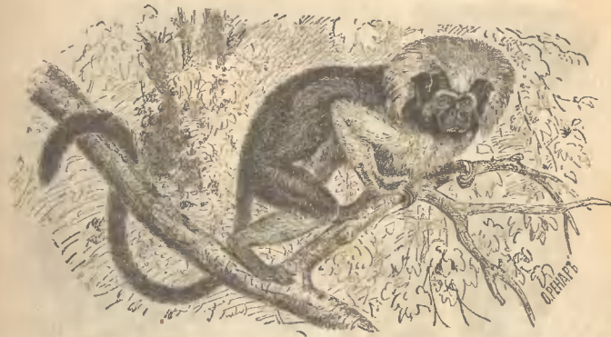
Рис. 12. Пянче.

За нами идутъ уже настоящія шелковистыя игрушки не имѣющія совершенно гривы и длинныхъ