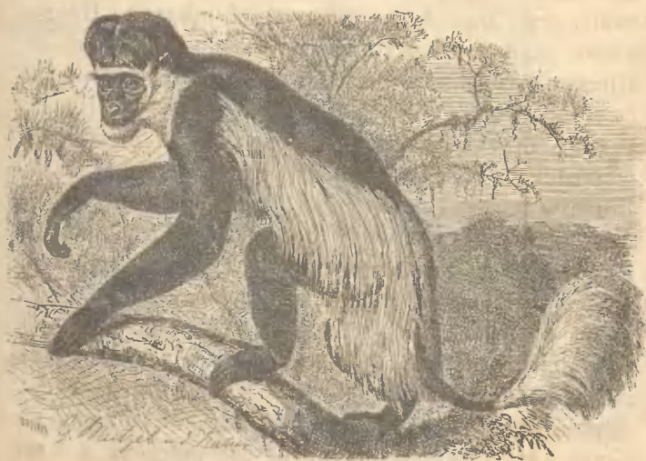
Рис. 14. Гверца.

пятна: полосы на лбу, на вискахъ, по сторонамъ шеи, на подбородкѣ, на кончикѣ хвоста и кромѣ того поясъ кругомъ всего тѣла. Волоса, расположенные поясомъ, перехватывающемъ бока, очень длинны, мягки и тонки и свѣшиваются по обѣ стороны тѣла; они необычайно красятъ гверecu; особенно, благодаря тому, что черный мѣхъ