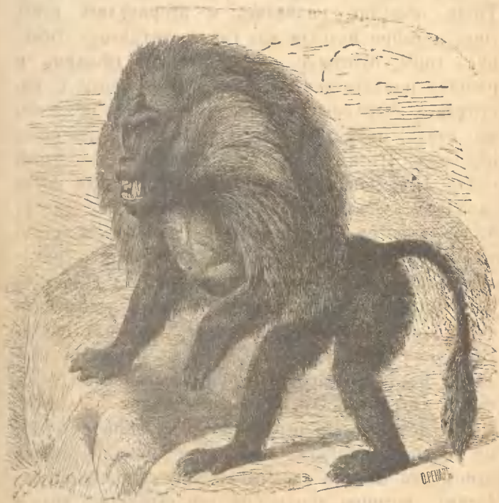
Рис. 21. Гелада.

Въ тѣхъ же мѣстахъ, гдѣ живутъ гамадрилы, водится также самый большой изъ павіановъ Гелада,