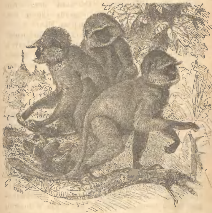
Рис. 12. Семья Хульмановъ или священныхъ обезьянъ. Самой занимательной изъ нихъ можно признать хульмана, (рис. 12) который носитъ также названіе священной обезьяны, такъ какъ народъ,

обезьянъ, живущихъ въ полуденныхъ частяхъ Азіи и на островахъ. Всѣ виды обезьянъ, причисленные къ тонкотѣлымъ, отличаются своей красотой и стройностью. Нельзя лишь этого сказать про носатую