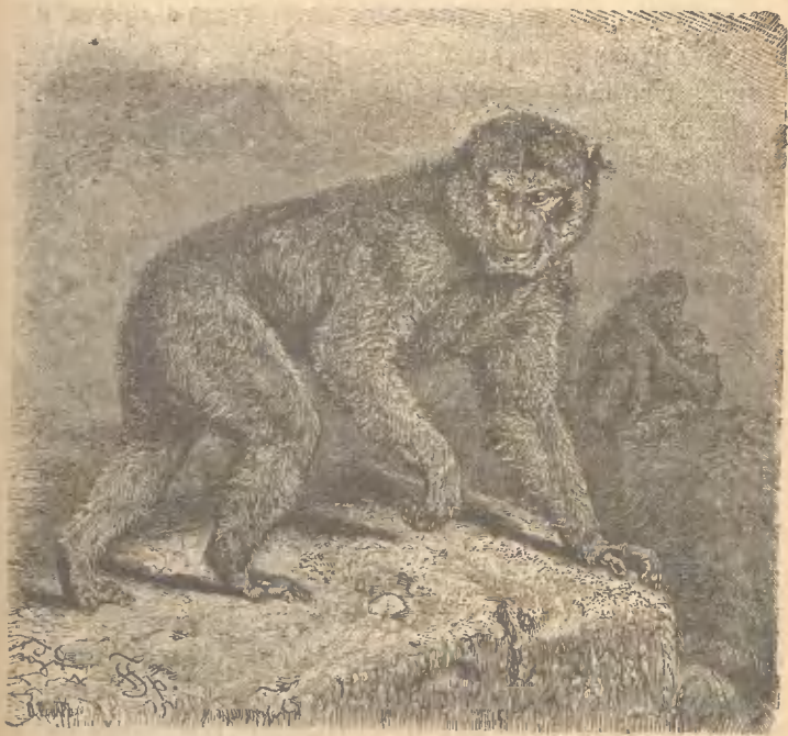
Рис. 18. Маготъ.

пещерами и разсѣлинами. Пища имъ должно быть доставалась легко, такъ какъ видъ у нихъ сытный. Кромѣ корней, листьевъ, почекъ и плодовъ онѣ ѣдятъ также жуковъ и другихъ насѣкомыхъ. Гово-