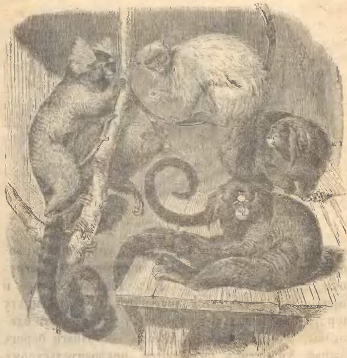
Рис. 13. Вверху Серебряная обезьяна. Внизу свѣтлый, а на- право темный уитетити.

голову своимъ хвостомъ. Къ намъ Уитетити пона- даютъ чаще другихъ игрунокъ (рис. 13) и на- столько хорошо выносятъ неволю, что часто спа-