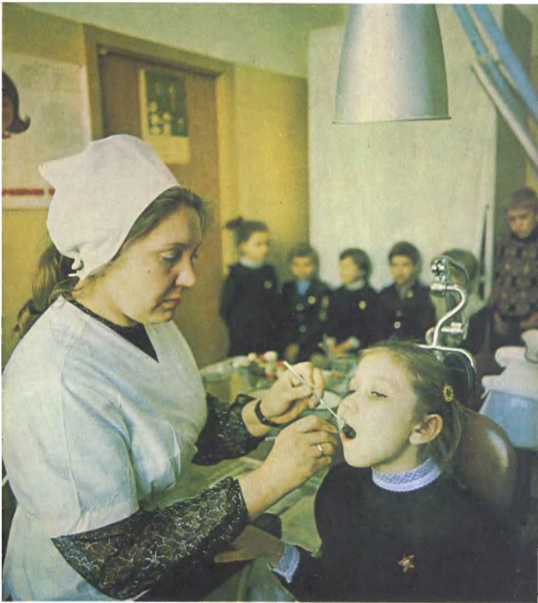
Профилактический осмотр в школьном медпункте.