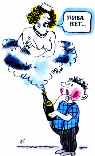
Рис. Р. Самойлова