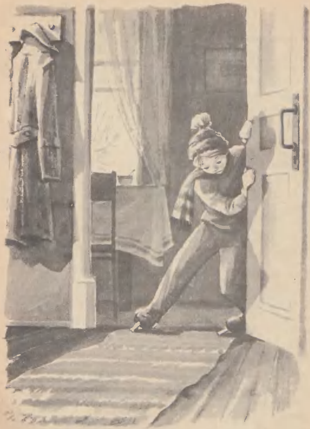
Тома схватилась за дверь, чтобы не упасть.