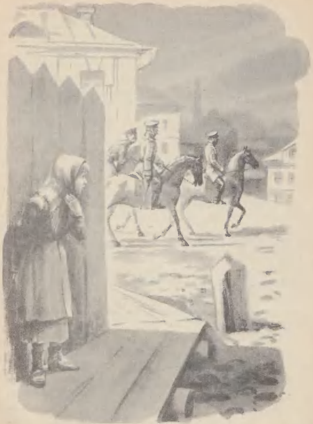
По главной улице ехали жандармы.