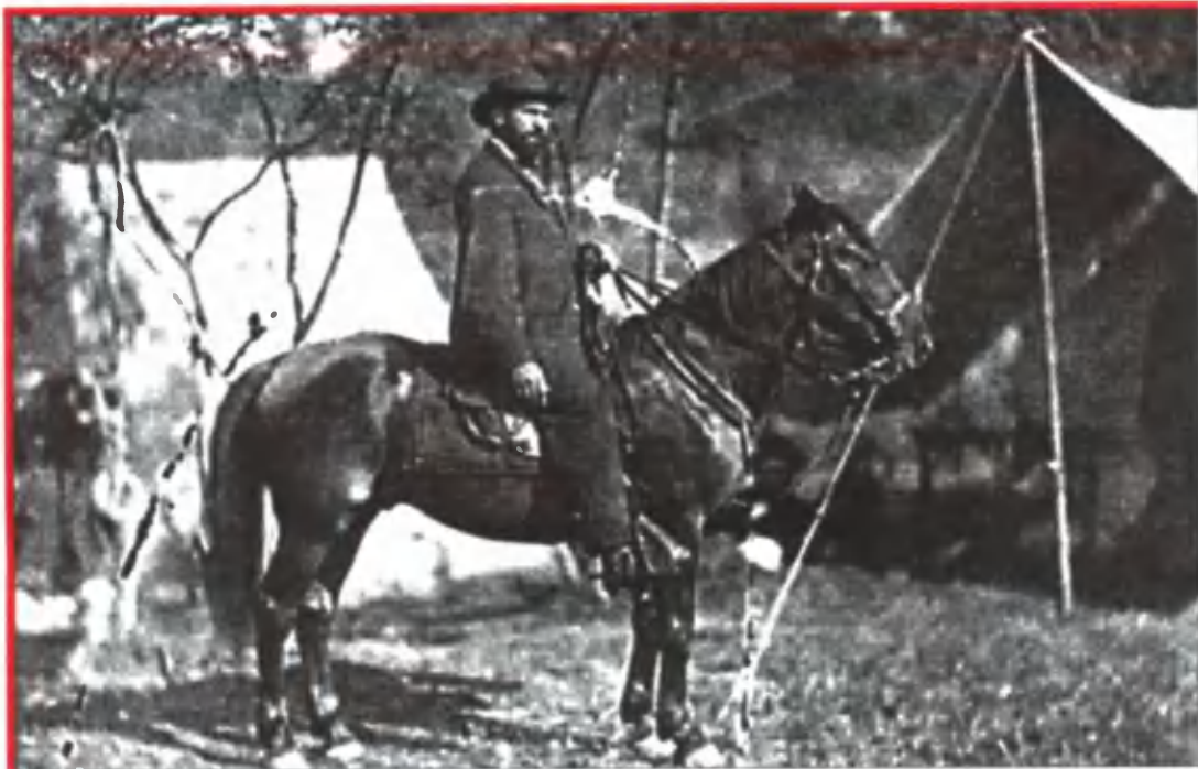
Аллен Пинкертон был человеком разнообразных талантов.