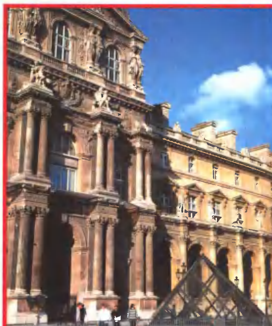
Лувр может по праву считаться самым большим и самым известным музеем мира.