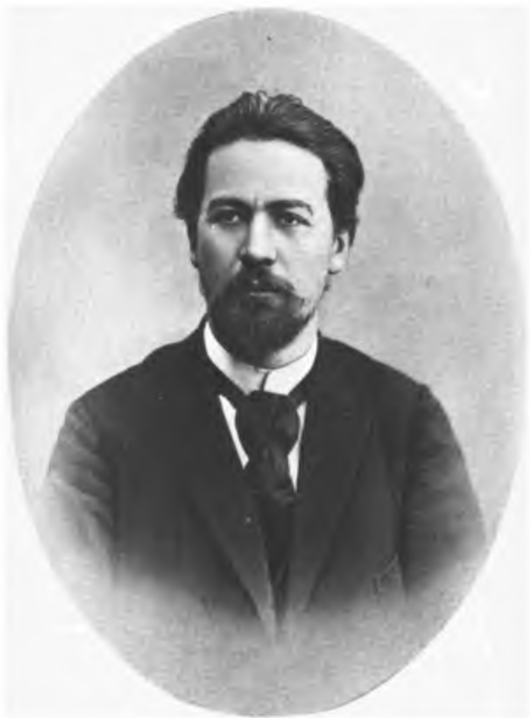
А. П. ЧЕХОВ Фотография. 1895 г.