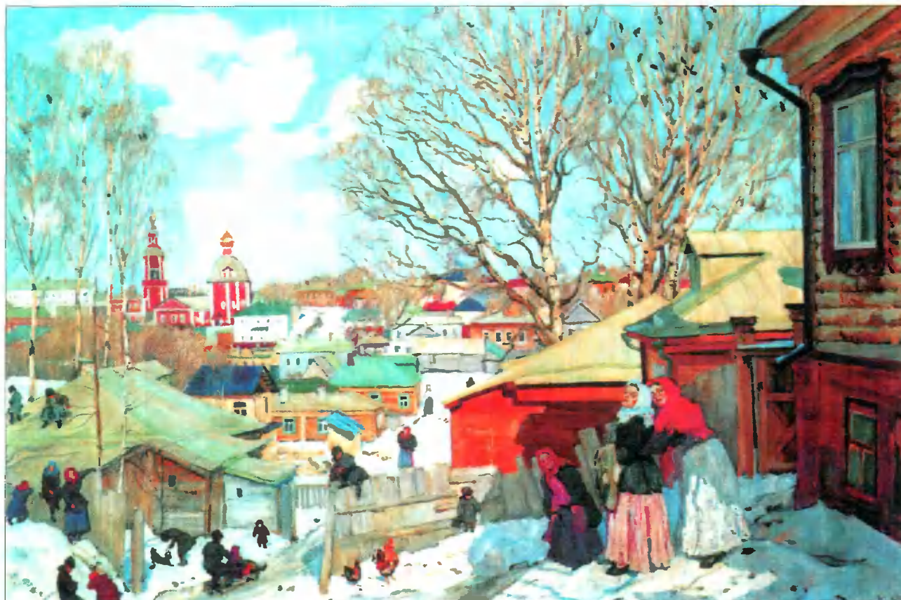
Весенний солнечный день. 1910 г.