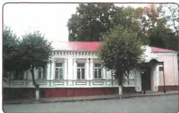
Здание музея И. А. Бунина

10 декабря 1991 года в Орле был открыт музей И. А. Бунина. Старинный дворянский особняк, в котором размещён музей, является памятником архитектуры середины XIX века. Литературно-мемориальная экспозиция музея, построенная на подлинных материалах из бунинской коллекции, рассказывает об этапах творческого пути писателя в России и в изгнании — от корреспондента газеты «Орловский вестник» до классика мировой литературы. Документы из семейного архива Буниных и фотографии, письма и автографы стихотворений юного поэта вводят нас в атмосферу жизни помещенного дворянства, в которой духовно и творчески формировался незаурядный талант писателя.