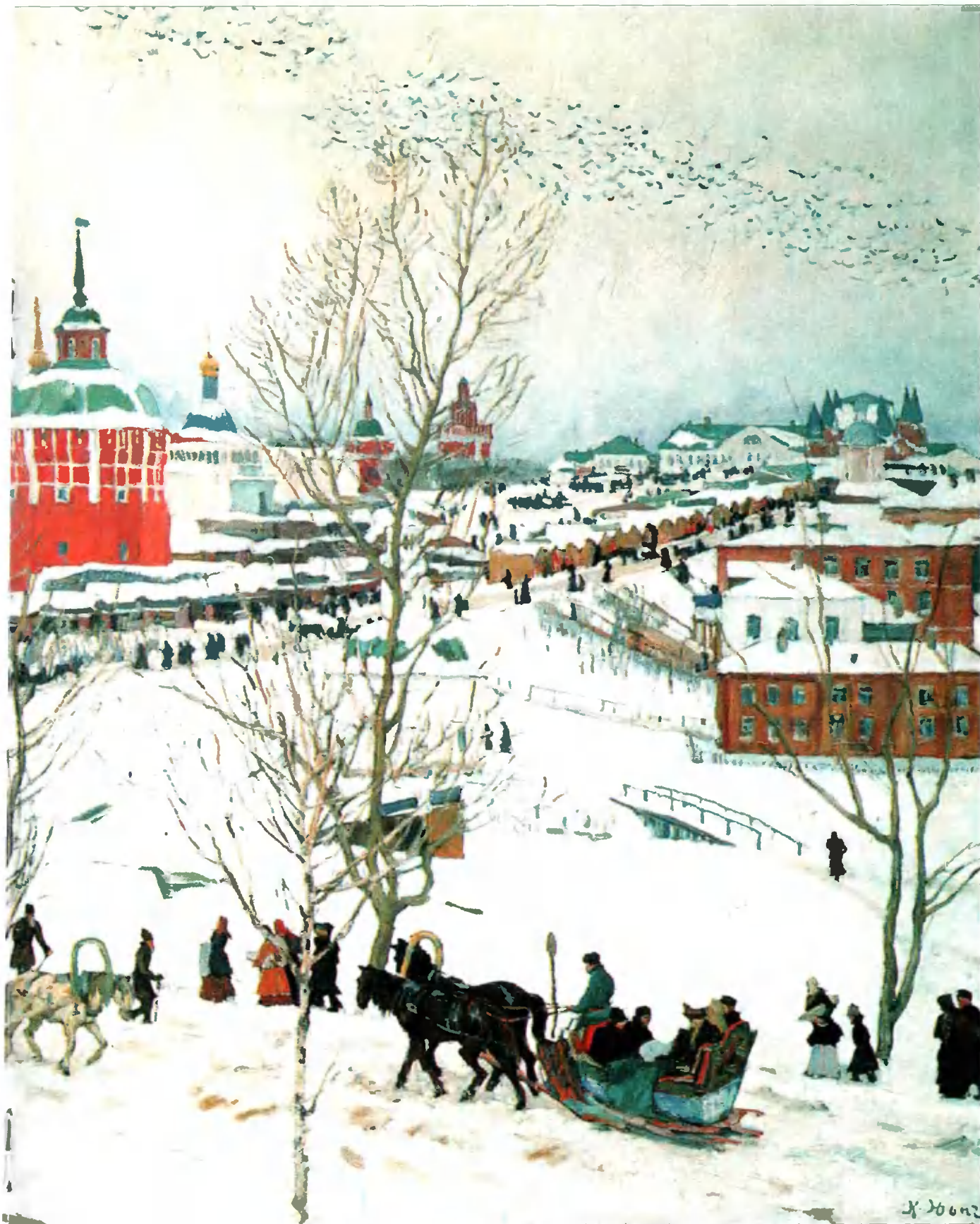
Троицкая лавра зимой. 1910 г.

студии учились Ватагин, Мухина, Фаворский и другие известные советские художники.