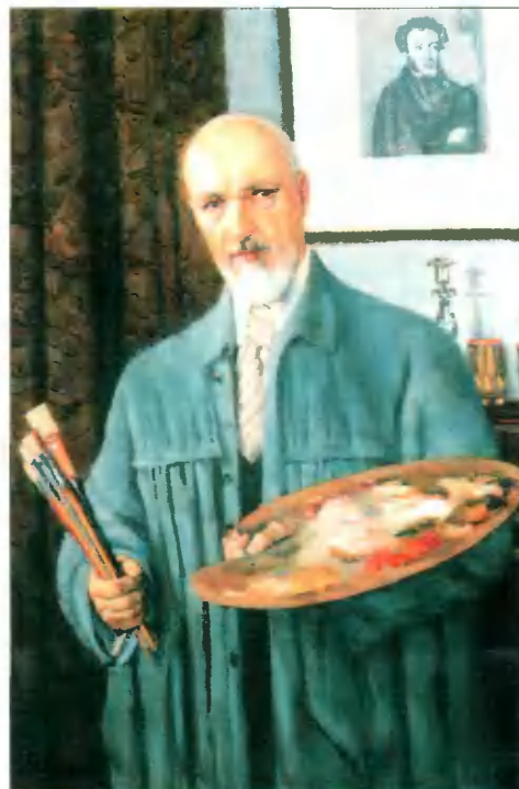
Автопортрет. 1953 г.

Юон — коренной москвич. В его семье все увлекались музыкой, театром. Молодёжь ставила домашние спектакли. Сами писали текст, делали костю-