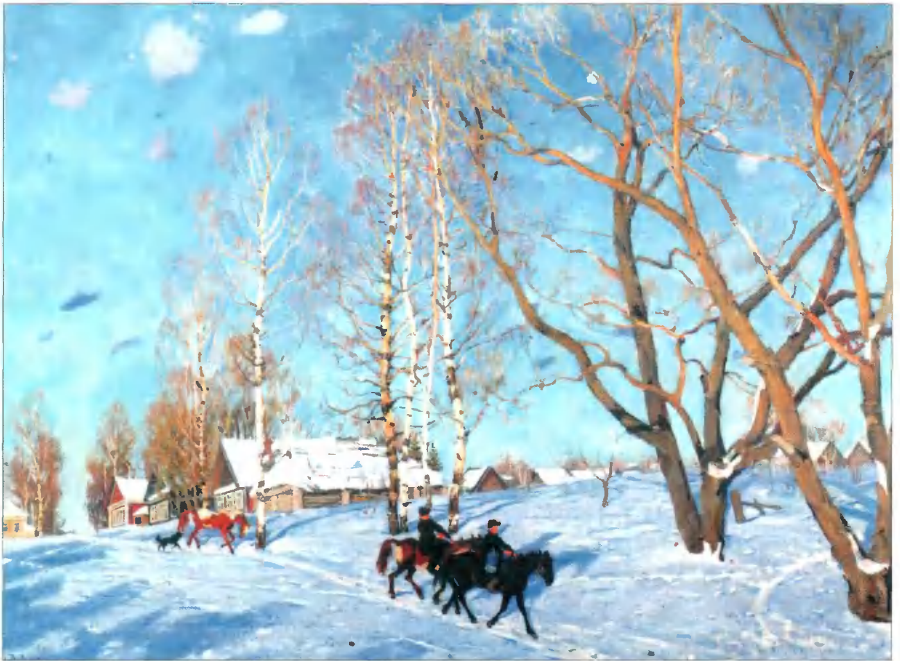
Мартовское солнце. 1915 г.

Троице-Сергиевой лавре. Наиболее интересны из них «К Троице» (1903 г.), «Троицкая лавра зимой» (1910 г.). Очень важно, что старинные архитектурные ансамбли Юон писал в окружении современной жизни. Картины его всегда очень жизненны, звучны, яркие, декоративны. Краски чистые, локальные. Много простора, света.