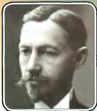
УГОЛОК РОССИИ: Музей И. Бунина в Орле