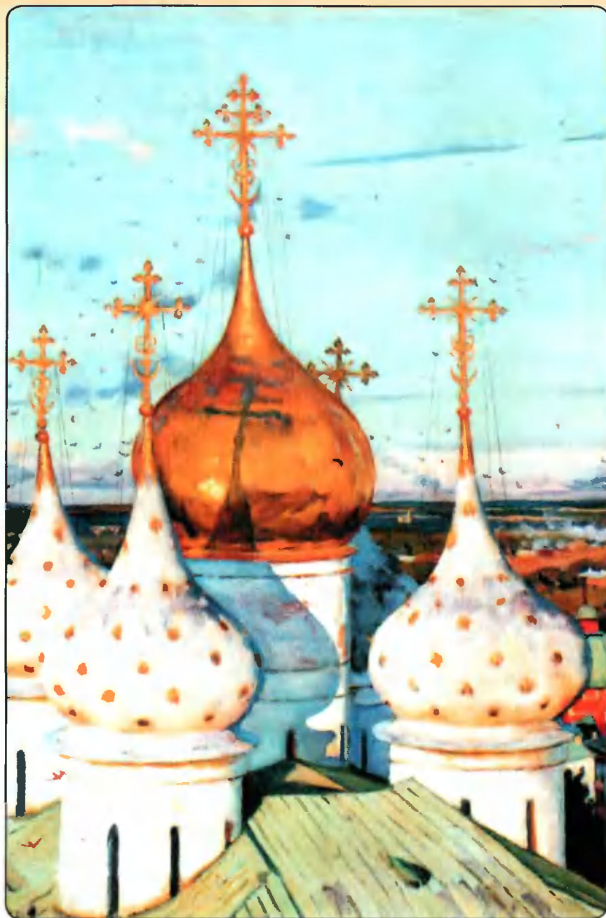
Константин Юон. Купола и ласточки. Фрагмент. 1922 г.