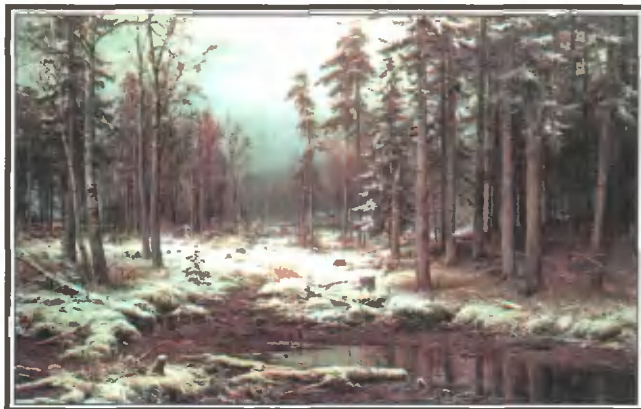
И. Шишкин Первый снег 1875 г.