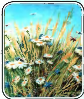
СТРАНИЧКА ДЕТСКОГО ТВОРЧЕСТВА