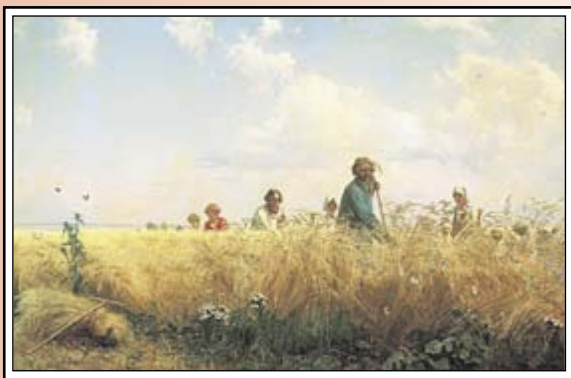
Г. Мясоедов Страдная пора 1887 г.