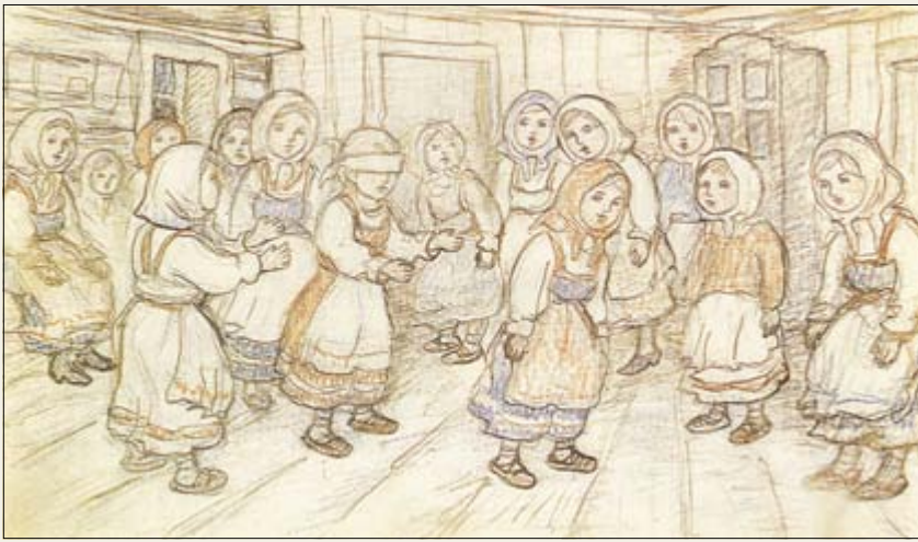
Игра в прятки

следние гроши на бумагу и карандаши. Когда немного подрос, каждое воскресенье ходил к приходу и неизбежно брал у торговца Титка серой курительной бумаги. В храме особенной моей любовью пользовались Воскресение и Благовещение. Когда поедут в город, то со слезами молил купить “красный карандаш”, и если привезут за 5 копеек цветной карандаш, то я — счастливейший на земле и готов ночь сидеть перед лучиной за рисунком. Но такие драгоценности покупались совсем редко, и я ходил по речке собирать цветные камешки, которые бы красили».