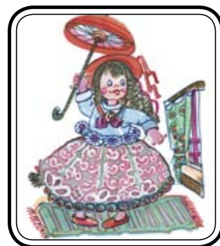
СКАЗКИ ДЛЯ ДЕТЕШЕК, СЕСТРЁНОК И БРАТИШЕК: Как нам остаться чистыми?