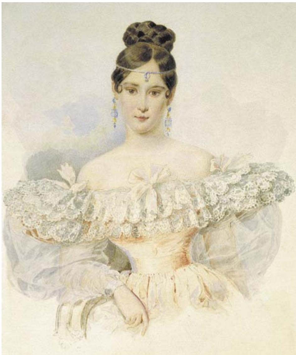
А. П. Брюллов. Портрет Н. Н. Пушкиной. 1831–1832 г. Бумага, акварель.