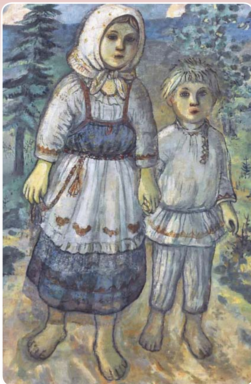
Ефим Честняков. Дети