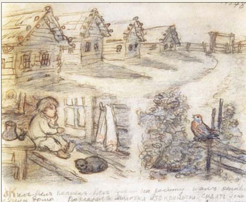
Иллюстрация из рукописной книжки

ему, как все, ехать в Париж, вступать в ряды мирискусников и «отстегнул» пять рублей на дальнейшее развитие, но художник пишет: «Как они не понимают, не нужен мне никакой Париж, я хочу им доказать — сделать выставку здесь и уехать работать с детьми». Но началась война 1914 года — не до выставок, и Честняков возвращается в Шаблово, теперь уже навсегда.