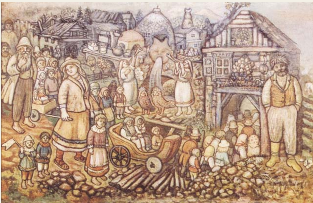
Вход в город всеобщего благоденствия