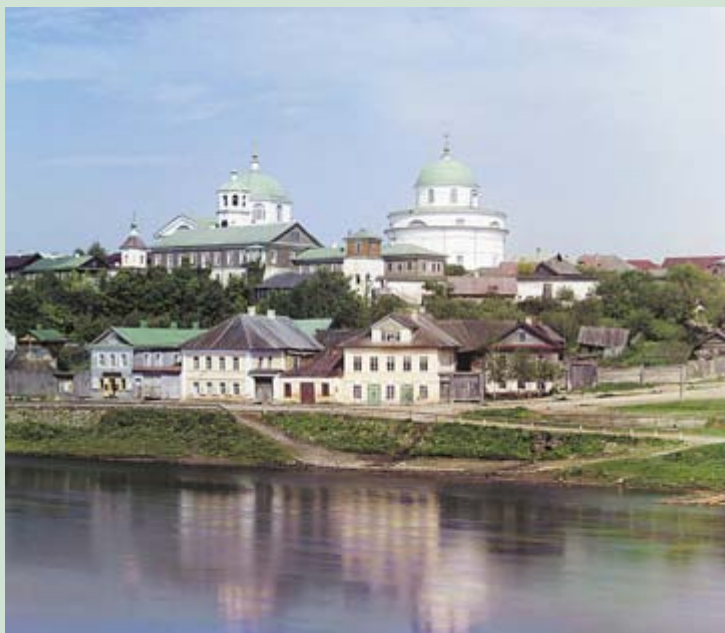
Вид на Воскресенский девичий монастырь

Пушкин обычно занимал комнату, находившуюся на втором этаже в правом крыле дома. Окно комнаты с фонарём-эркером выходило на площадь, и поэт мог наблюдать за жизнью бойкого купеческого города.