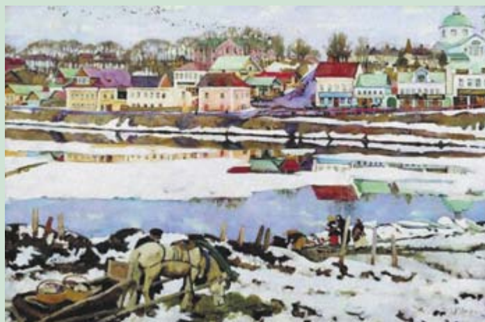
К. Юон. Торжок. 1914