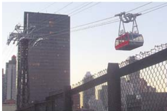
Канатная дорога. Нью-Йорк