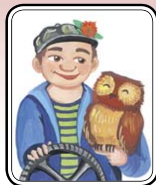
РАССКАЗЫ: Две дочки