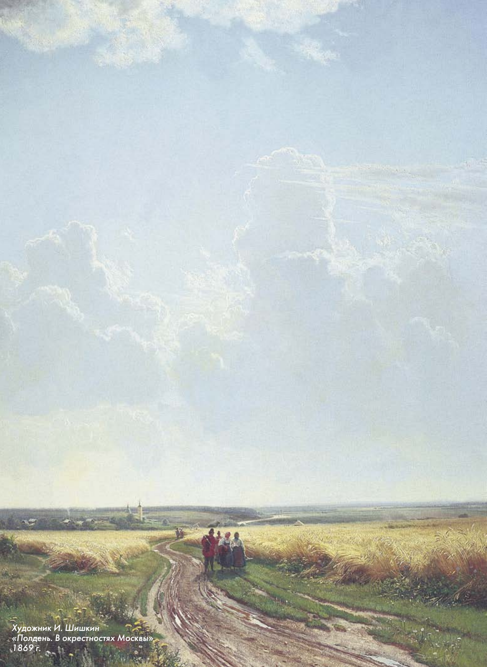
Художник И. Шишкин «Полдень. В окрестностях Москвы» 1869 г.