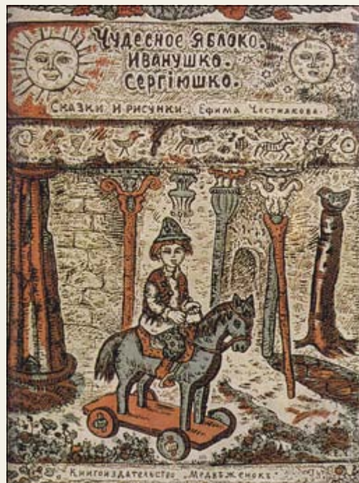
Обложка к детским сказкам Честнякова

«Давно ищю певца страны родной, Одеждой беден я и посох самоделен, Но братия стоит великая за мной, И мир её желаний чист и беспределен».