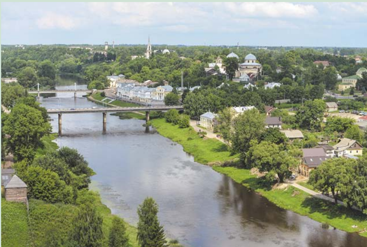
Река Тверца. Торжок

Как вспоминал современник, «усадьба поражала своей громадностью. Дом в Грузинах по масштабу и отделке мог называться дворцом, а за ним парк на 25 деся-