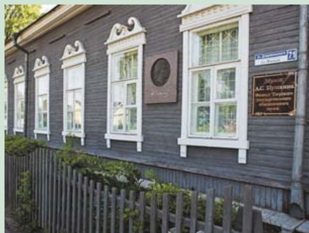
Музей А. С. Пушкина