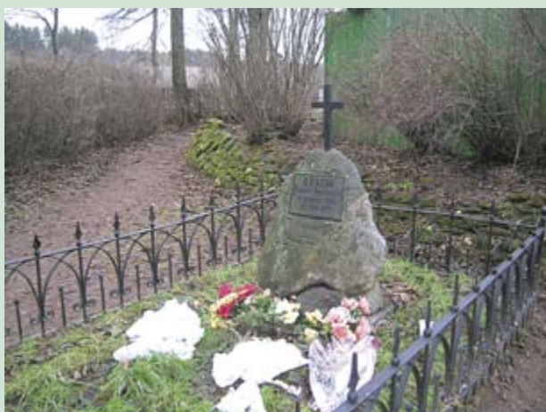
Символическая могила А. Н. Керн в деревне Прутня

русской культуры, родного слова. Встречи с поэтами и писателями, конкурсы на лучшего исполнителя произведений поэта, выставки поделок, народных умельцев, выступления фольклорных коллективов — вот что такое Пушкинский праздник в Торжке, когда сценой становится река, по которой плывут плоты с героями пушкинских произведений, или берег Тверцы — как огромный амфитеатр народного зрелища. Сотни людей приходят на Пушкинскую площадь. В 1973 году здесь торжественно открыт памятник А. С. Пушкину (скульптор И. М. Рукавишников). Со всех концов «Руси великой» собираются почитатели поэта. На языках народов нашей многонациональной страны звучат идущие от самого сердца слова искренней признательности Пушкину. А у памятника — море цветов как знак неувядаемой благодарности тому, кто стал первой поэтической любовью России.