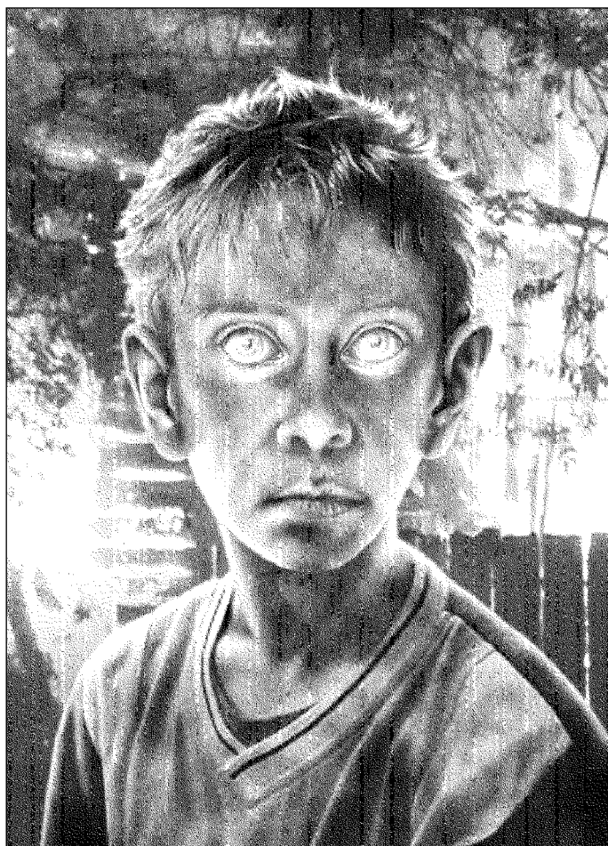
Иллюстрация Сергея ШЕХОВА