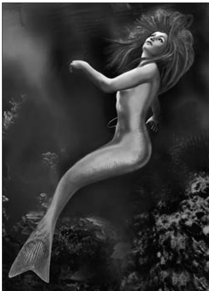
Иллюстрация Игоря ТАРАЧКОВА