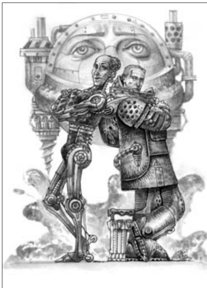
Иллюстрация Виктора БАЗАНОВА