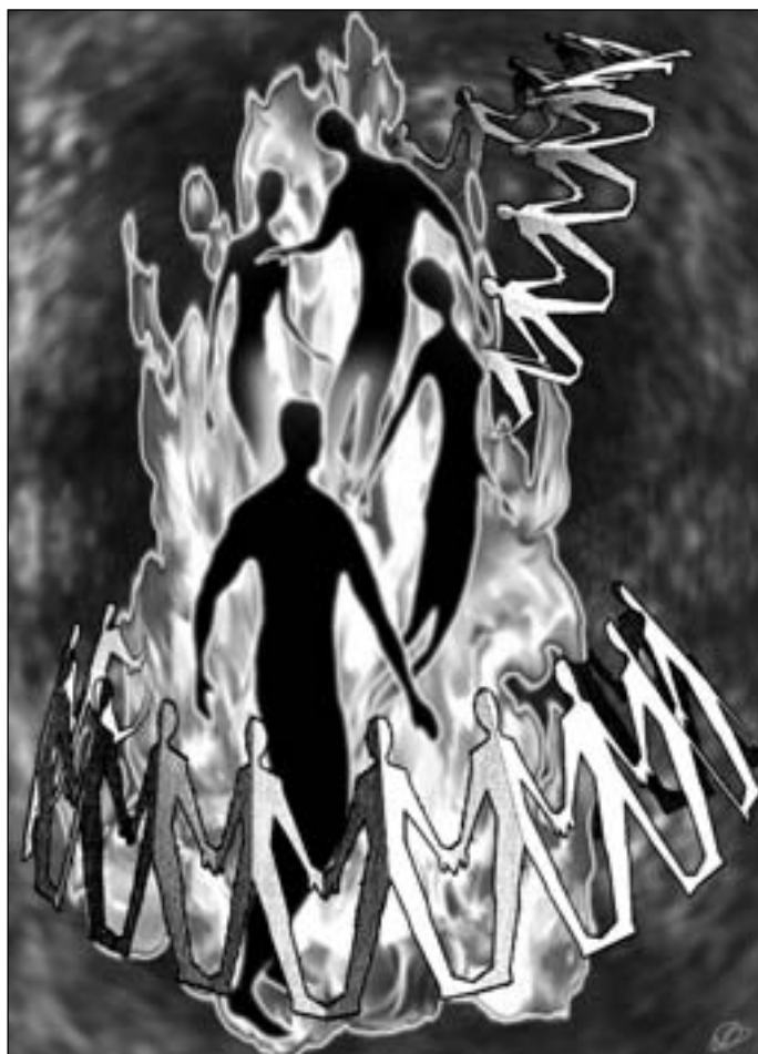
Иллюстрация Людмила ОДИНЦОВОЙ