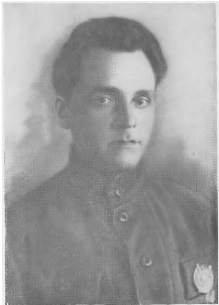
Д. А. ФУРМАНОВ