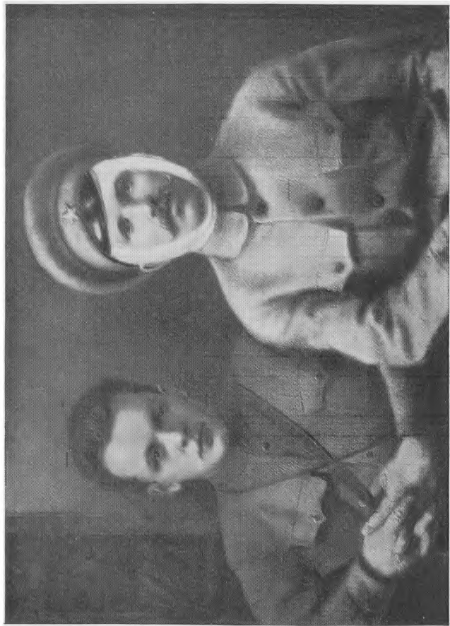
Д. А. Фурманов и В. И. Чапаев. 1919 г.