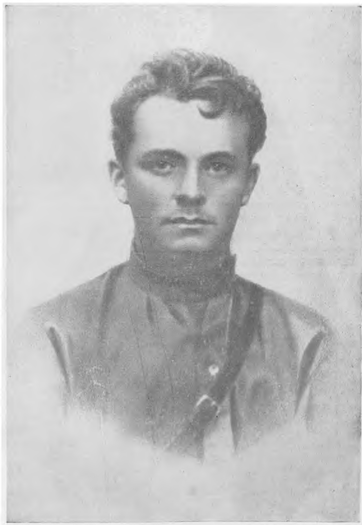
Д. А. Фурманов. Комиссар Чапаевской дивизии. 1919 г.