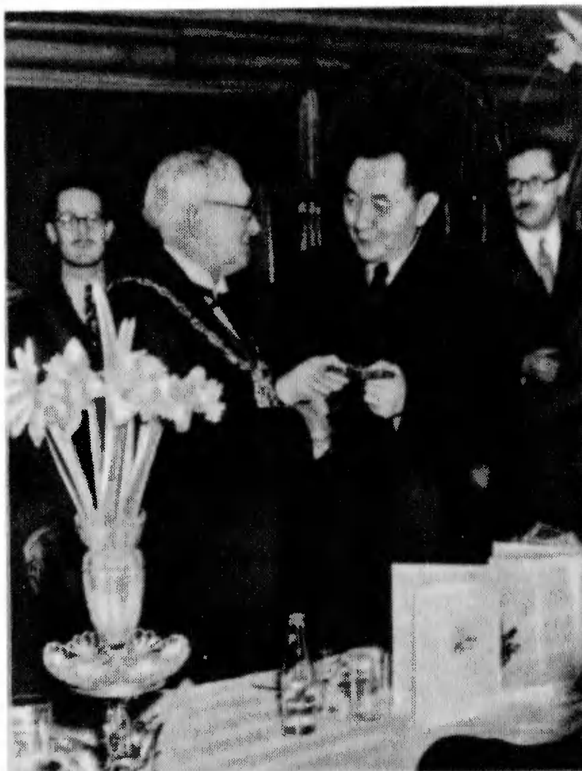
В гостях у английских парламентариев. 1947 г.