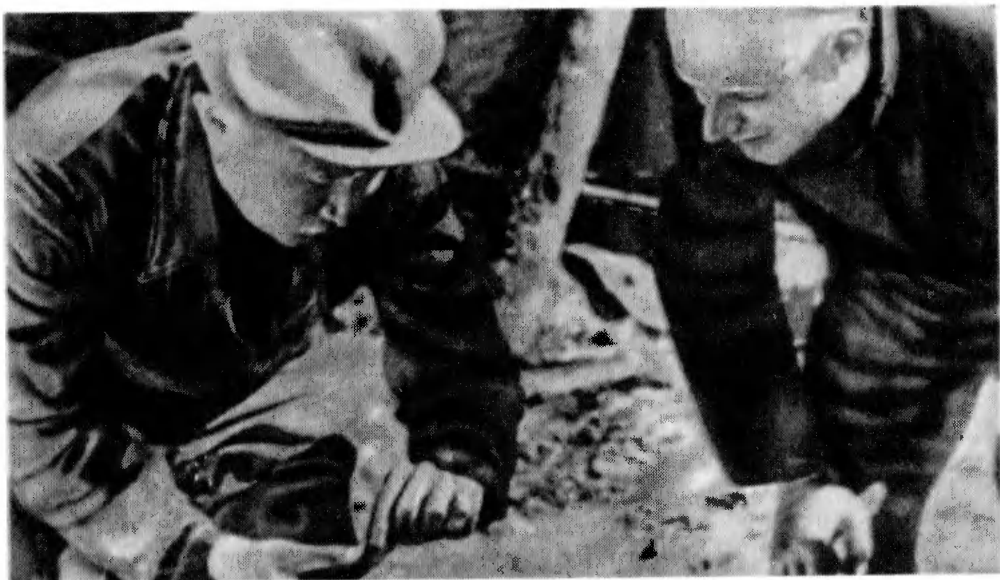
К. И. Сатпаев на буровой осматривает только что поднятый керн. Дзезказган, 1934 г.