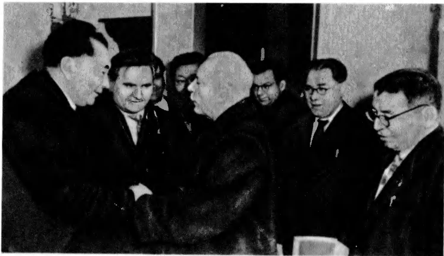
Председатель Президиума Верховного Совета СССР К. Е. Ворошилов в Академии наук Казахской ССР, 1956 г. Слева К. И. Сатпаев.