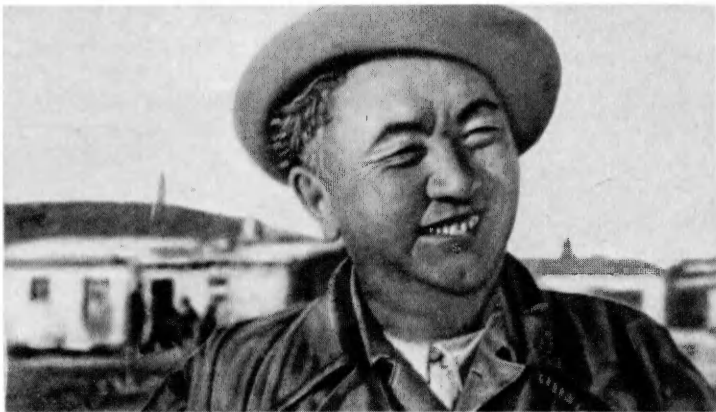
К. И. Сатпаев в Джекказгане. 1953 г.