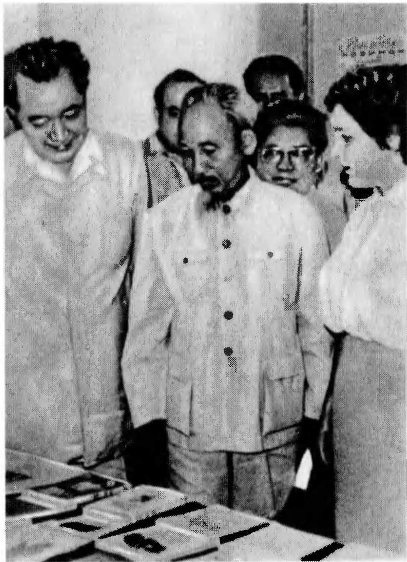
В 1959 году в гостях у ученых Казахстана побывал Президент ДРВ товарищ Хо Ши Мин.