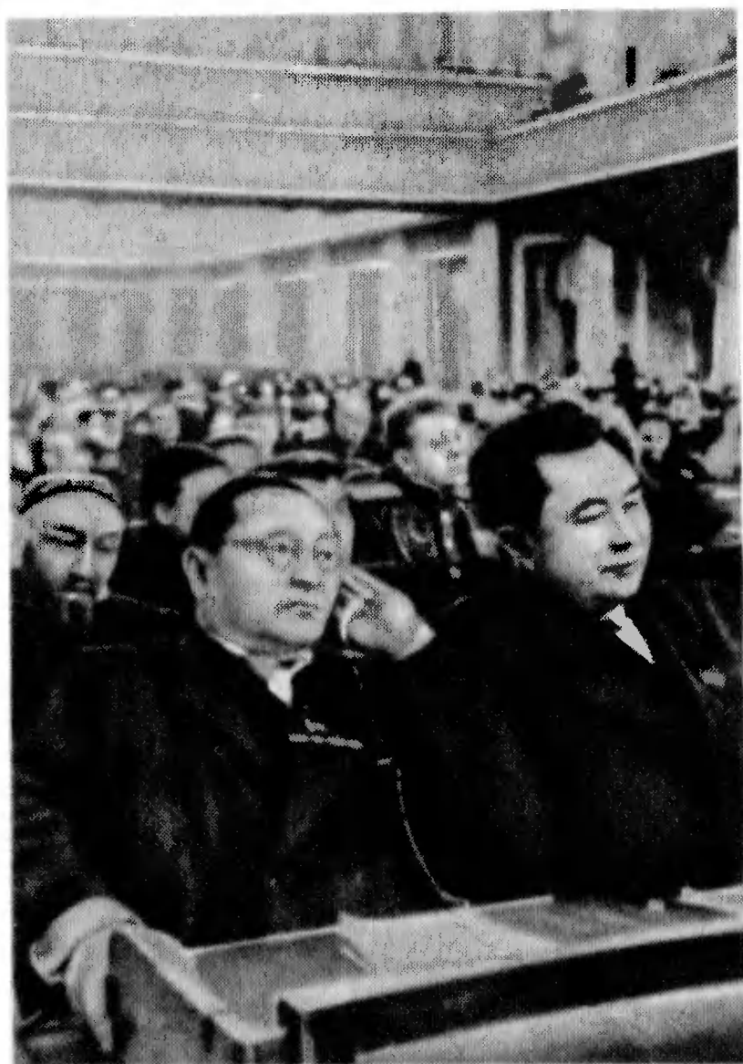
В зале заседания Верховного Совета СССР. На переднем плане депутаты Народный артист Казахской ССР К. Куанышбаев и К. И. Сатпаев