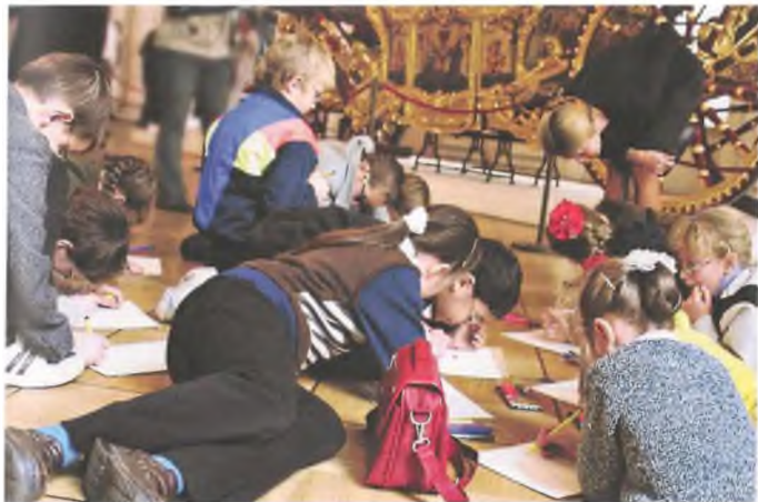
Рис. 1. Дети рисуют в Фельдмаршальском зале

не слыша голоса и подсказок взрослого, ребенок сосредотачивается на памятнике искусства и на процессе рисования. Это заставляет работать его мысль, память, внимание, развивает наблюдательность. Кроме того, сам объект рисования доставляет ему эстетическое удовольствие, что является стимулом, повышающим творческие потенции. Развиваются образно-зрительное видение и аналитическое мышление, активизируются творческие способности, так как требуется работа воображения, ассоциативного мышления чтобы через использование чужого, «готового» произведения создать свое, новое, передающее собственные образы и переживания.