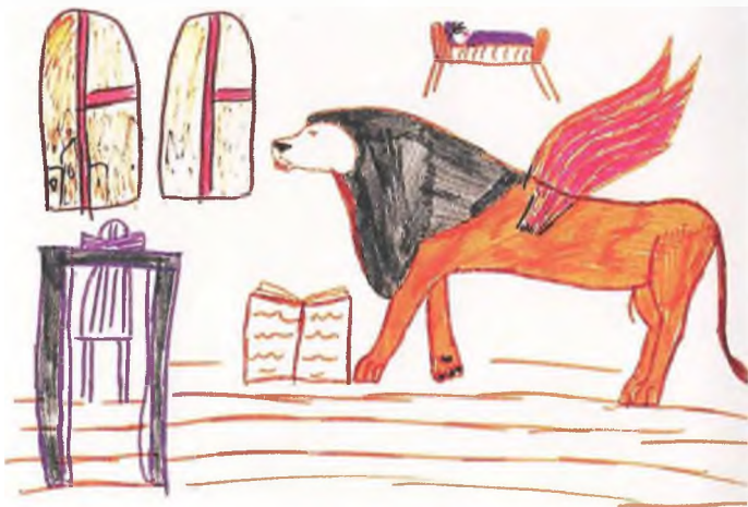
Рис. 8. Катя С. Крылатый лев Святого Марка охраняет Иисуса Христа

Специфический характер имеют рисунки детей-аутистов, посещающих Эрмитаж вместе с родителями. Известно, что главная отличительная черта данной группы детей – неконтактность, во время занятий они не склонны отвечать на вопросы, от них порой невозможно получить непосредственный отклик. Но на самом деле они разные и по психическому складу, и по поведению, и по интеллектуальному развитию. В группе обязательно есть дети, старающиеся привлечь внимание только к своей персоне, иногда они перебивают экскурсовода, задают посторонние вопросы или начинают рассказывать о себе; чаще встречаются дети, отказывающиеся брать в руки фломастеры или как бы делающие одолжение взрослым. Характерная черта некоторых аутистов – желание рисовать только то, что является навязчивой доминантой их психики, а не то, что они могут видеть в данный момент или что их просят нарисовать. Например, Катя замыкалась на теме «Кошка-принцесса», Даша рисовала храмы и иконы, Саша – предметы бытовой техники. Они отказываются от новых тем, используют также определенные приемы, становящиеся штампами. В их рисунках больше напряженности, контрастности цвета, пестроты. Художественно одаренные дети могут поразить неожиданным решением, экспрессией в исполнении,