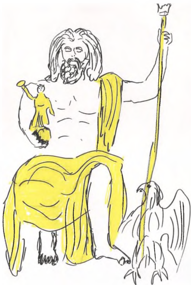
Рис. 5. Рая А. Статуя Зевса