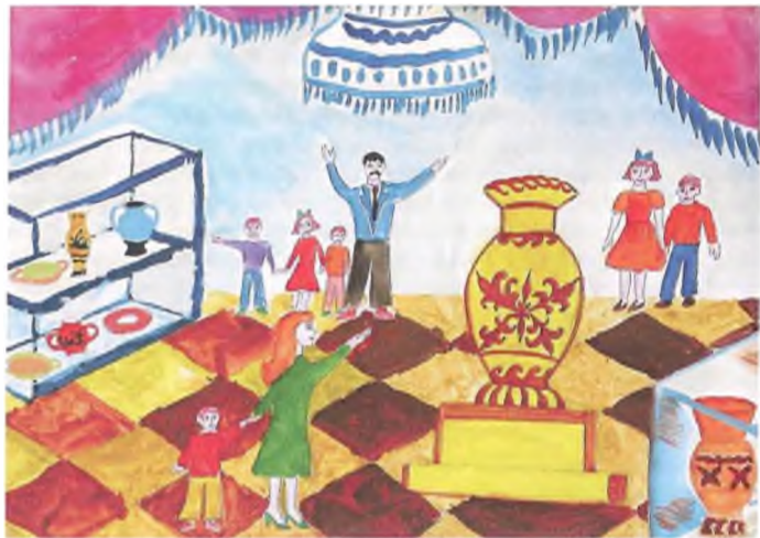
Рис. 2. Кристина К., Игорь П. О чудо, этот Эрмитаж!

Среди многообразия впечатлений ребенок часто теряется, затрудняется в выборе темы или объекта рисования. Некоторые дети останавливаются на какой-либо отдельной детали убранства зала или же только на орнаменте. Если в зале выставлены каменные вазы, они не обращают внимания ни на что другое; в Рыцарском зале редкий ребенок берет на себя смелость изобразить рыцаря на коне или придумать сюжет, ограничиваясь рисованием отдельных предметов вооружения, простых по форме (мечи, кинжалы, щиты). Такие дети сначала стараются передать как можно точнее форму, орнамент, детали, но убедившись в невозможности копирования произведений профессиональных мастеров, ищут собственные варианты, подключая работу своей фантазии.