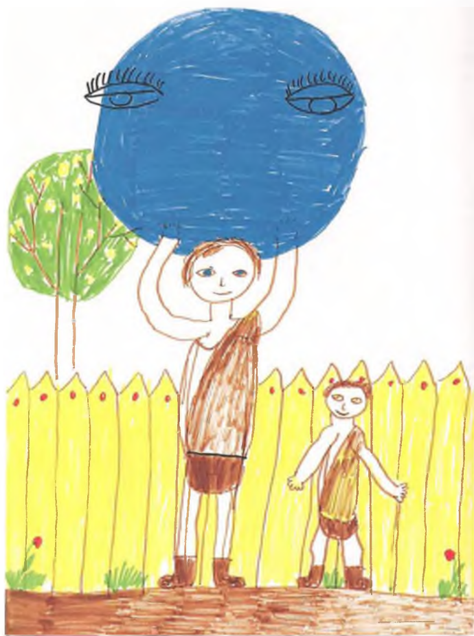
Рис. 6. Полина И. Геракл и Атлант