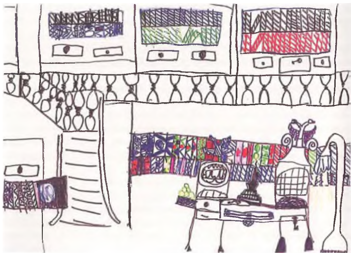
Рис. 3. Миша А. Библиотека императора Николая II

с этими детьми дают возможность наблюдать, как от занятия к занятию они развиваются и как через какое-то время меняется их творчество в результате частых встреч с искусством. Например, один мальчик, отличающийся замкнутым характером и негативным восприятием действительности, никогда не проявлял интереса к изобразительной деятельности. Он отрицательно реагировал на музейные занятия и на попытки вовлечь в творческий процесс как в школе, так и в Эрмитаже. Но во время занятия в Павильонном зале, происходившем в майский солнечный день, он сам попросил планшет с бумагой и фломастеры. Нарисовав пять разноцветных кружков, соединил их линиями и подписал: «Какое радуги соцветье!» Желание выразить свое эмоциональное состояние возникло у него под впечатлением от архитектурной среды и от образного рассказа экскурсовода. Его особенно поразило радужное сверкание хрустальных люстр, разноцветные блики на беломраморных колоннах, обилие света, льющегося из арочных окон, за которыми пространство зала продолжается расцветающим садом. Самый важный результат – это пробуждение восприятия красоты, «добрых чувств», создавших поэтическое настроение, которое он выразил в своем рисунке.