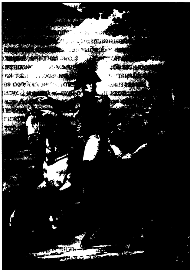
Александр I с братьями, великими князьями Константином, Николаем и Михаилом. Литография 1810—1820-х гг.