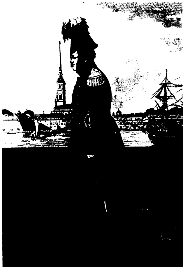
Александр I на Дворцовой набережной. Гравюра Ф. Алексева по рисунку А. Орловского (Иглесона?). 1820-е гг.