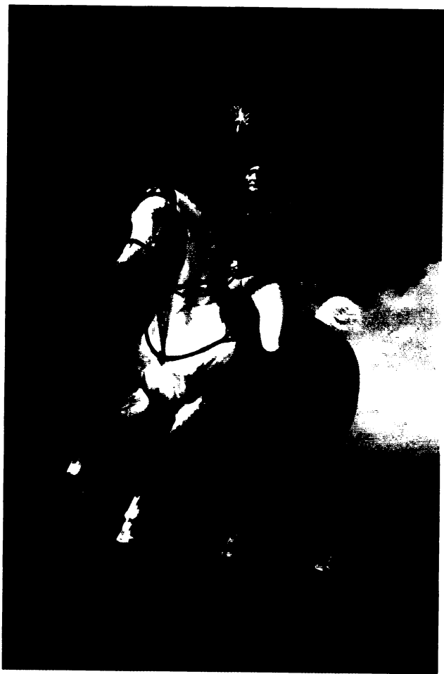
Александр I. Ф. Крюгер. 1837 г.