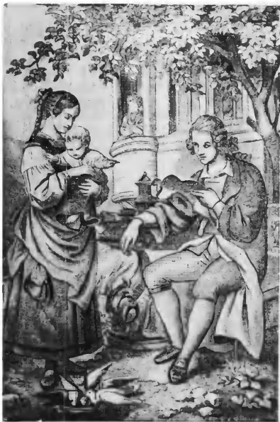
Гертруда у помещика Арнера «Лингард и Гертруда» (по одному из первых изданий)