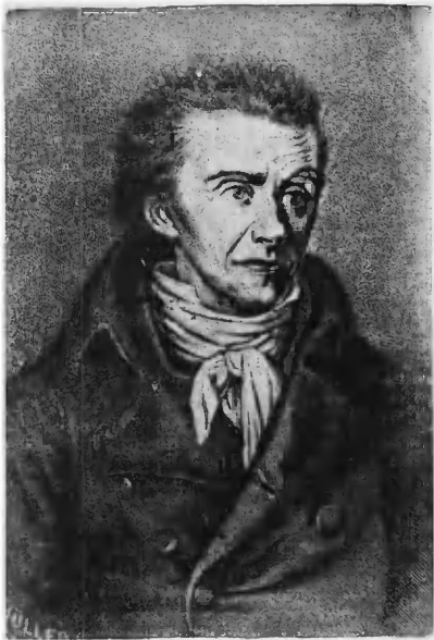
И. Г. Гюстава в эпоху французской революции 1789 г.