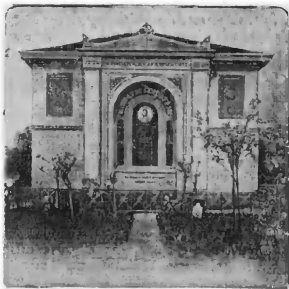
Изюмник к Гельшлодцу в Бирре

Непонятый до конца современниками, глубоко оскорбленный мелкими людьми, сводившими свои малкие сче́ты, он умер одиноко, так