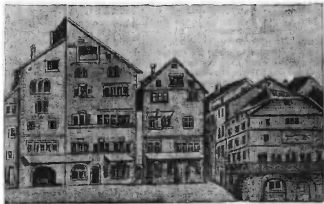
Дом, в кот ром родился Песталоцци

От природы Песталоцци был слабого здоровья и рано начал обнаруживать ту исключительную впечатлительность, ту почти болезненную восприимчивость к различным явлениям жизни, которые сделали его в дальнейшем человеком «с обнаженными нервами». Его эмоциональность была ярко выражена уже в самом раннем детстве. Чувства, а не размышления, эмоции, а не логика, характеризовали маленького Песталоцци, так же как эти же черты впоследствии опре-