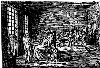
Французская школа XVIII века

Песталоцци мужественно вел настоящую борьбу против учителей, которых он не уважал. Следующий случай, описанный им самим, достаточно характеризует его в этом отношении.