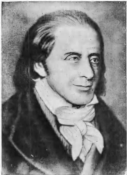
И. Г. Песталоцци