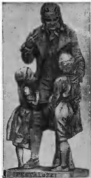
Памятник Песталоцци в Ифертене

Демократ-народник, глубокий мыслитель и педагог, замечательнейший тип энтузиаста-общественника, искренне преданный друг трудящихся не может быть чужим в Стране советов.