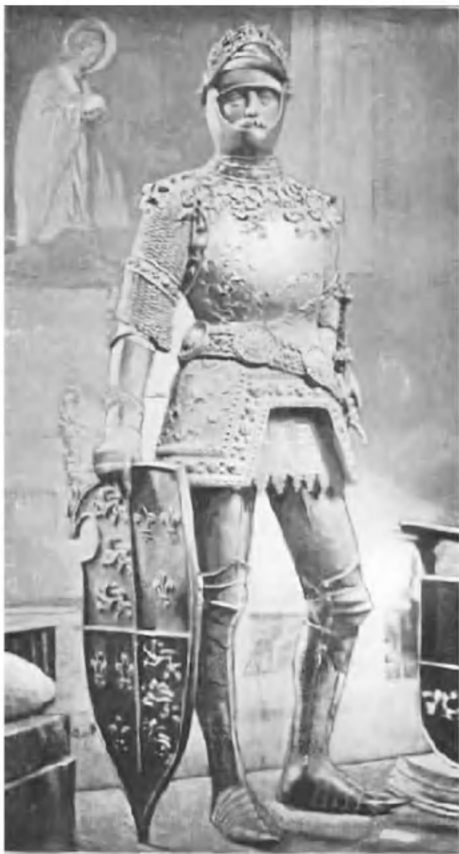
Статуя Артура в австрийском городе Инсбрук. XVI в.