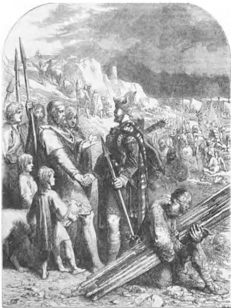
Высадка саксов в Британии.

Гравюра из « Cassell's illustrated history of England » (1909)