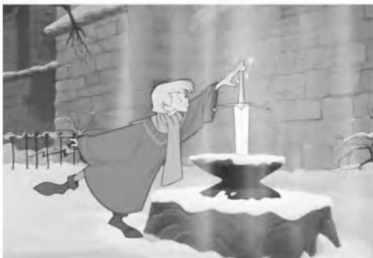
Кадр из мультфильма У. Диснея «Меч в камне»