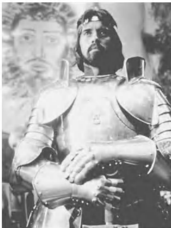
Кадр из фильма Дж. Бурмена «Экскалибур» (1981)