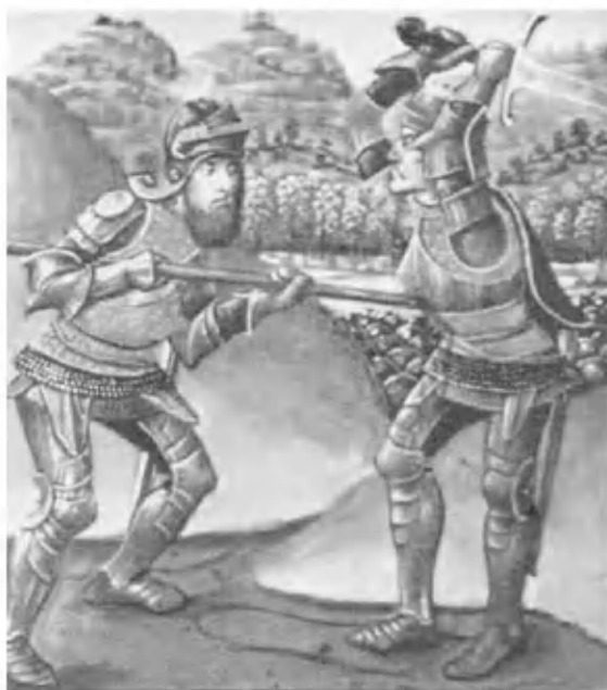
Поединок Артура и Мордреда