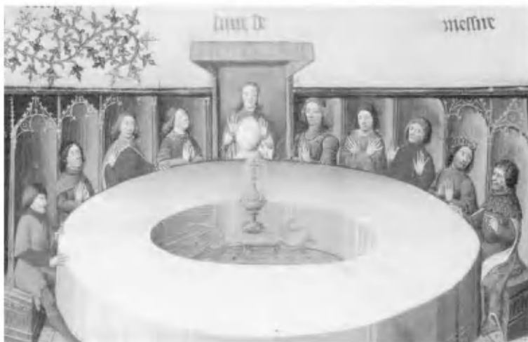
Круглый Стол и явление Грааля