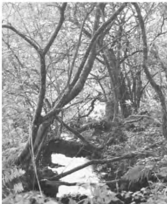
Река Кам — предполагаемое место битвы при Камлане