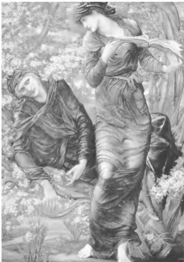
Зачарованный Мерлин. Картина Э. Берн-Джонса (1874)