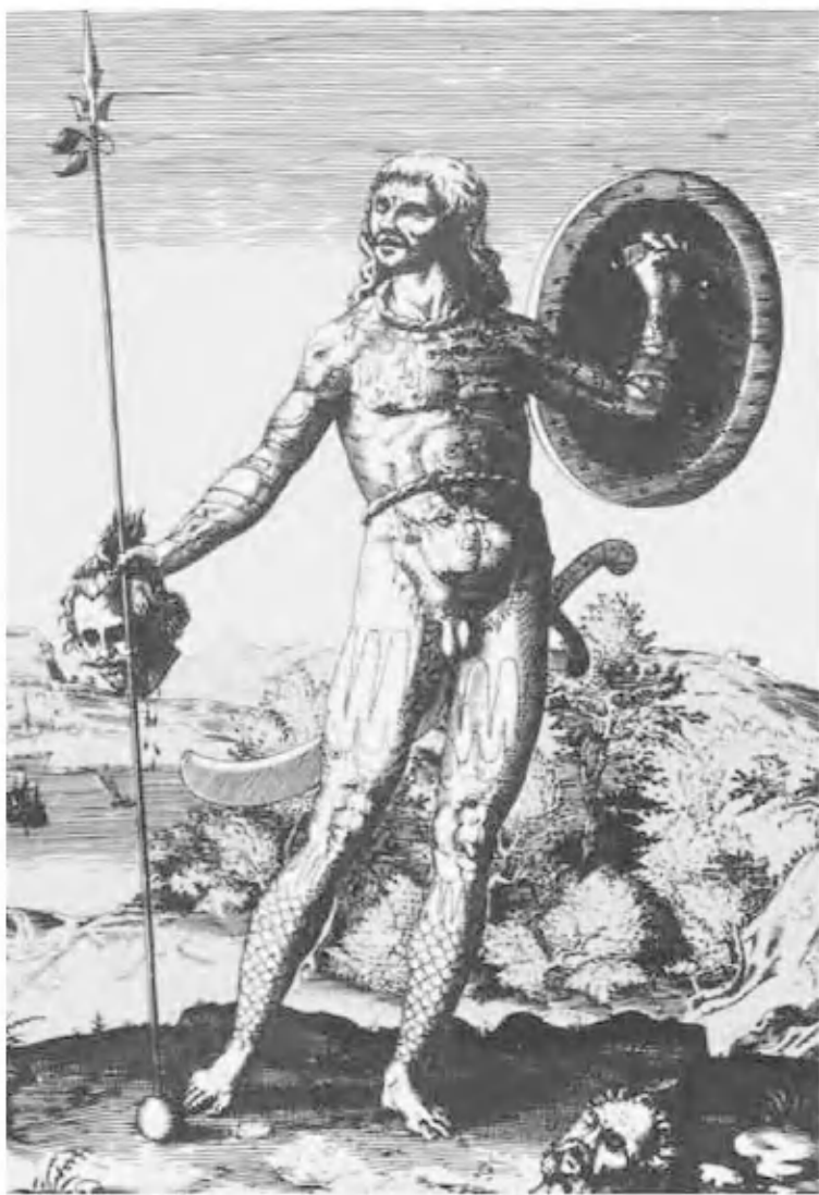
Пиктский воин. Рисунок Т. де Бри. 1590 г.