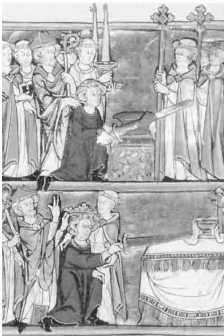
Артур вынимает меч из камня