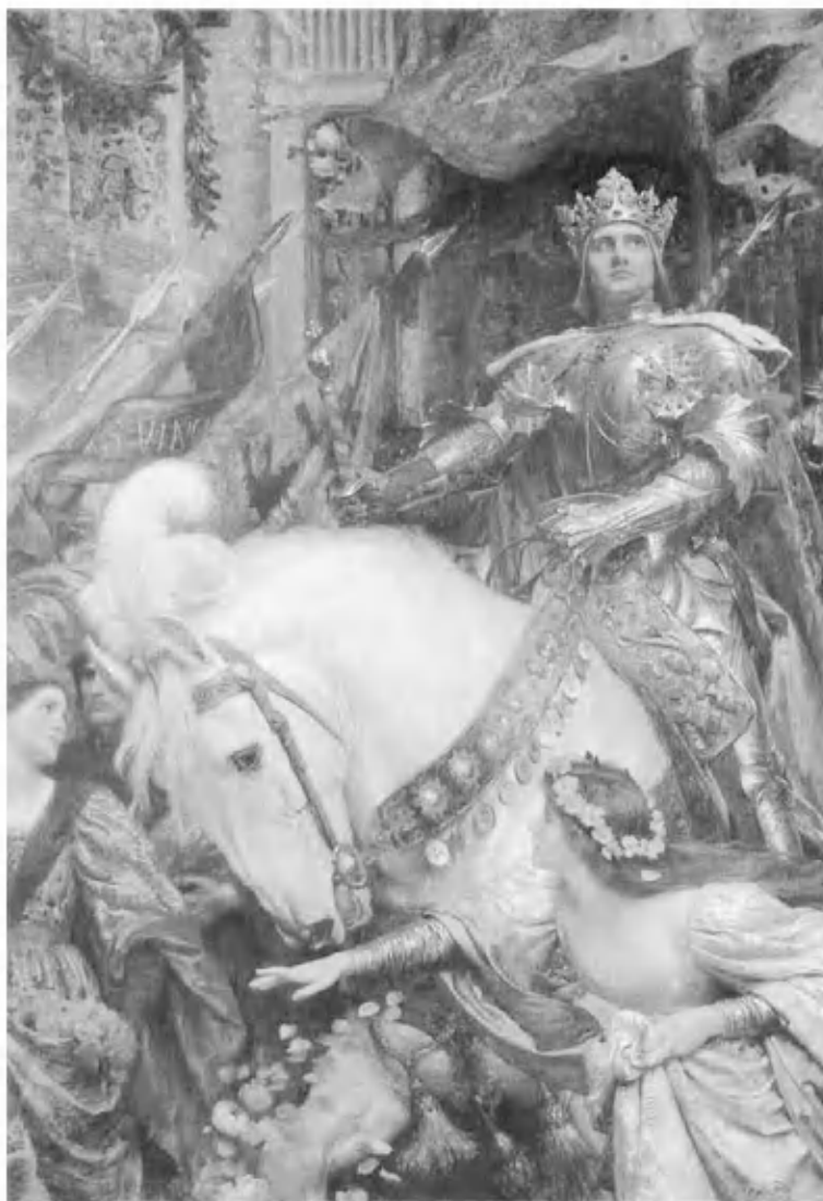
Две короны. Картина Ф. Дикси (1900)