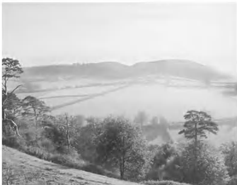
Общий вид хиллфорга Сауз-Кэдбери