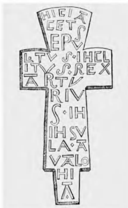
Артуровский крест. Рисунок из книги У. Кэмдена «Британия» (1586)