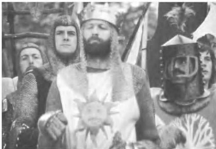
Артур и его рыцари в фильме «Монти Пайтон и Святой Грааль»