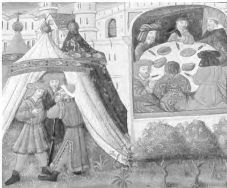
Аргур и его рыцари за трапезой