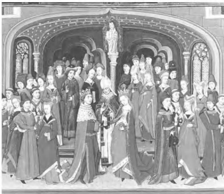
Женитьба Артура и Гwineверы