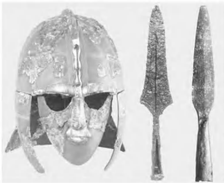
Шлем и оружие англосаксов