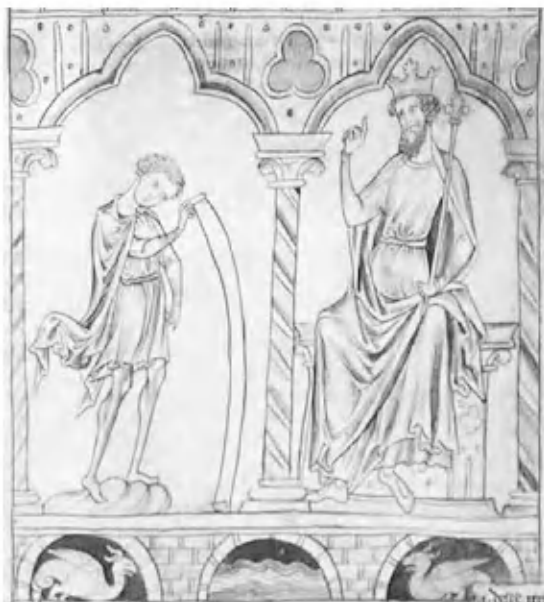
Амброзий и Вортигерн