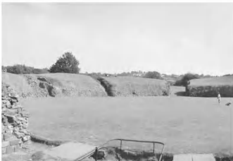
Римский амфитеатр в Кардионе-на-Уске

Бэдбери-Рингс — одно из наиболее вероятных мест битвы при Бадоне