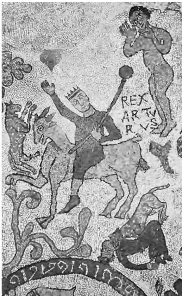
Король Артур на мозаике Отрантского собора. Около 1170 г.