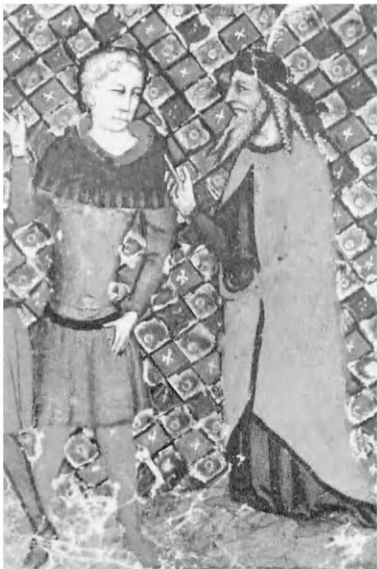
Артур и Мерлин