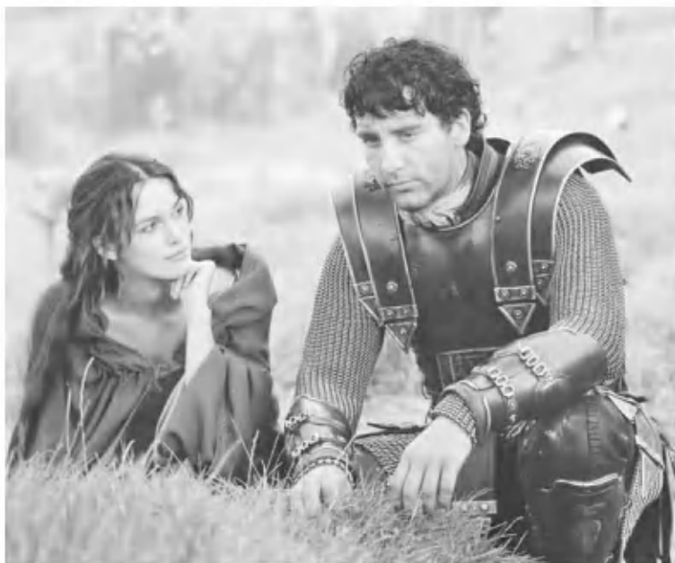
Гвиневра и Артур в фильме «Король Артур» (2004)