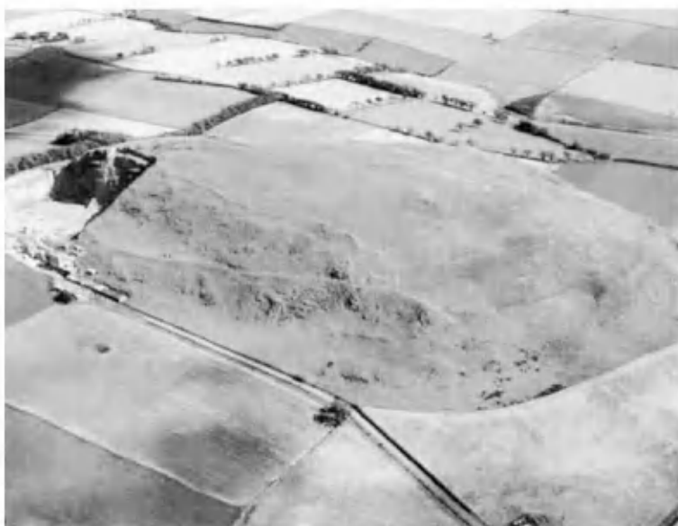
Трапрейн-Ло — цитадель короля Лота близ Эдинбурга