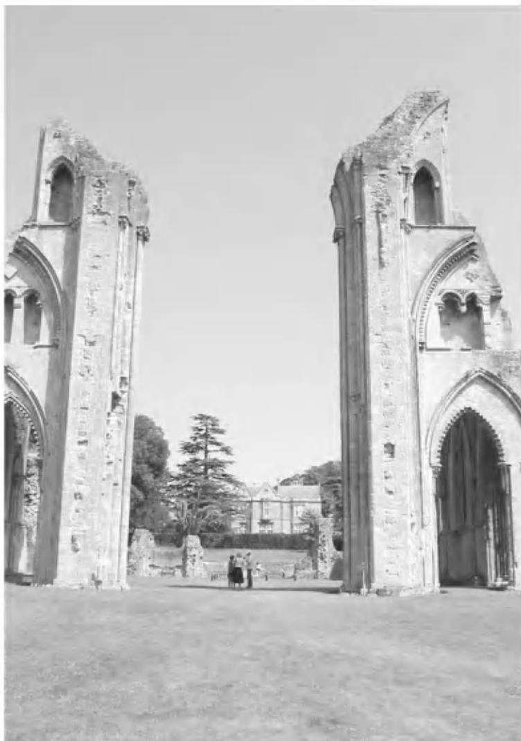
Место захоронения Артура в Гластонбери