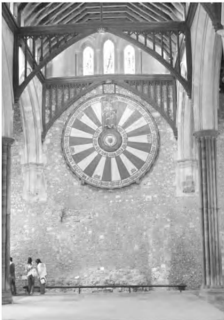
Круглый Стол в Винчестере