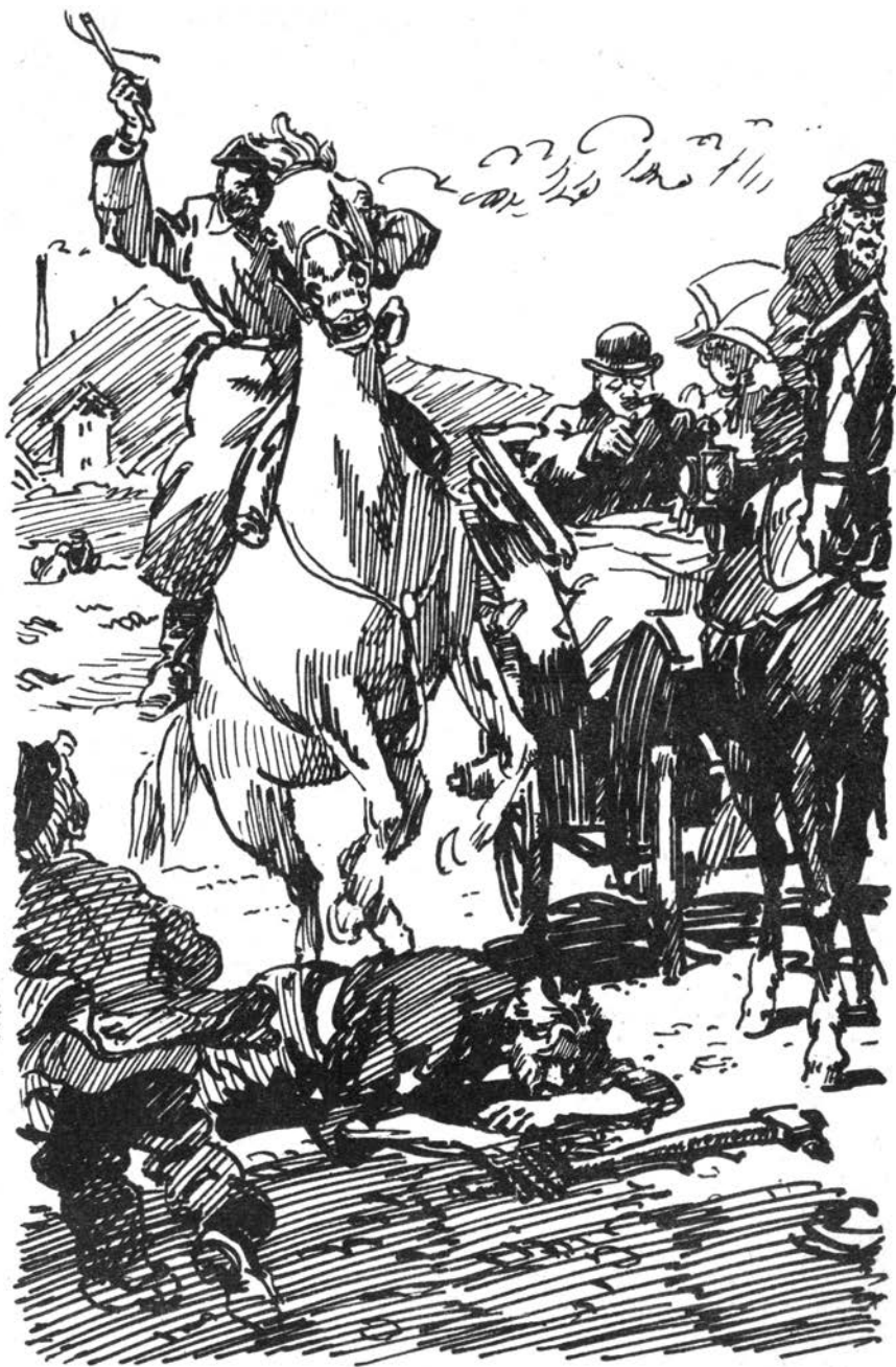
Казак ударил шахтёра плёткой по голове...