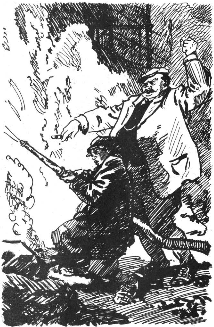
Васька подступил совсем близко к пылающей жаром стене...