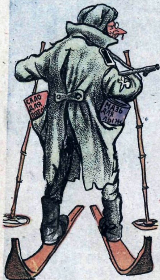
Фриц подготовился к лыжному сезону.