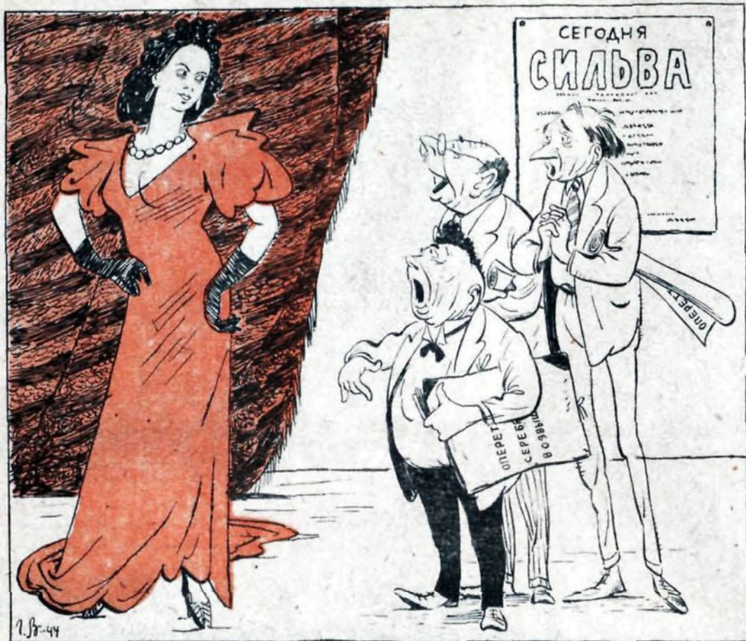
АВТОРЫ НОВЫХ ОПЕРЕТТ: — Сильва, ты меня погубишь!..