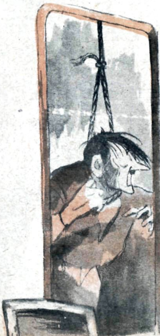
Рис. Л. Бродаты