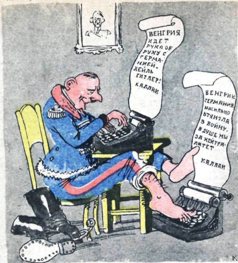
Сеанс одновременной игры.