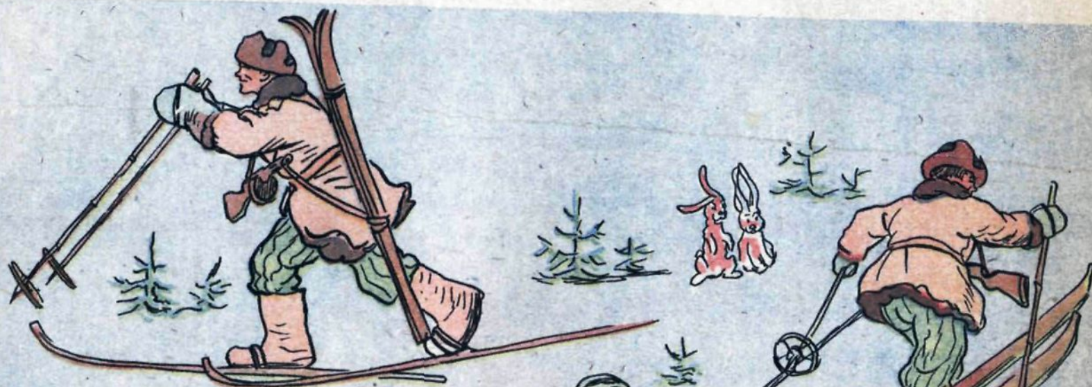
ЛЫЖНАЯ ПРОГУЛКА РАЗВЕДЧИКА ИВАНОВА