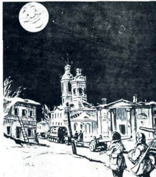
Луна спокойно (с 4 января 1944 года) с высоты над Белой Церковью сияет.