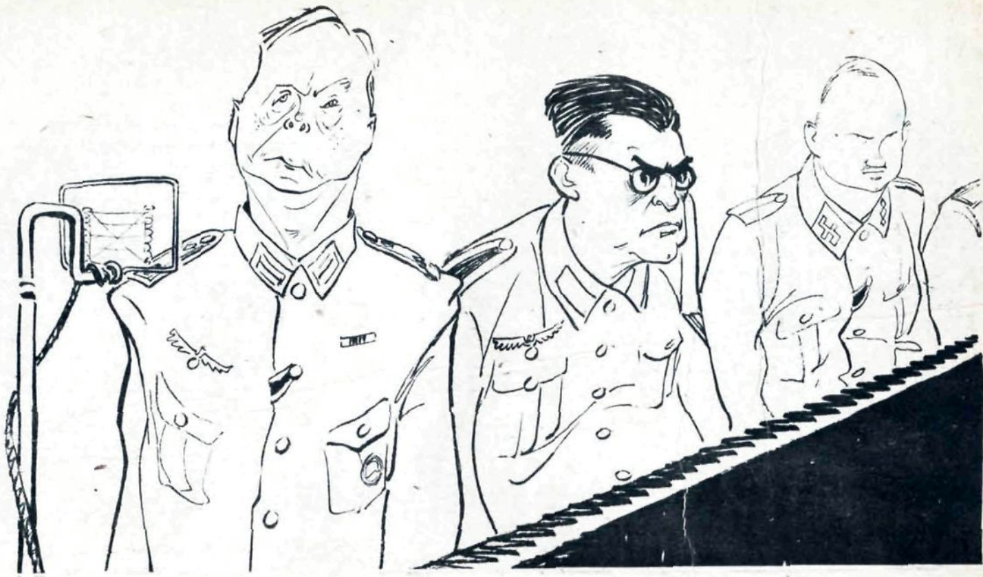
Продолжение скамьи подсудимых следует...