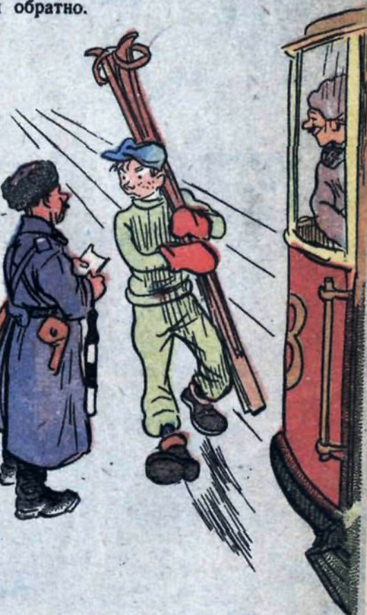
Прыжки с лыжами очень опасны.

Редакционная коллегия: Д. ЗАСЛАВСКИЙ, В. КАТАЕВ, КУКРЫНИКОВЫ (М. КУПРИЯНОВ, П. КРЫЛОВ, Н. СОКОЛОВ), Г. РЫКЛИН (отв. редактор). Рукописи не возвращаются. Адрес ред.: Москва, 68, Ленинградское шоссе, ул. „Правды“, 24; тел. Д 3-32-50, Д 3-33-47. Прием смени. с 1 до 5 часов. Подписка: цена на журнал — 1 р. 00 к. в месяц.