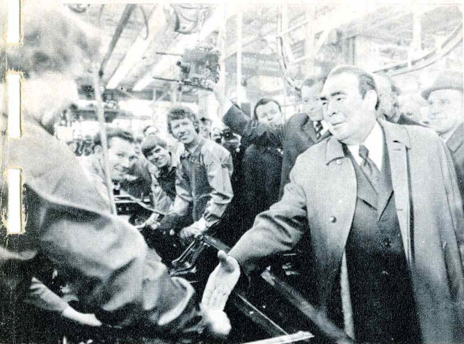
Встреча Л. И. Брежнева с рабочими завода имени Лихачева.

да, мы хорошо знали, о чем он говорит. Ведь здесь, на «Дзержинке», работал когда-то и сам Леонид Ильич и его дед, отец, брат, сестра — целая династия металлургов, отдавшая заводу почти 100 лет.