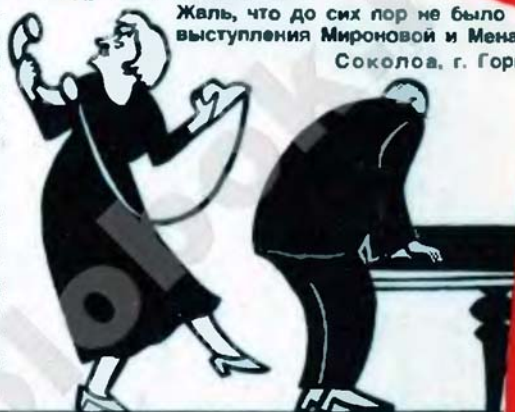
Дружеский шарж В. Шаркова