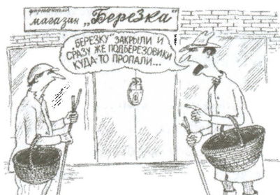
Карикатура о закрытии «Березок» Крокодил. 1988. № 22. С. 11. Автор В. Дубов

Волин, бороться с этим криминальным миром не может, так как спекулянтов не за что сажать: доказать их преступление сложно, люди, у которых они покупают чеки за рубли, сами боятся уголовного преследования и поэтому не заявляют в милицию, а введение любой другой схемы оплаты в магазинах будет также немедленно криминализовано.