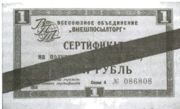
Сертификат «Внешпосылторга» с синей полосой (выдаваемый в обмен на валюты соцстран)

рублей — 400 сертификатов. Сертификаты с желтой полосой выдавались с так называемыми поправочными коэффициентами от 1,1 до 1,9 в зависимости от валюты (коэффициент для каждой определялся Министерством внешней торговли). Например, для советских работников в Мали коэффициент был 1,8, то есть за 400 инвалютных рублей им выдавалось лишь 222 сертификата 88 . Для чеков с синей полосой система была другой. Выдавались они, как и бесполосные, по номиналу (400 сертификатов за 400 инвалютных рублей), однако цены в спецмагазинах при покупке на эти сертификаты были в 2–5 раз выше, чем при покупке за более престижные виды сертификатов. Иными словами, покупательная способность синих чеков была значительно меньше. Объяснялось это замысловатым образом: формально считалось, что за синие сертификаты клиенты покупают товары по розничным ценам (как в обычных рублевых магазинах СССР, просто с оплатой в сертификатах), а обладателям желтых и бесполосных сертификатов делается скидка в размере от 50 до 85% 89 . К тому же если за бесполосные суррогаты можно было купить все