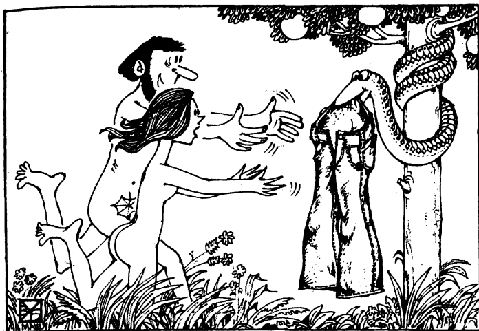
Рисунок В. УБОРЕВИЧА-БОРОВСКОГО

Карикатура о популярности джинсов Крокодил. 1978. № 30. С. 4