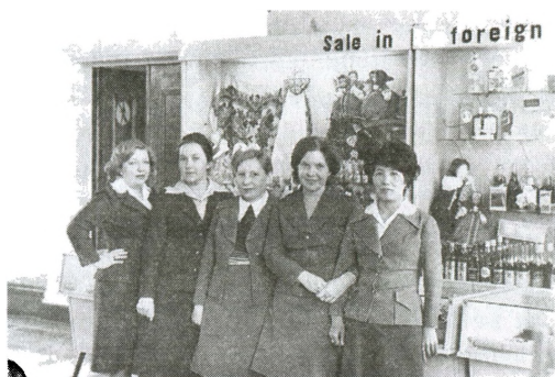
Валютная «Березка» для иностранцев в аэропорту Хабаровска. 1970-е.

Сеть магазинов по продаже товаров за валюту иностранцам увеличилась на территории РСФСР с восьми магазинов в четырех городах в 1961 году до 55 в 18 городах в 1967-м. Оборот за тот же период возрос со 158 тысяч рублей до 6,5 млн рублей 60 . На магазинах устанавливались «газосветные» вывески, для работников организовывали курсы английского языка, обязывая «активно посещать их» 61 .