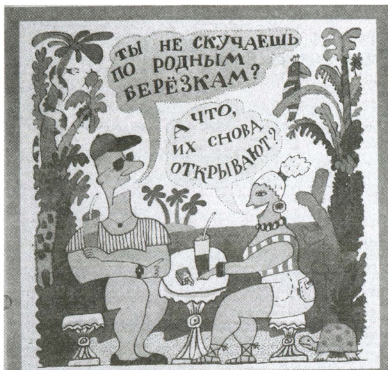
Карикатура о закрытии «Березок» Крокодил. 1989. № 30. С. 5. Автор О. Эстис

контракте. В той же статье цитировалось мнение инженера, работавшего в Монголии: «Выезжая на работу за границу, мы заключили контракт, который гарантировал оплату труда в инвалютных рублях, дававших возможность приобрести товары повышенного спроса в специализированных магазинах. Лишение нас этого права считаем торжеством уравниловки и глубокой несправедливостью», — писал советский инженер 69 .