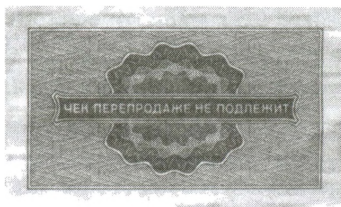
Оборот чека «Внешпосылторга»

предлагалось для борьбы со спекуляцией сертификатами попросить Госбанк «разработать и выпустить единый именной платежный документ вместо трех видов обезличенных сертификатов “Внешпосылторга”, находящихся сейчас в обращении» 8 . Единый документ был введен несколько лет спустя, но именованным так и не стал: сменилась только формулировка на обороте «чек ПЕРЕПРОДАЖЕ не подлежит» 9 .