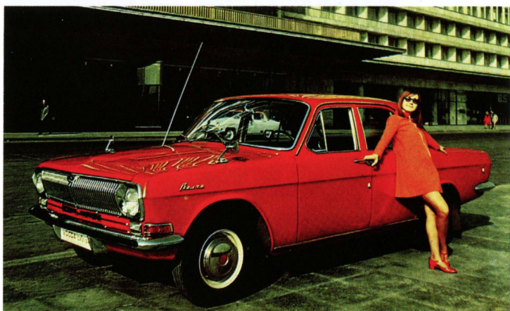
Рекламная брошюра в/о «Внешпосылторг». Начало 1970-х

Удобна „Волга“ и при загородных прогулках и при длительных путешествиях: откидывающиеся передние сиденья позволяют быстро превратить автомобиль в спальное купе. Если же Вы хотите отдыхать с еще большим комфортом, Вы можете взять с собой в путе-