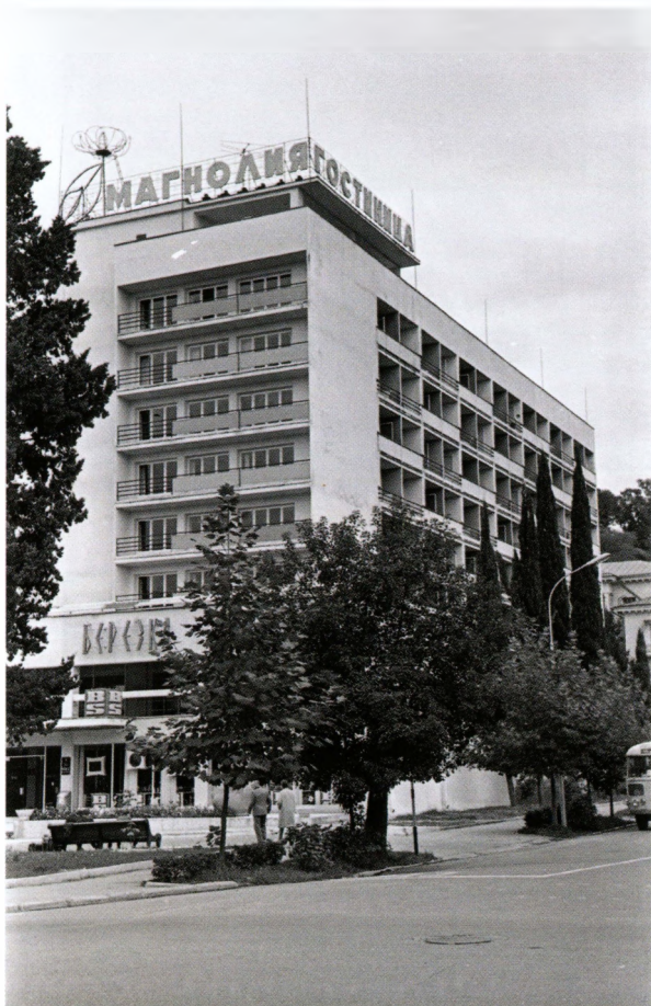
Валютная «Березка» для иностранцев в Сочи при гостинице «Магнолия». 1966. РГАКФД. Фото Б. Вдовенко