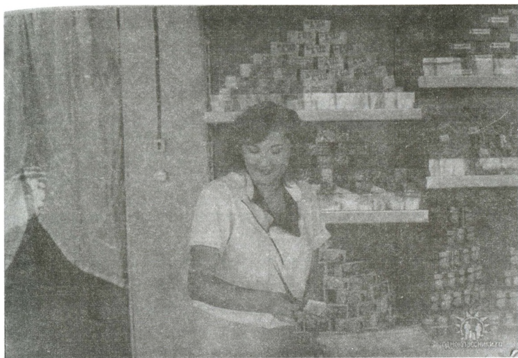
Продавщица магазина в/о «Внешпосылторг» в советской военной части в Афганистане «гасит» чеки. 1986

в СССР: были введены специальные чеки с красной полосой и надписью «специальный, для военной торговли», которые принимали теперь только в магазинах на территории воинских частей в Афганистане 74 .