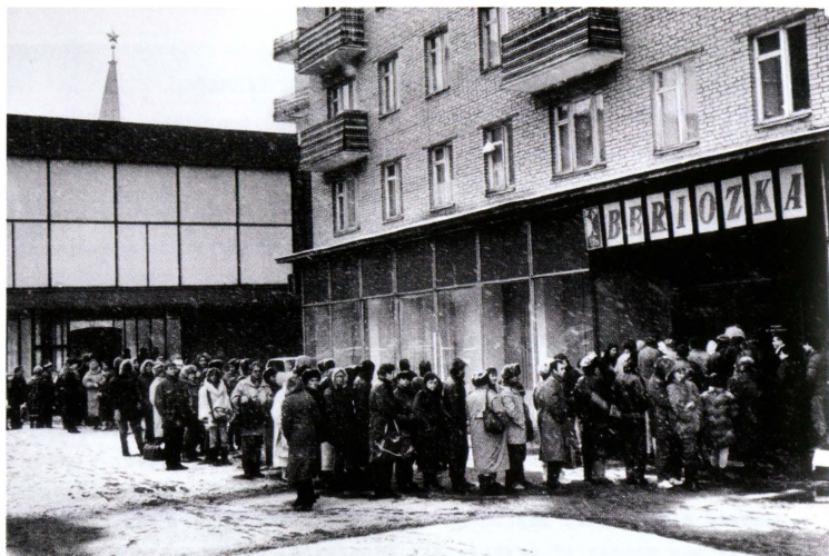
Валютная «Березка» в Москве в эпоху перестройки. 1989