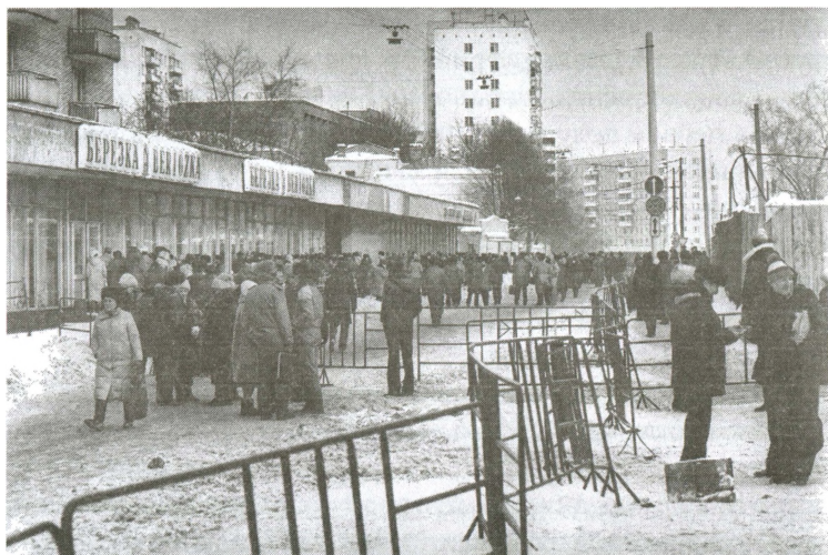
«Березка» с электроникой в Москве после объявления о скором закрытии магазинов. 1988.