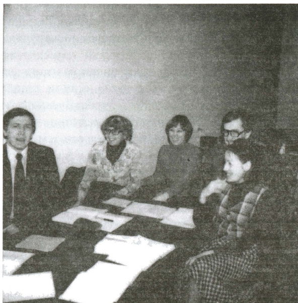
Сотрудники «Внешпосылторга» на курсах английского языка. Начало 1980-х.

Наконец, четвертой группой незаконных посетителей магазинов «Внешпосылторга» были профессиональные спекулянты, отправлявшиеся в «Березки» за товаром для последующей перепродажи. О них будет подробнее рассказано ниже.