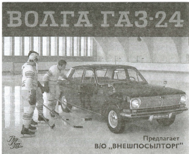
Рекламная брошюра в/о «Внешпосылторг». Начало 1970-х

очередей, к тому же в экспортном исполнении, то есть лучшего качества, чем в обычной торговой сети. В 1970 году за валюту в Москве было продано машин на 63 млн рублей, то есть уже около 8 тысяч штук 24 . При этом всего в 1970-м на продажу гражданам было направлено 123 тысячи автомобилей 25 — то есть московское отделение «Внешпосылторга» продало за валюту 7% всего объема проданных в стране легковых машин. Московский автомобильный магазин был главным местом в СССР, выдававшим автомобили за валюту, туда его приезжали получать обладатели валюты со всего Союза. В республиканские магазины «Внешпосылторга» поступали лишь небольшие партии. Так, на первое полугодие 1972 года «Внешпосылторг» заказал у завода «Ижмаш»