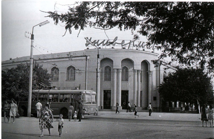
Центральный универмаг в Ашхабаде, в котором находился отдел по торговле за сертификаты «Внешпосылторга». 1960-е