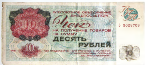
Сертификаты и чеки «Внешпосылторга»