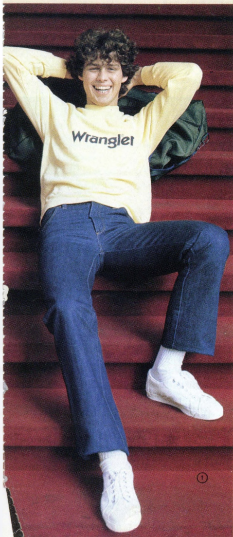
Страница из каталога товаров, продававшихся в «Березке» Каталог в/о «Внешпосылторг». Весна-лето 1982. М., 1982