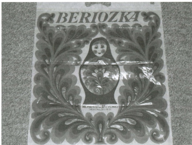
Полиэтиленовый пакет из «Березки». 1980-е.