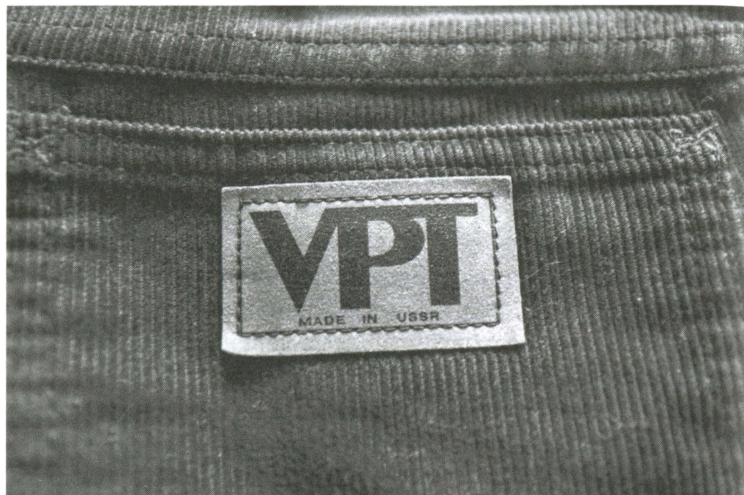
Брюки с лейблом VPT, специально произведенные для магазинов «Березка». 1980-е.

рынке (подробнее об этом см. главу 4). «По случаю удалось в магазинах отхватить что-нибудь приличное и модное. А вот чтобы купить первые джинсы Wrangler (американская марка. — А. И.), я накопила денег и купила чеки из «Березки». Пошла, оторвала там джинсы. Мы с мужем по очереди их носили. Смешно вспоминать» 92 .