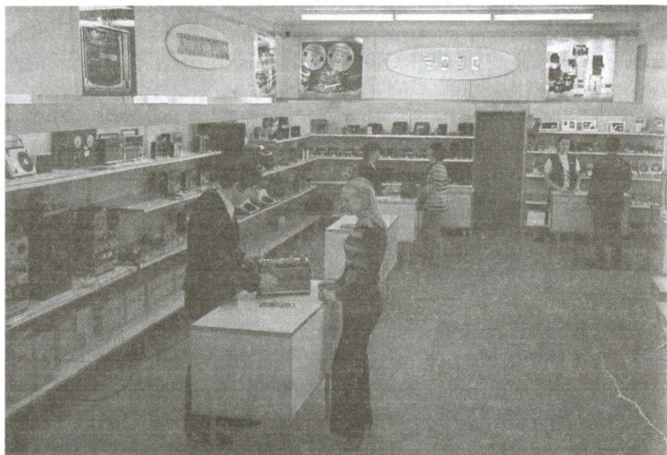
Отдел электроники магазина «Березка» в Москве Новости и информация. 1974. № 20. С. 2

другому “товарищу”, неважно на какую должность посланному за границу, хотелось, естественно, к концу трехлетнего срока накопить чеков “Внешпосылторга” на машину и чтоб еще осталось на одежду из “Березки”...» 15