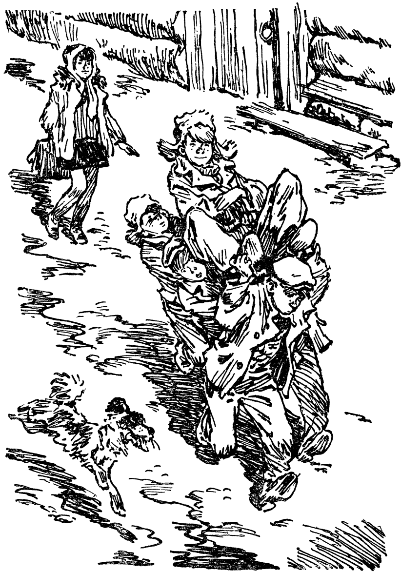
Мишку подобострастно подхватили на руки и понесли.