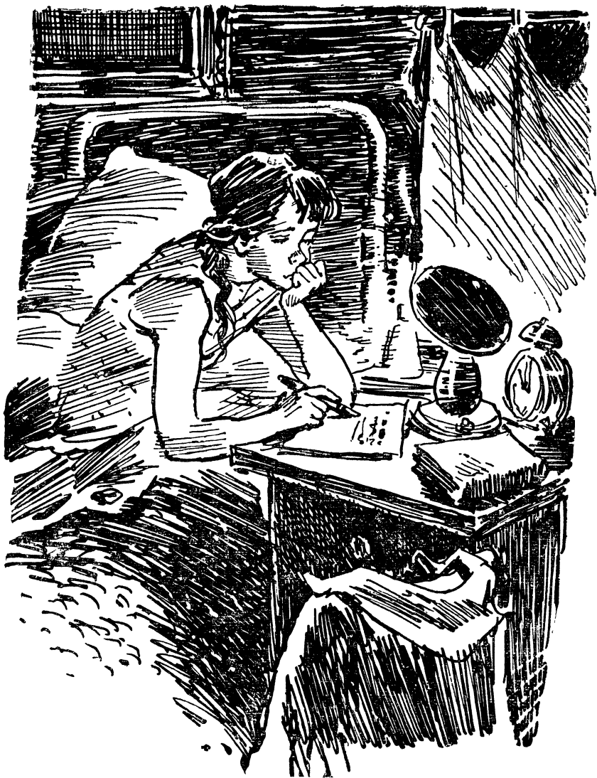
Тасяжка зажгла настольную лампу и села писать письмо.