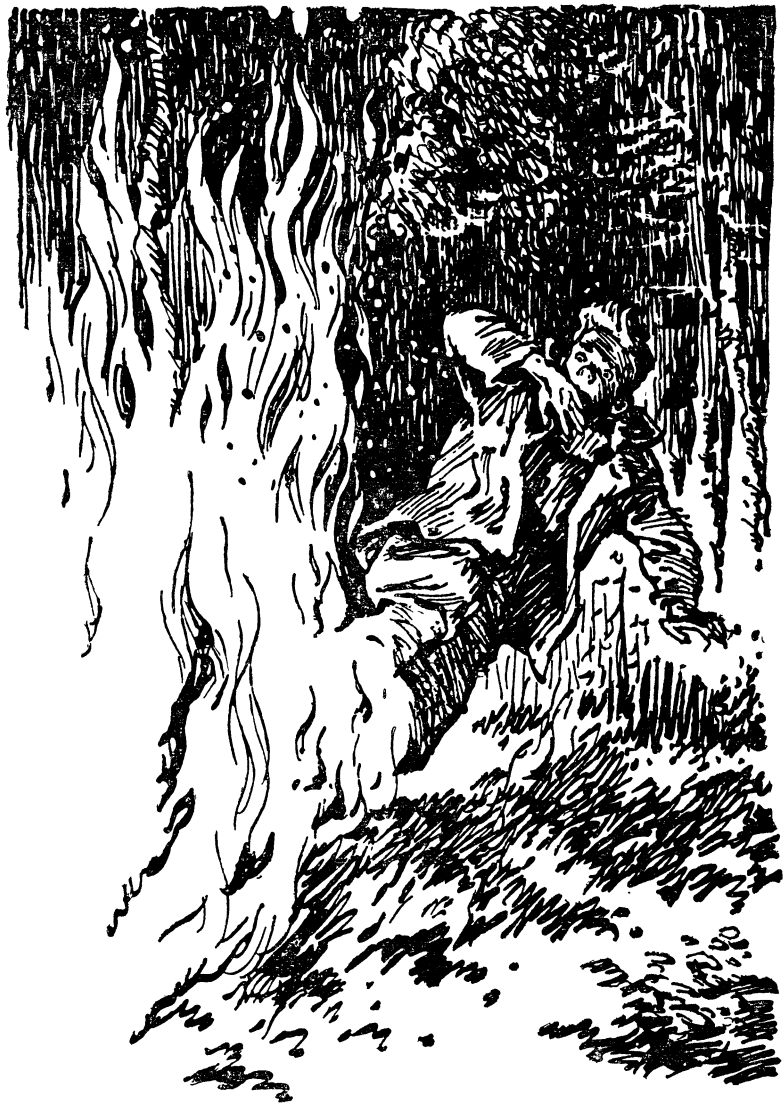
Гудящая стена огня настигла его на полпути...