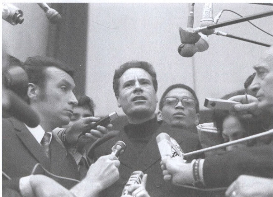
После встречи с президентом Франции Жоржем Помпиду. Париж. 1973