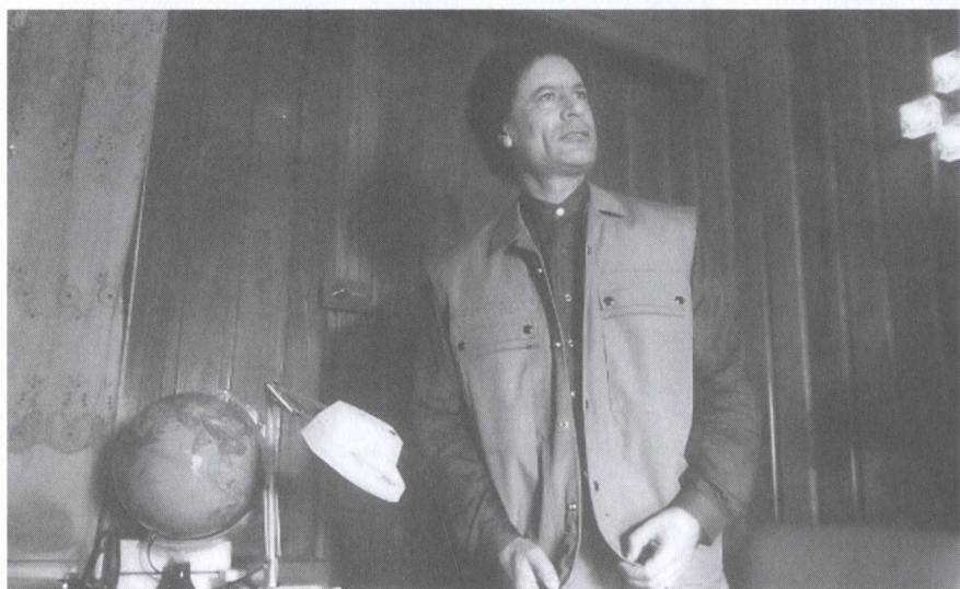
На встрече с журналистами. 1986