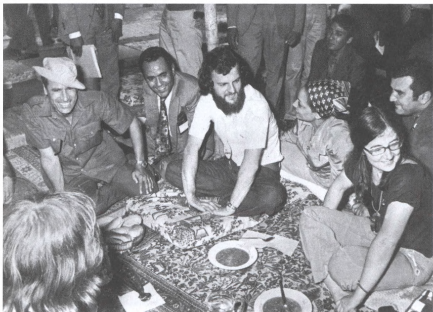
С британскими хиппи. Триполи, 1973