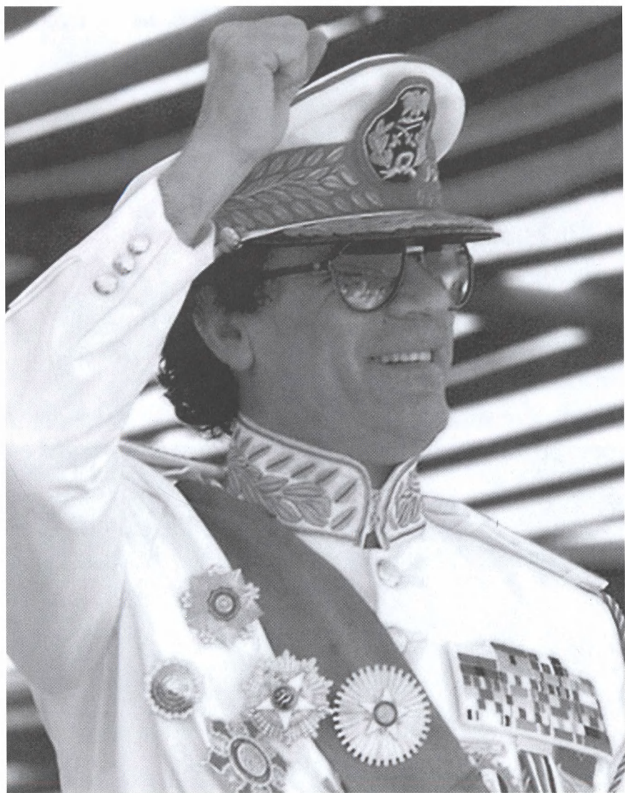
На военном параде в честь 30-летия ливийской революции. 1999