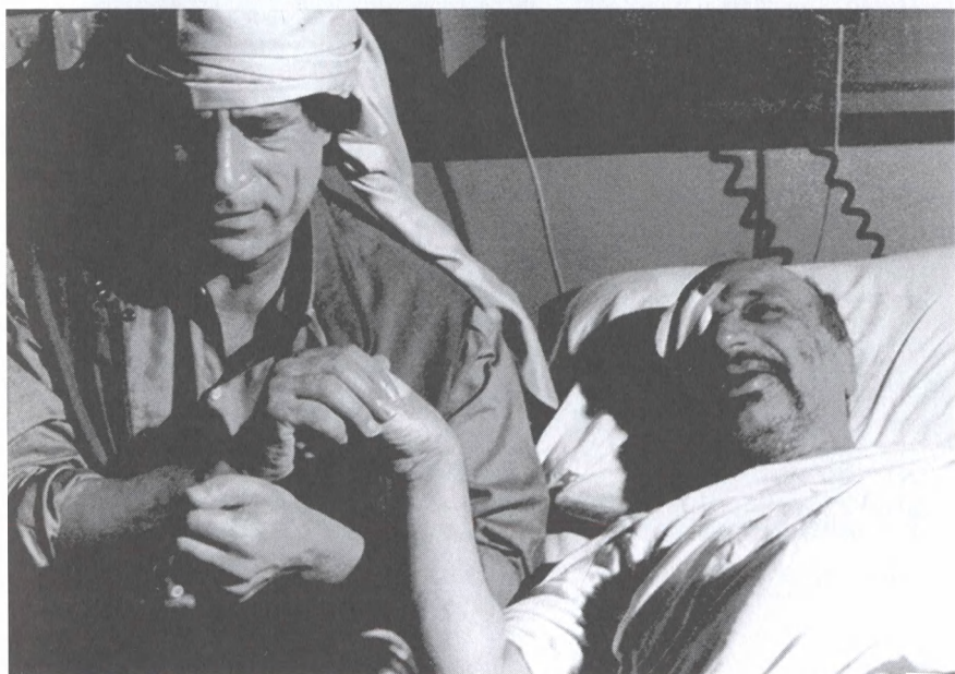
С Ясиром Арафатом в госпитале, где глава Палестинской автономии находился после авиакатастрофы. 1992