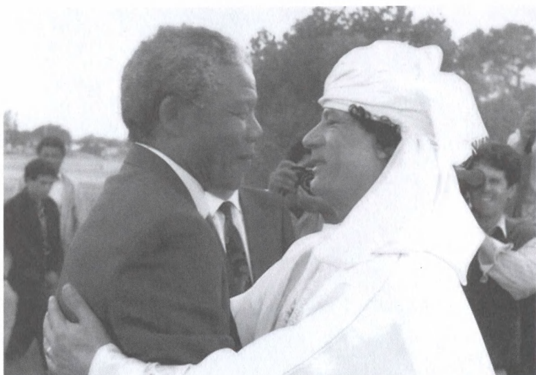
С президентом ЮАР Нельсоном Манделлой. Триполи, 1990