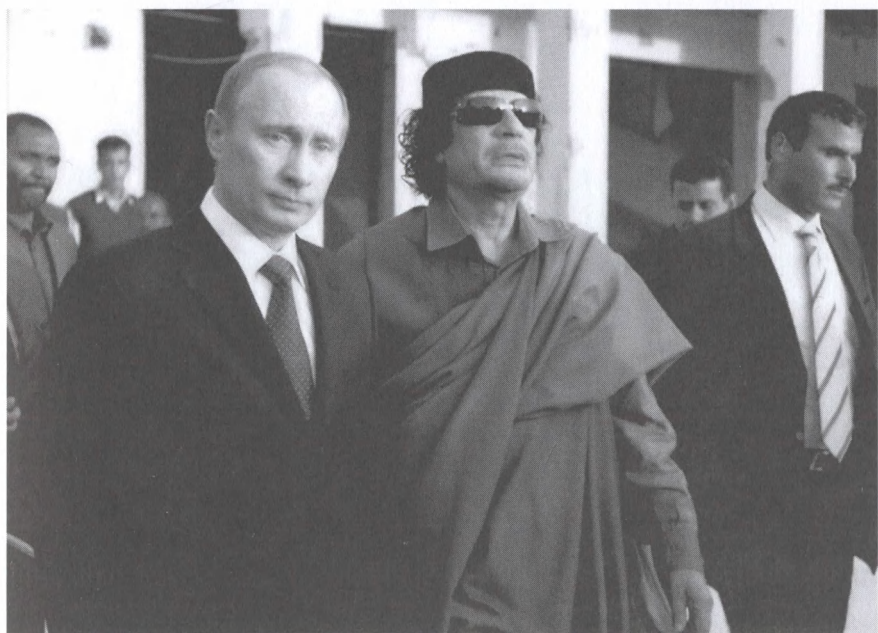
С президентом России Владимиром Путиным. 2008