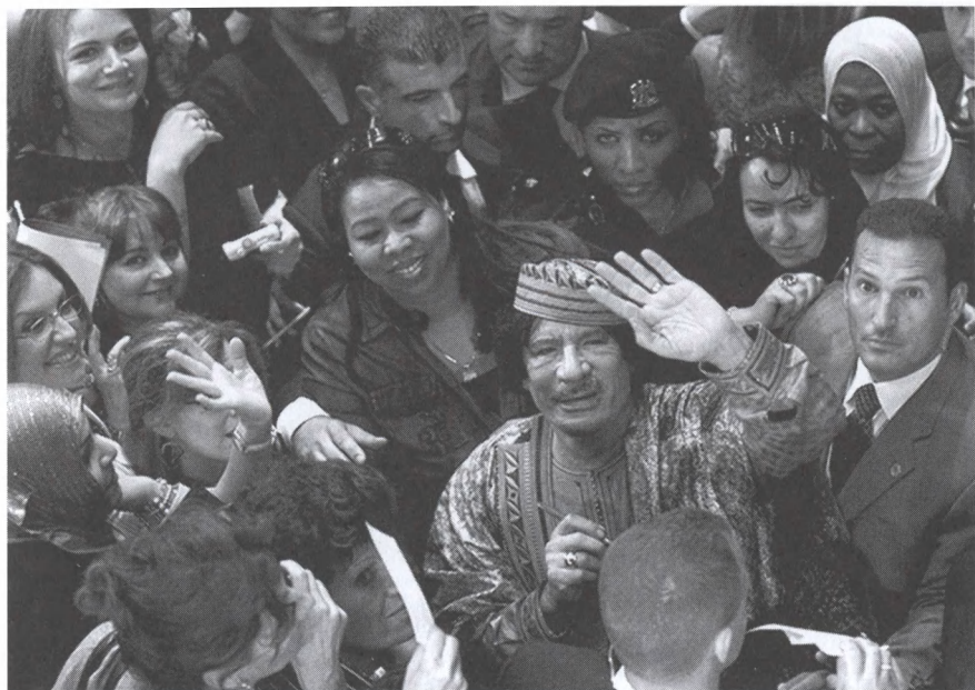
В Риме. Июнь 2009