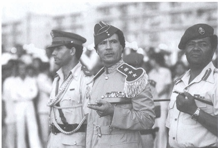
На открытии первой женской военной Академии. Триполи. 1981