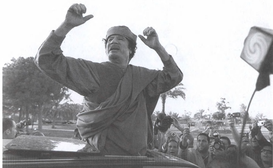
Перед своими сторонниками. Триполи. Апрель 2011.