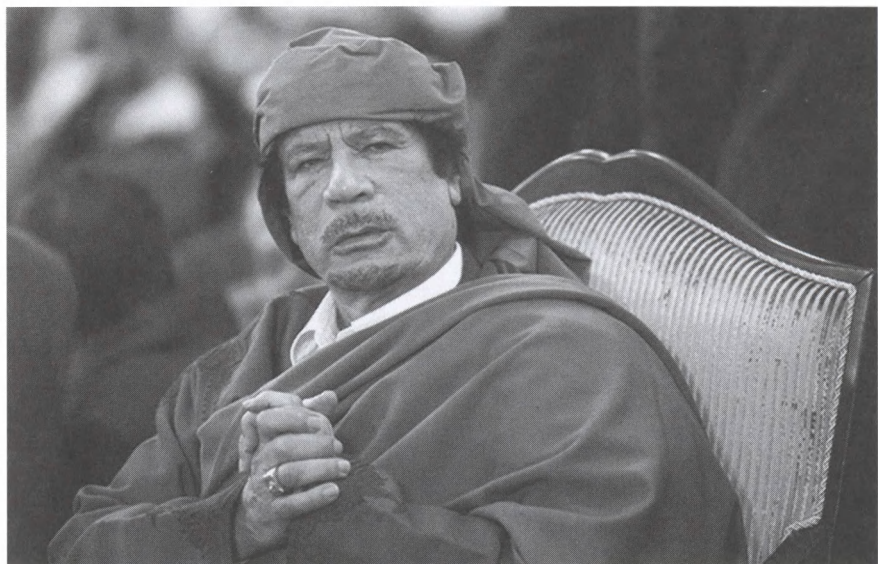
На праздновании дня рождения пророка Мухаммада. Триполи. Февраль 2011.