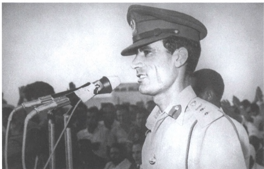
Каддафи выступает с речью после свержения короля Идриса. Триполи, 1969