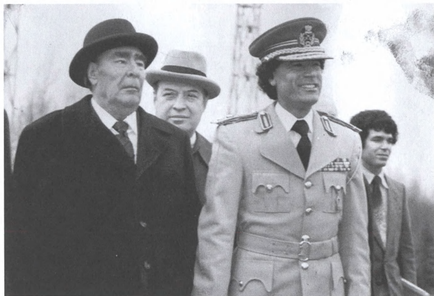
С Леонидом Брежневым