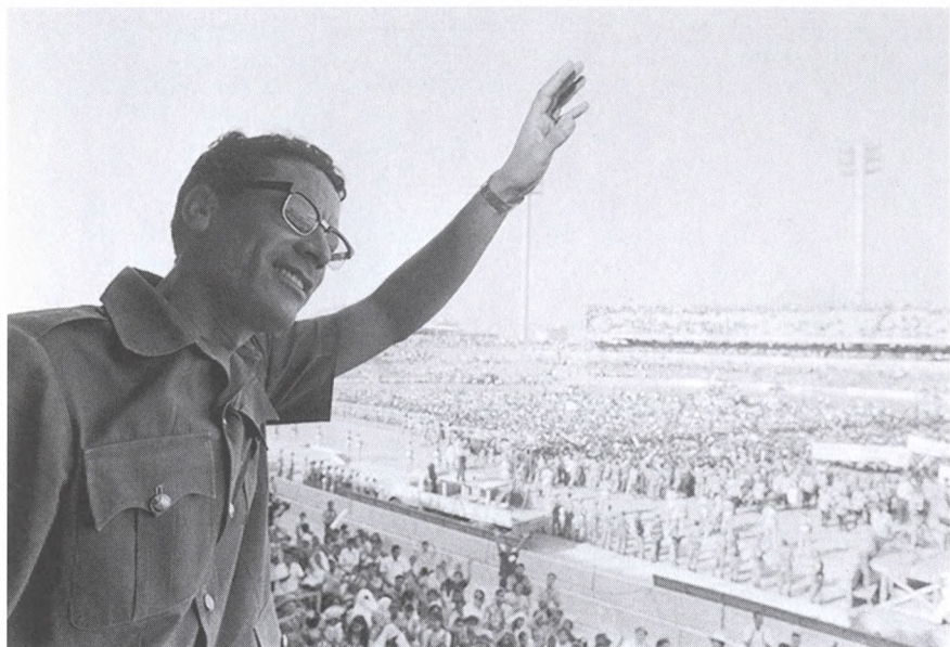
Демонстрация. Бенгази, 1971