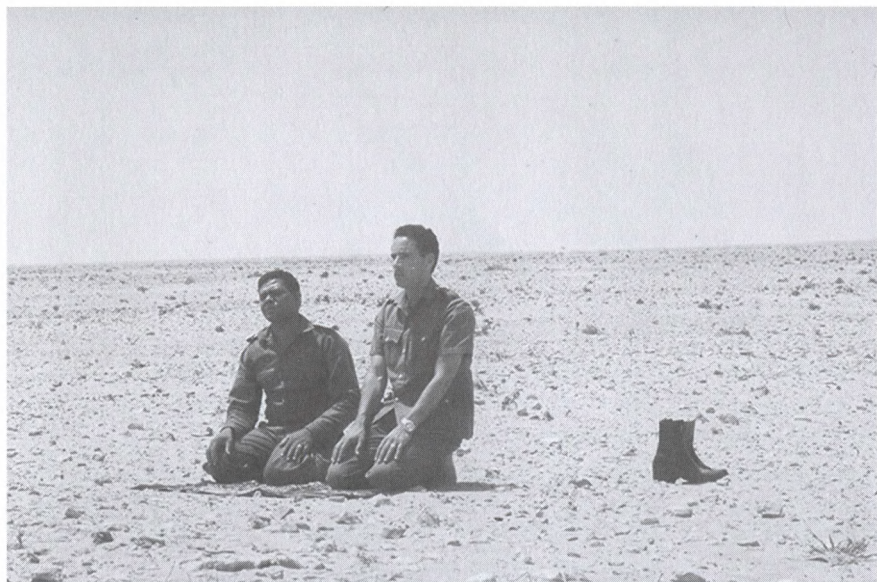
Во время молитвы в пустыне. Сирт, 1973