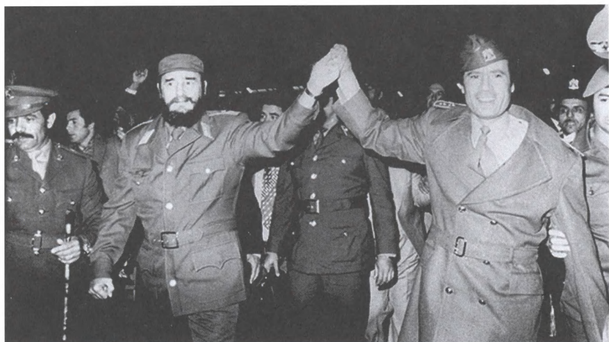
С Фиделем Кастро. 1977