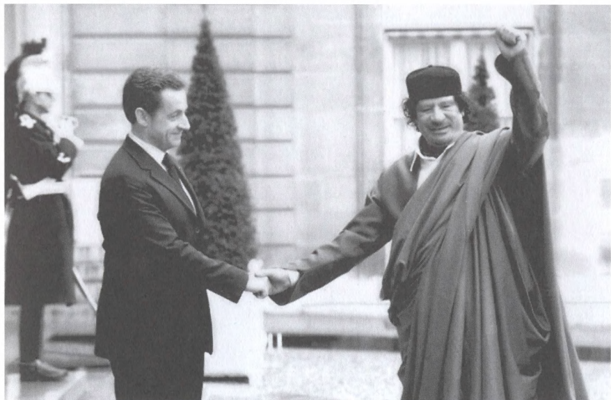
С президентом Франции Николя Саркози. Париж. 2007