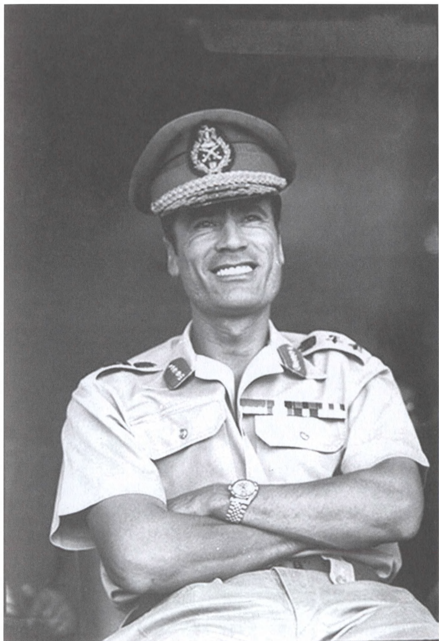
В начале политической карьеры. 1969