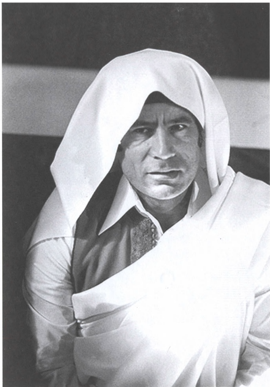
Муаммар Каддафи. 1978