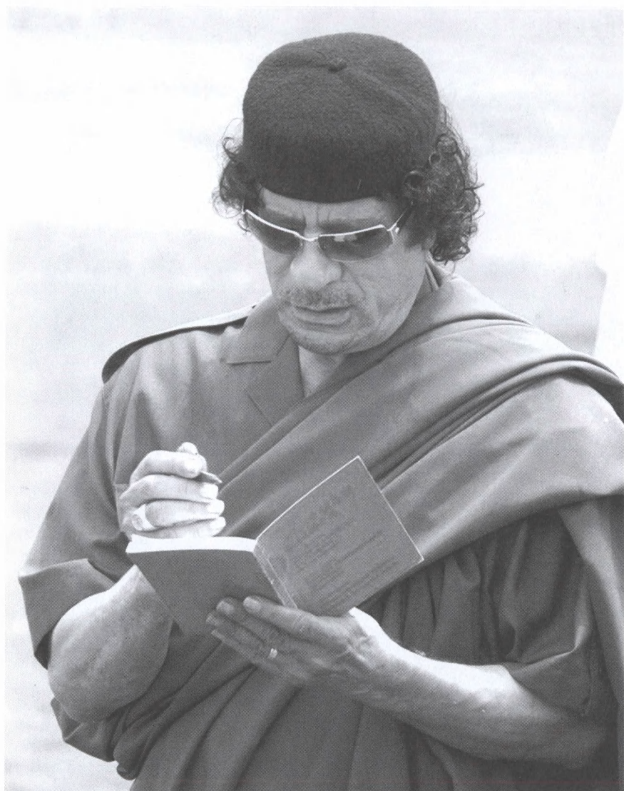
С русскоязычнм изданием «Зеленой Книги» в руках. 2002