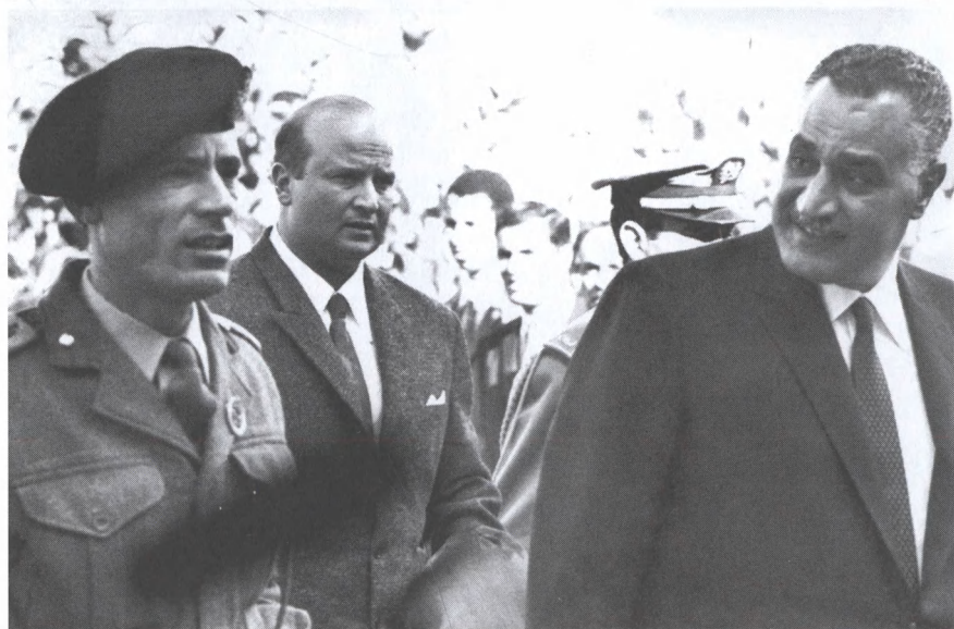
С президентом Египта Гамалем Насером на встрече Лиги арабских государств. 1969