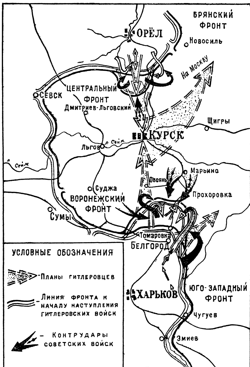
Схема 1. План немецко-фашистского командования на лето 1943 года и ход оборонительного сражения советских войск на Курском выступе (5 — 11 июля 1943 года).