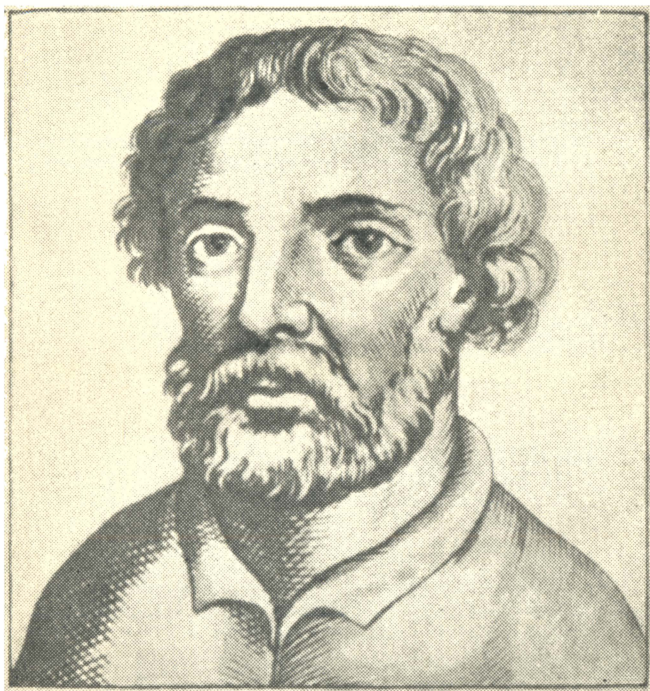
Степан Тимофеевич Разин. Деталь гравюры XVII в. (увеличено).