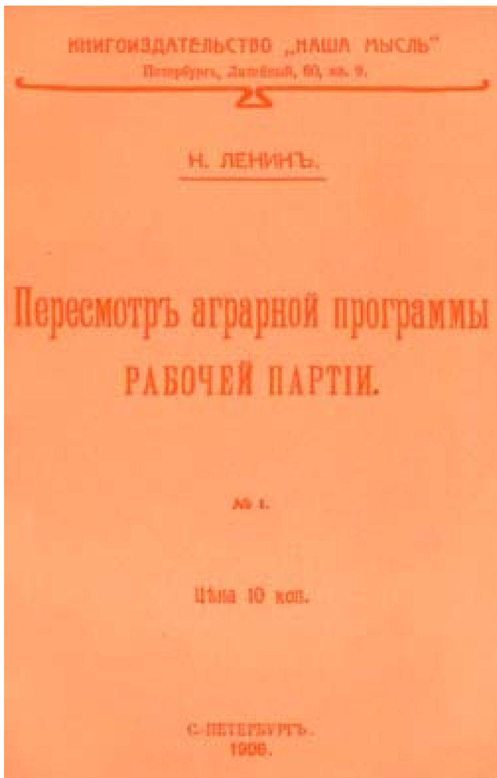
Обложка брошюры В. И. Ленина «Пересмотр аграрной программы рабочей партии». — 1906 г. Уменьшено