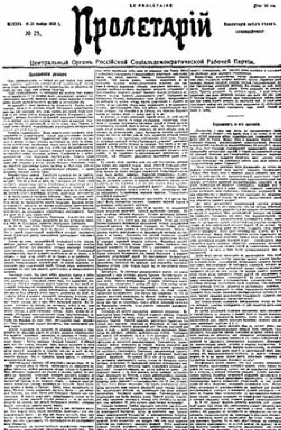
Первая страница большевистской газеты «Пролетарий» № 25, 16 (3) ноября 1905 г. с передовой статьей В. И. Ленина «Приближение развязки» Уменьшено