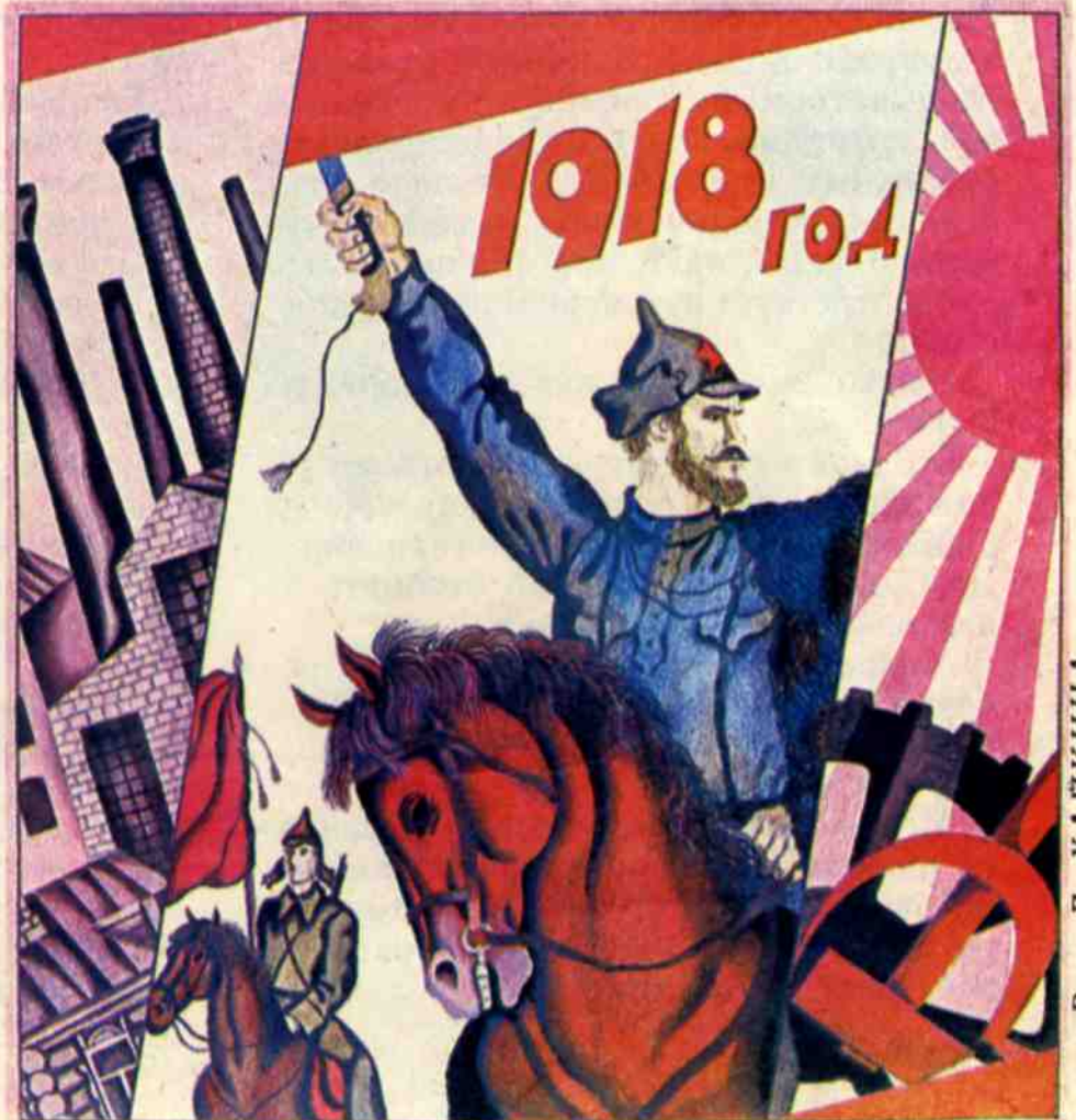
Рис. Д. ХАЙКИНА