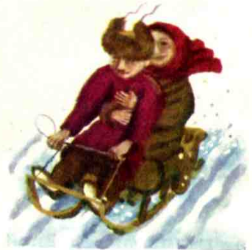
Рис. Н. ВОРОНКОВА