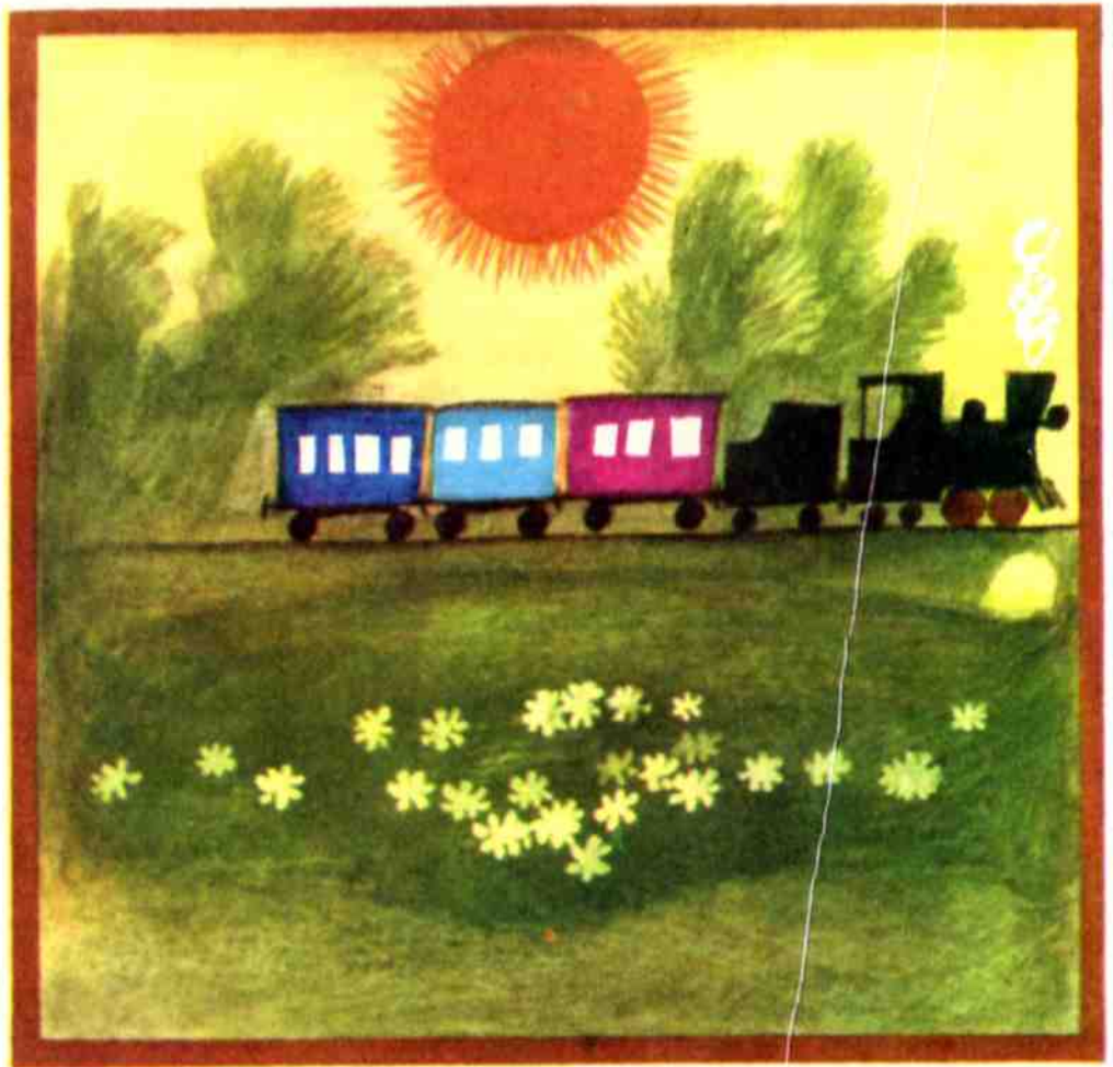
Рис. В. ЧАПЛИ

Красота! Красота! Мы везём с собой кота, Чижика, собаку, Петьку-забияку, Обезьяну, попугая — Вот компания какая!