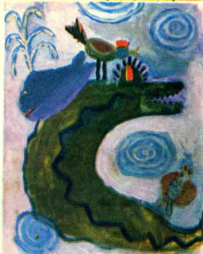
Рис. Тани ГОРДЕЕВОЙ, Томск