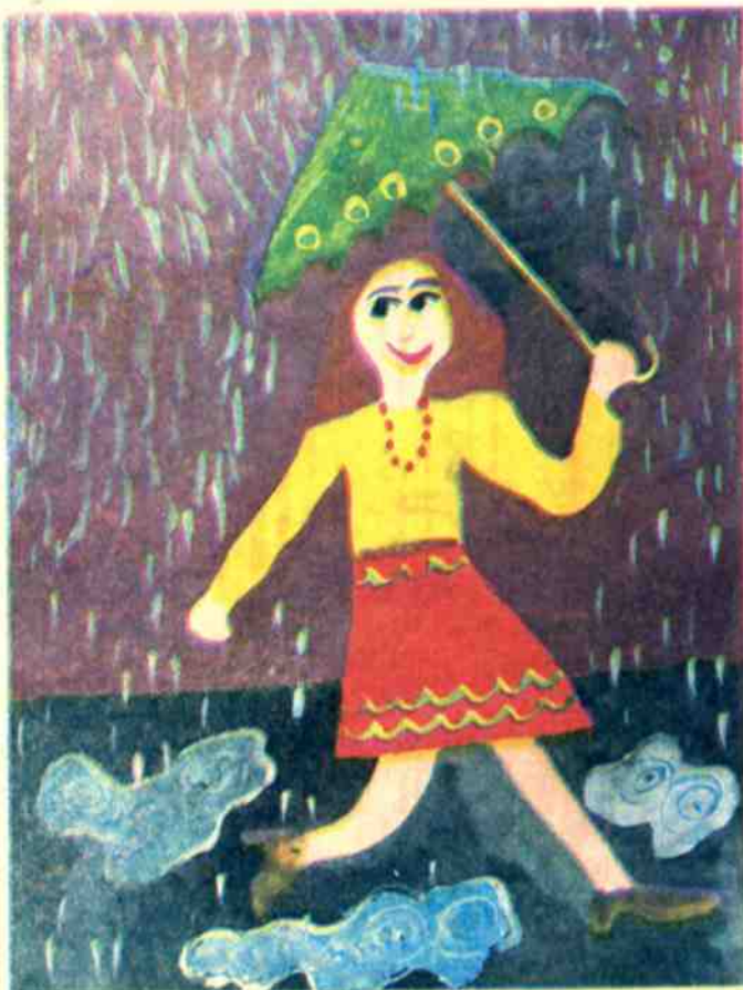
Рис. Романа ЗУБКА, Москва

Снаружи — слякоть, мокрота, На лужах — пузыри... Зато какая красота Под колокольчиком зонта У дождика внутри!