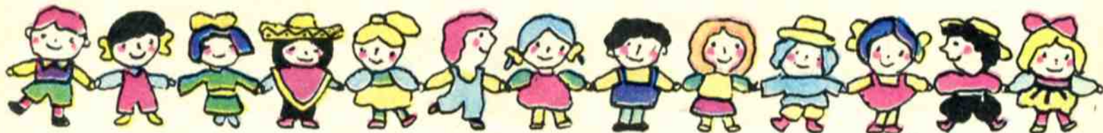
Рис. Н. УСТИНОВА

Солнышко засветит, облако проплывёт, ссоры как не бывало.