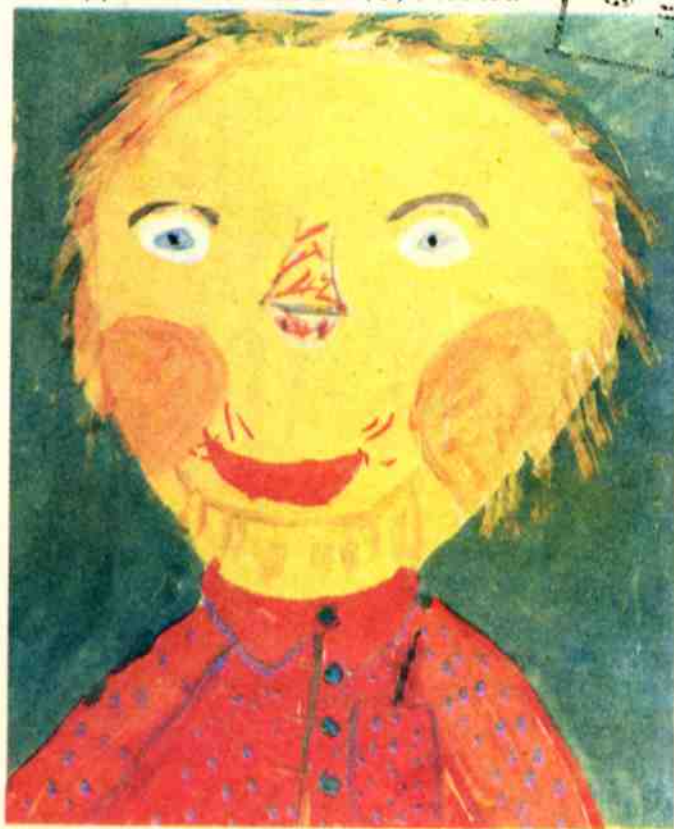
Рис. Дениса БОРИСЕНКО, Москва

Взмахну волшебной палочкой — И вот под птичий свист Лужайка вместе с бабочкой Вспорхнёт на белый лист. И всё вокруг зашепчется: «Волшебница... волшебница...»