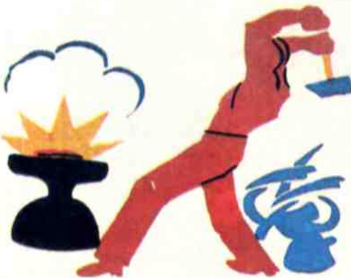
Окно Главлитпросвета, 1921 год, автор В. МАЯКОВСКИЙ.