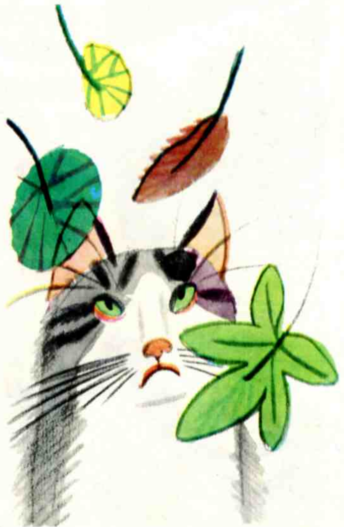
Рис. Г. МАКАВЕЕВОЙ