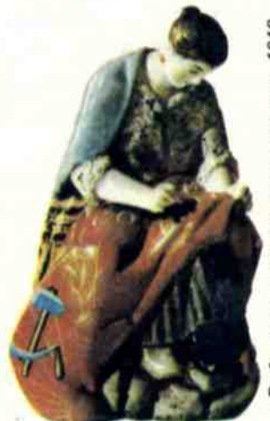
«Работница, вышивающая знамя», 1919 год, автор Н. ДАНЬКО.