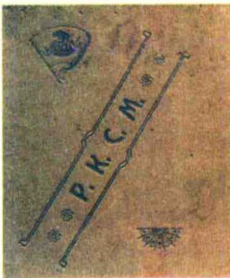
Комсомольский билет № 1.