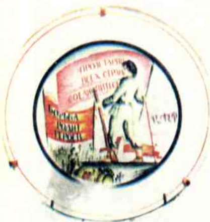
Тарелка с лозунгами, 1920 год, автор С. ЧЕХОНИН.