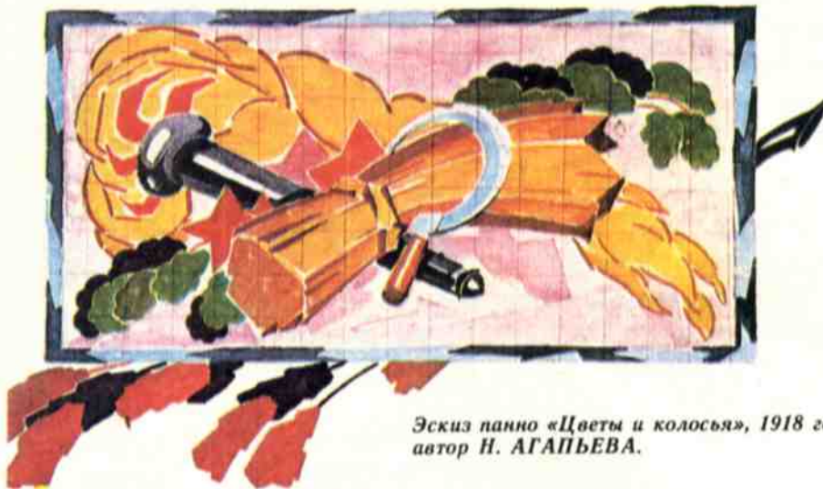
Эскиз панно «Цветы и колосья», 1918 год, автор Н. АГАПЬЕВА.

КОМСОМОЛ— ЗНАЧИТ КОММУНИСТИЧЕСКИЙ СОЮЗ МОЛОДЁЖИ. ВПЕРВЫЕ ЭТО СЛОВО ПРОЗВУЧАЛО 29 ОКТАБРЯ 1918 ГОДА. КОМСОМОЛУ—70! С ДНЁМ РОЖДЕНИЯ, ЛЮБИМЫЙ СТАРШИЙ БРАТ И ВОЖАТЫЙ! ПИОНЕРЫ И ОКТЯБРЯТА СТРАНЫ САЛЮТУЮТ ТЕБЕ!