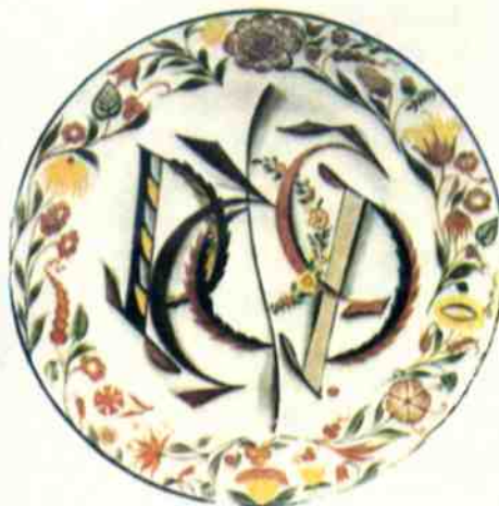
Тарелка «РСФСР», 1920 год, автор С. ЧЕХОНИН.