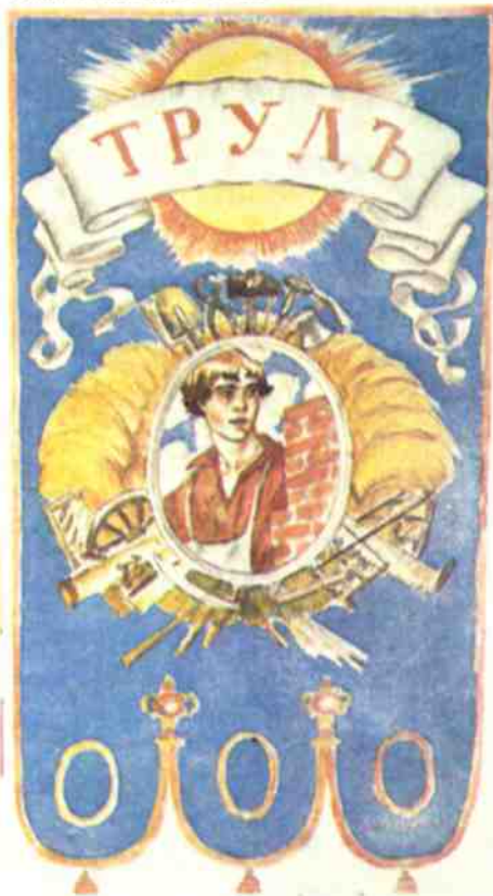
Эскиз панно «Труд», 1918 год, автор Б. КУСТОДИЕВ.