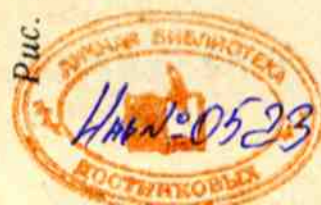
Рис. К. ОРЛОВА

Эдгем Рахимович ТЕНИШЕВ, член-корреспондент Академии наук СССР, председатель Совета по сохранению и развитию культур малочисленных народов