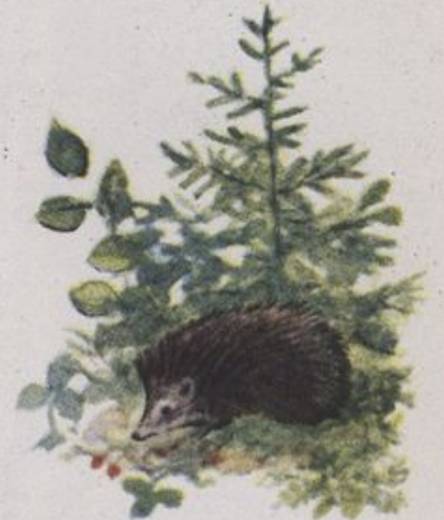
Рис. М. РОДИОНОВА

А семян мешок тяжёлый, Что в лесу набрал отряд, Мы пошлём в степную школу,— Пусть леса в степи шумят.