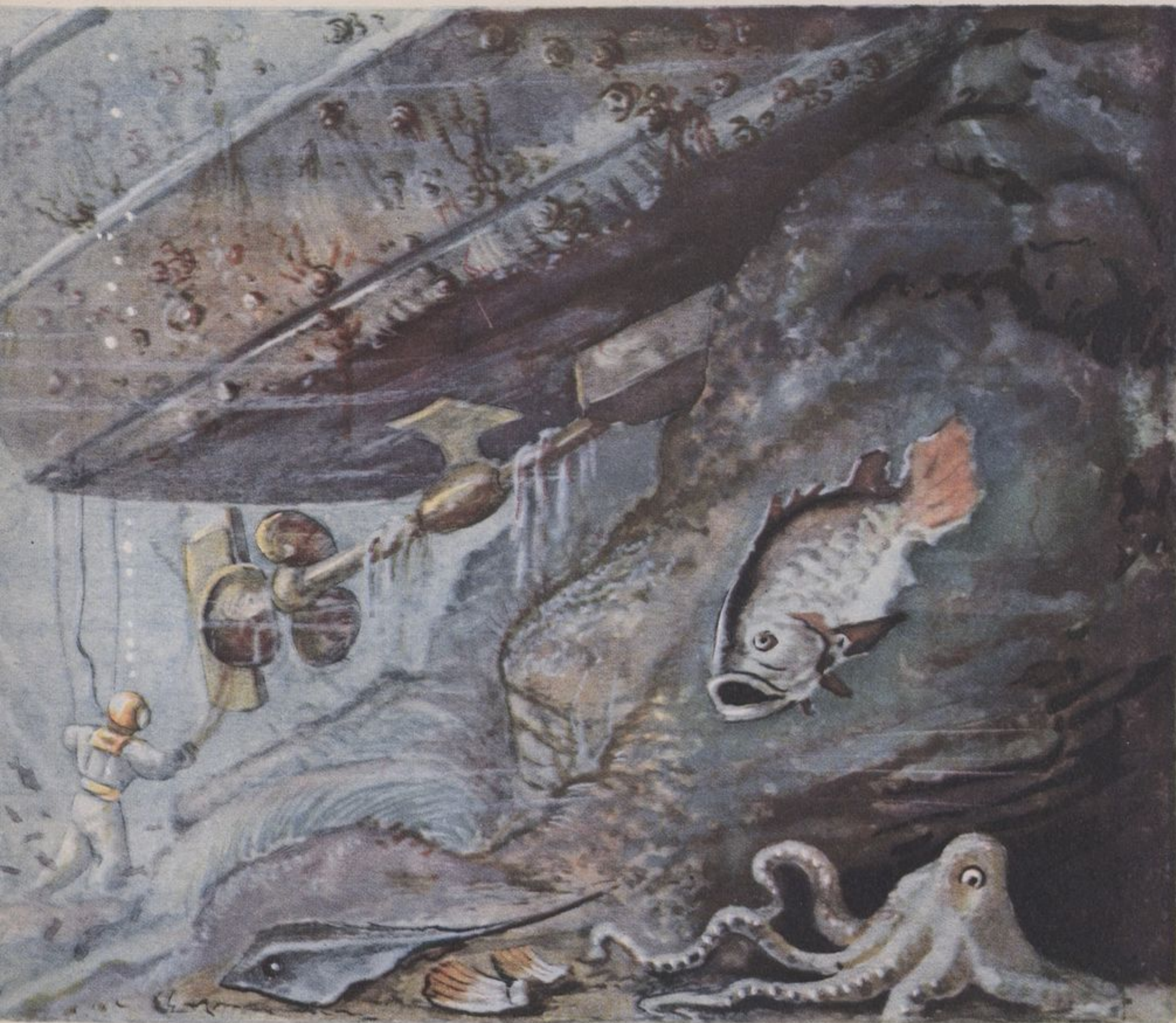
Рис. В. БИБИКОВА

время разговаривает с товарищами, рассказывает о том, что видит на морском дне.