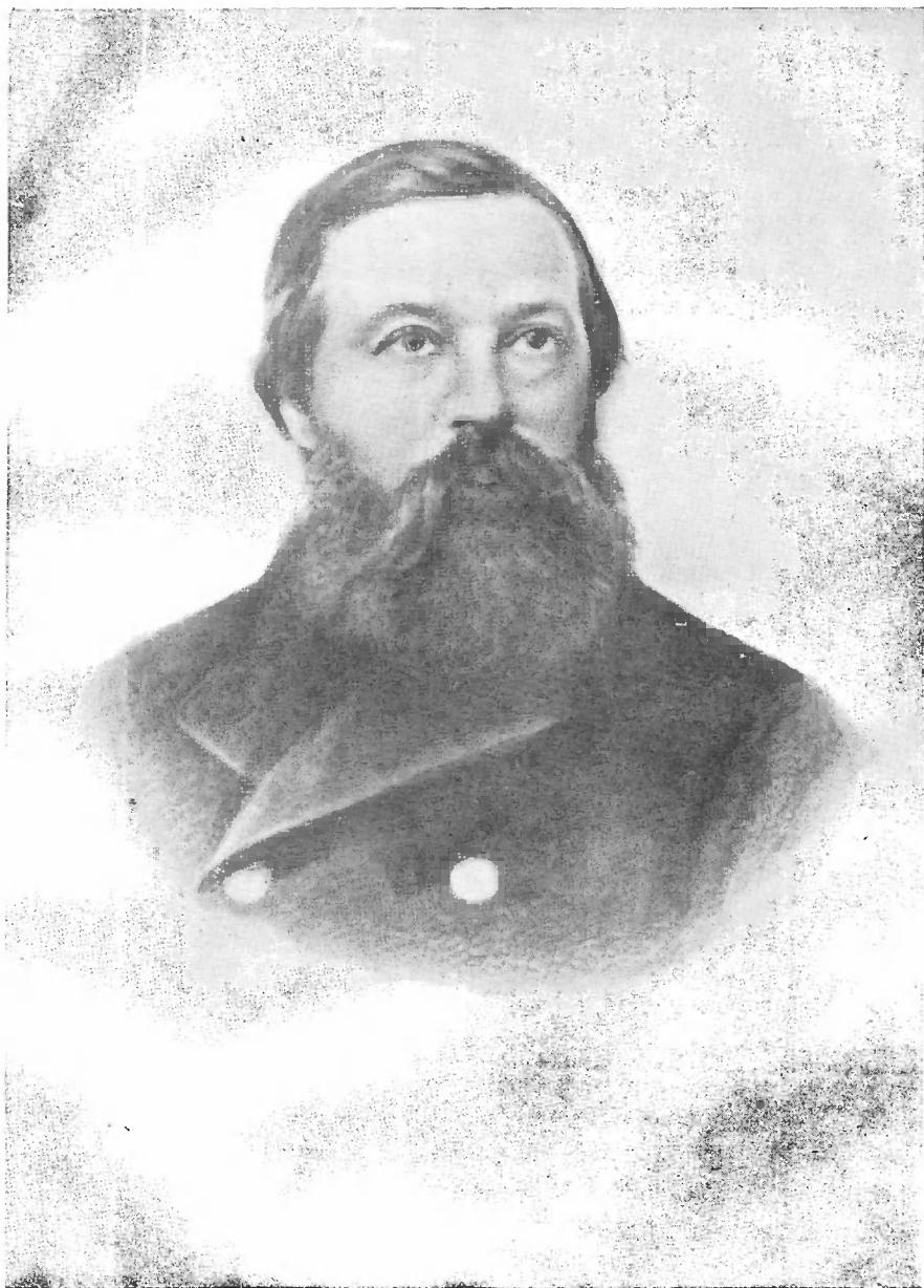
Фридрих Энгельс (1865 г.)