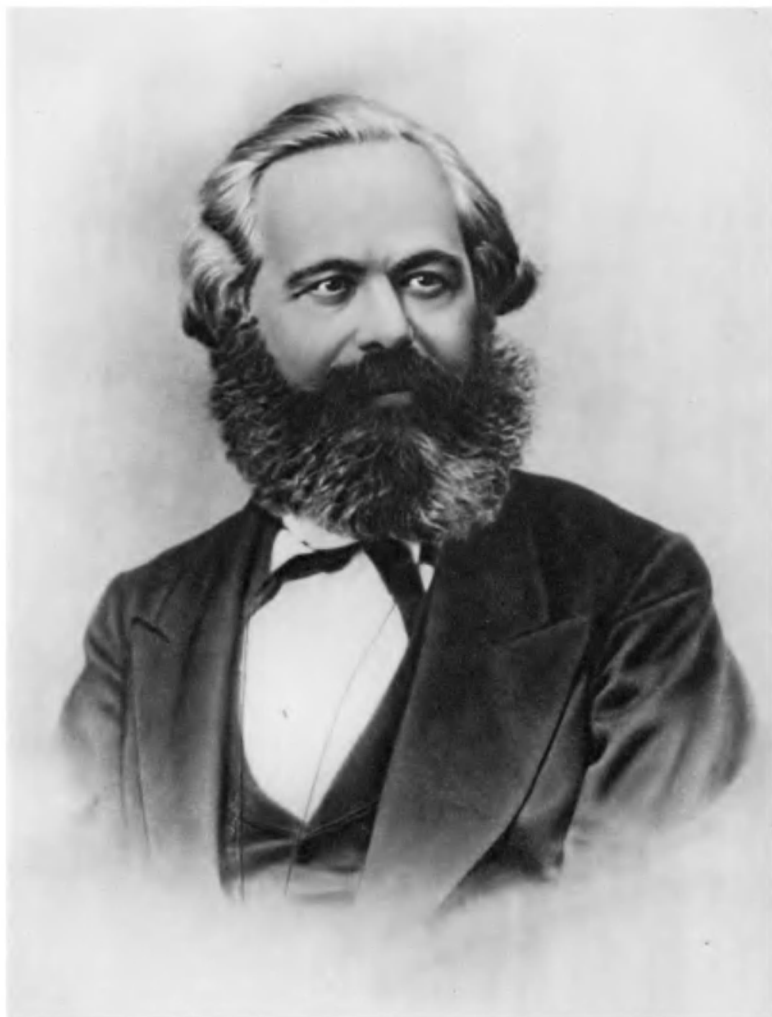
Карл Маркс. 1867 г.