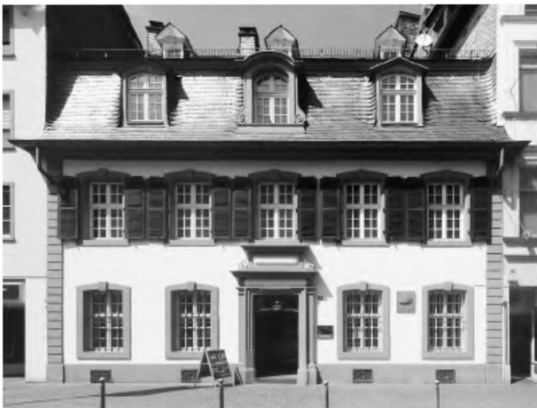
Дом в Трире, где родился Карл Маркс.

произойти в более прогрессивных условиях, в иной международной обстановке, чем буржуазные революции в Англии XVII в. и Франции XVIII в. В Западной Европе быстро рос капитализм, нарастающими темпами развивалось рабочее движение, пролетариат становился решающим фактором исторического развития. В самой Германии ремесло уступало место машинному производству, мелкие производители разорялись и попадали в кабалу к крупному капиталу, пролетаризировались. Росло и классовое самосознание рабочих, восстание силезских ткачей 1844 г. было грозным предзнаменованием для немецкой буржуазии. Идеи утопического социализма, занесенные кочующими ремесленниками, нашли широкий отклик в пролетарской и полупролетарской среде. Мирному утопизму великих мыслителей Оуэна, Сен-Симона, Фурье противостоит революционная страстность утопизма Вейтлинга. Центр революционного движения перемещался в Германию.