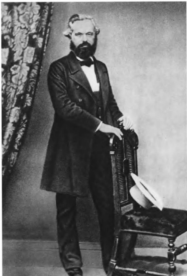
Карл Маркс. 1861г.