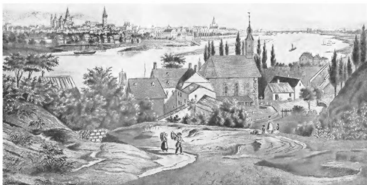
Город Трир в первой четверти XIX в.

на к Пруссии, она ощутительно почувствовала разницу между французским режимом, даже наполеоновского времени, и прусским феодально-абсолютистским режимом Фридриха Вильгельма III. Отсюда рост либерально-оппозиционных настроений рейнской буржуазии, её ведущее место в Пруссии. Революция 1830 г. во Франции усилила эти оппозиционные настроения и брожение в стране, направленное против отживших феодально-абсолютистских отношений под знаком национального единства Германии.