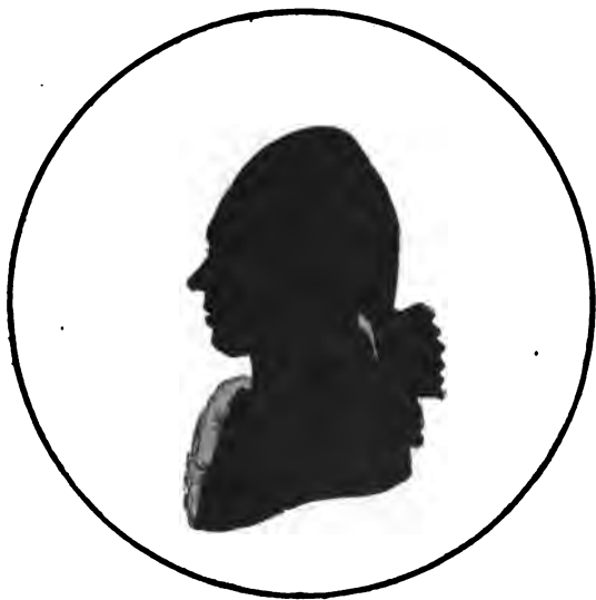
Петръ Симоновичъ Палласъ.