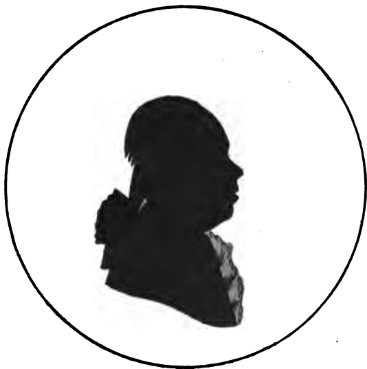
Симеонъ Кирилловичъ Котельниковъ.