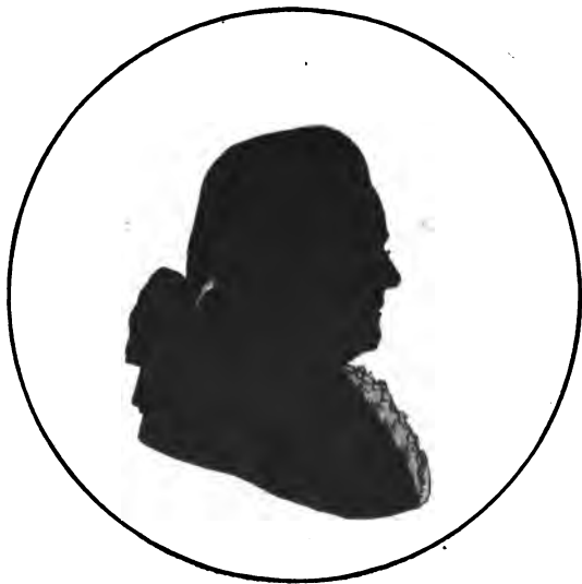
Яковъ Яковлевичъ Штелинъ.