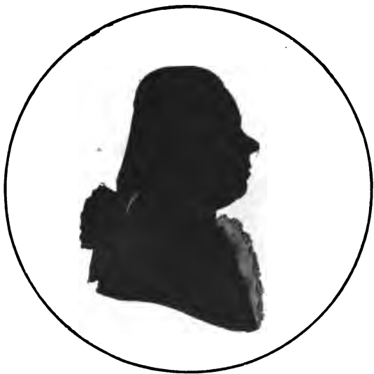
Степанъ Яковлевичъ Румовскій.