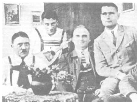
Гитлер (слева) и Гесс (справа)