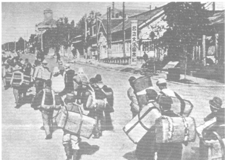
Японцы покидают занятый советскими войсками г. Отомари (г. Корсаков) на Южном Сахалине