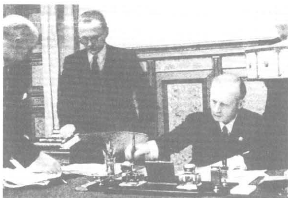
Риббентроп подписывает советско-германский договор о дружбе и границе