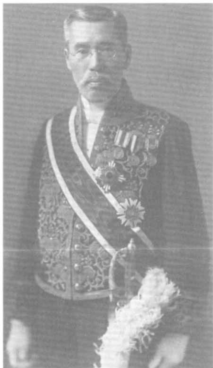
Барон Хиранума Киитиро — премьер, не спешивший «укреплять» Антикоминтерновский пакт