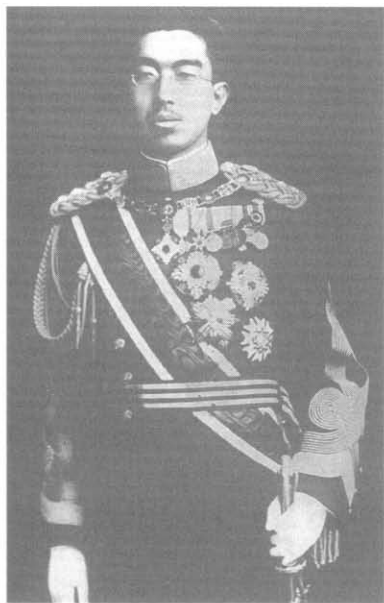
Император Сёва (Хирохито) в военной форме — монарх-долгожитель (на троне с 1926 по 1989 г.)