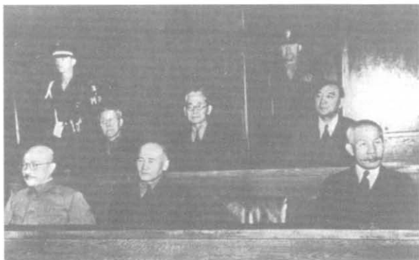
Лидеры поверженной Японии на скамье подсудимых. Нюрнберг, 1946 г.