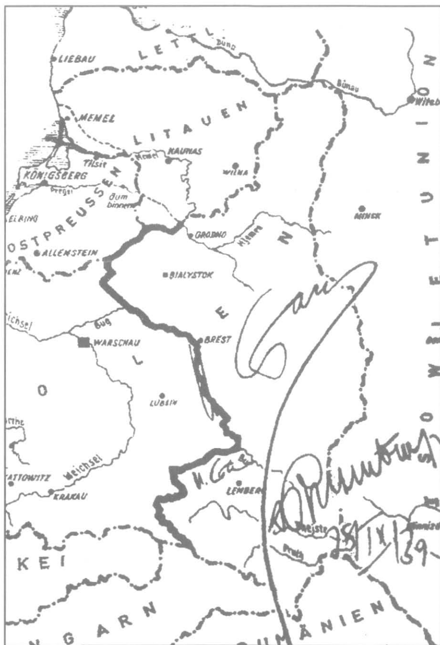
Подписанная Сталиным и Риббентропом карта с обозначением советско-германской границы