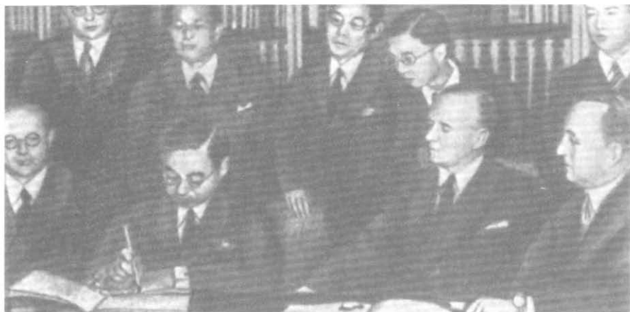
Подписание Антикоминтерновского пакта японской стороной