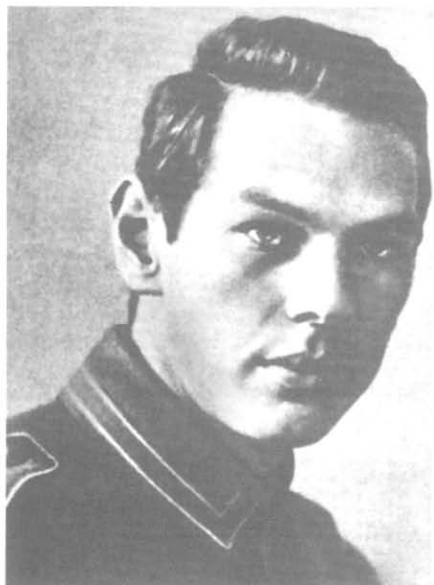
Зорге в немецкой форме в годы Первой мировой войны