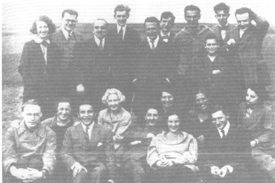
Р. Зорге (стоит третий справа) среди работников Коминтерна