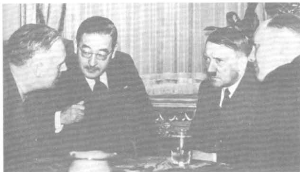
Риббентроп, Курушу и Гитлер

Слева направо: премьер-министр принц Коноэ, министр и иностранных дел Мацуока, морской министр вице- адмирал Йошида, военный министр генерал-лейтенант Тодзио. 6 августа 1940 г.