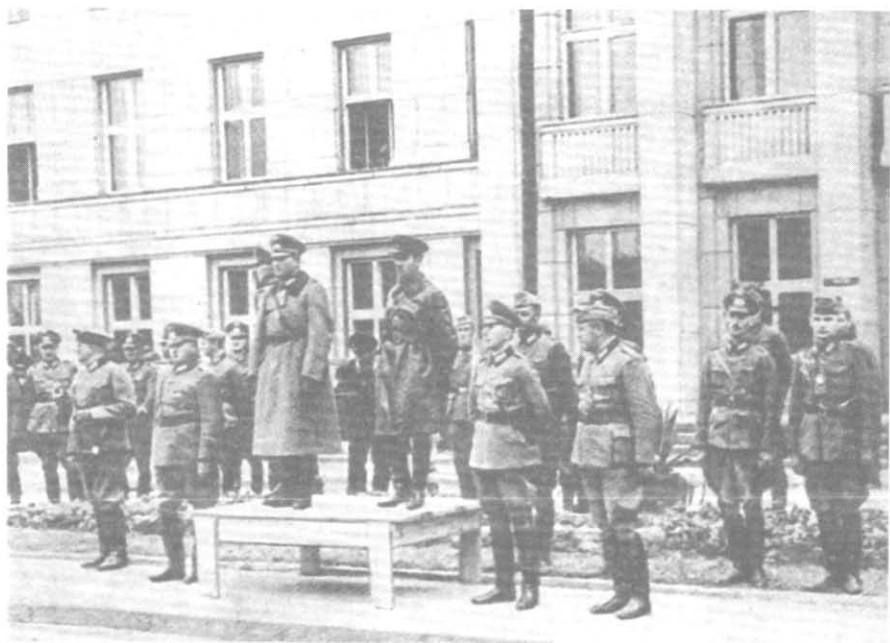
22 сентября 1939 г. Генерал Гудериан и комбриг Кривошеин принимают совместный парад при передаче вермахтом Бреста частям Красной Армии