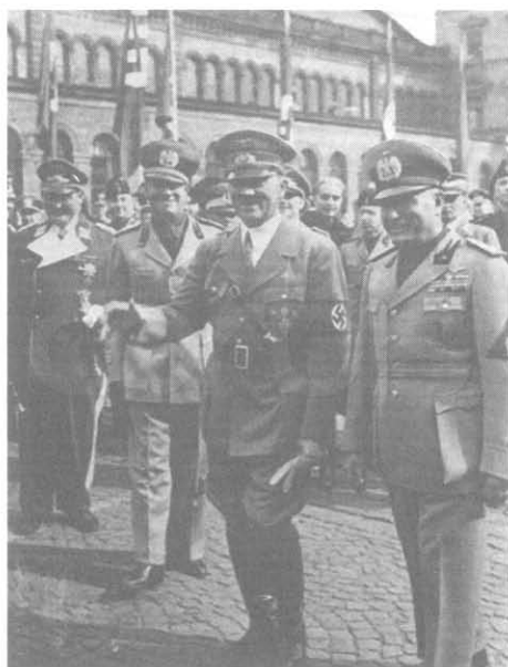
Муссолини (справа) — обреченный быть младшим партнером Гитлера