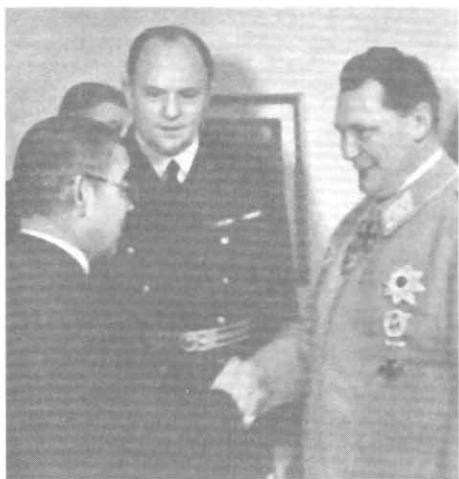
Рукопожатие Мацуока — Геринг. Берлин, март 1941 г.