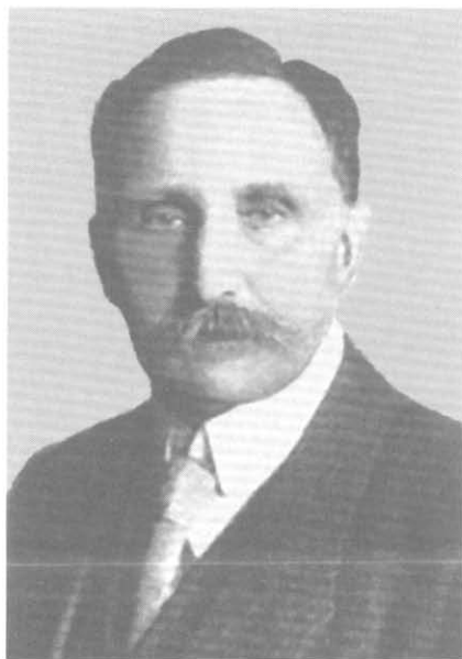
Карл Хаусхофер — отец евразийской геополитики