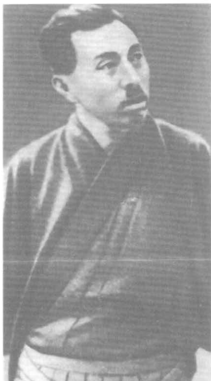
Принц Коноэ Фумимаро — лидер евразийцев в Токио