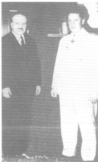
Молотов и Геринг в Берлине. 13 ноября 1940 г.