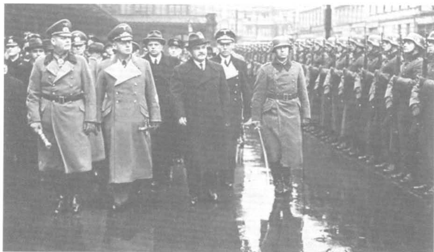
Фельдмаршал Кейтель, Риббентроп провожают Молотова (слева направо) на вокзале Анхальтер в Берлине