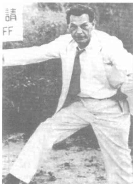
Рихард Зорге — воин Евразии