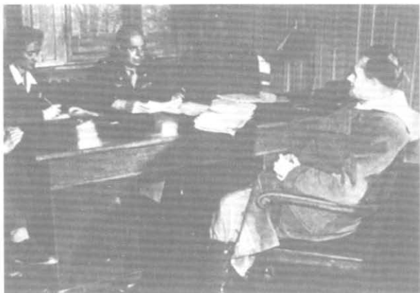
Допрос Гесса в Нюрнберге. 1946 г.