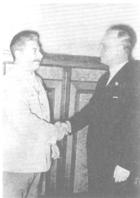
Сталин и Риббентроп после подписания пакта о ненападении