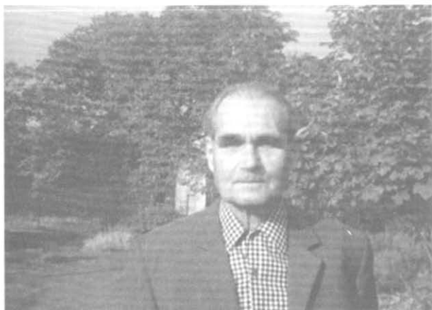
Один из последних снимков Рудольфа Гесса в западно- берлинской тюрьме Шпандау, 1974 г.