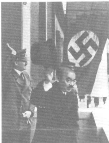
Мацуока и Гитлер на балконе рейхсканцелярии. Март 1941 г.