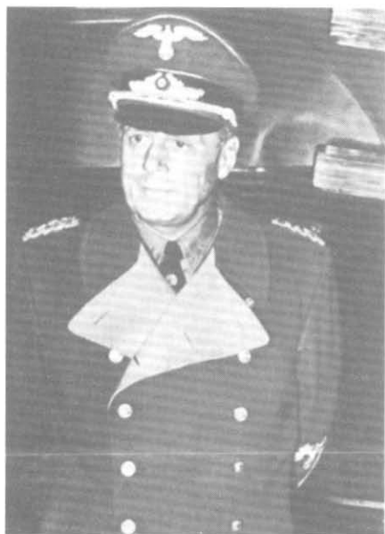
Иоахим фон Риббентроп — романтик «континентального» блока