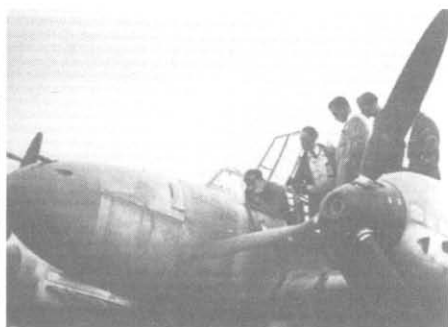
Гесс и истребитель «Мессершмит-110», на котором он совершил перелет в Англию