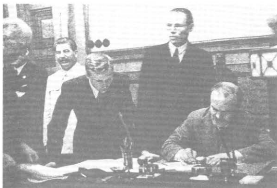
Москва, Кремль, утро 29 сентября 1939 г. В.М. Молотов подписывает советско- германский договор о дружбе и границе