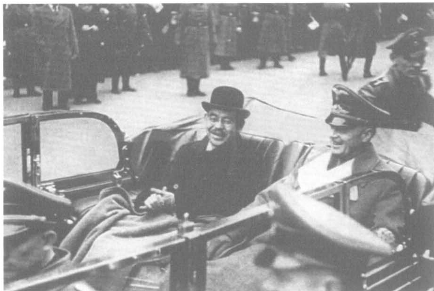
Мацуока и Риббентроп во время визита в Берлин в 1941 г.