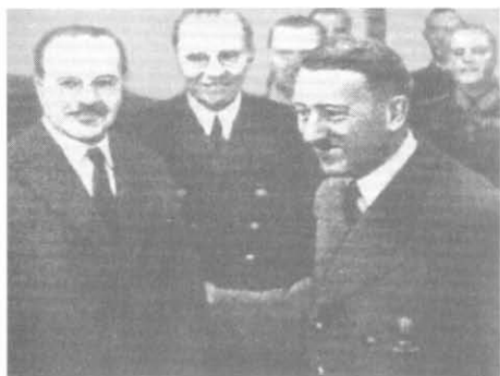
Молотов и Гитлер в Берлине

20 сентября 1939 г. Германские солдаты угощают красноармейцев сигаретами во время встречи на линии раздела Польши