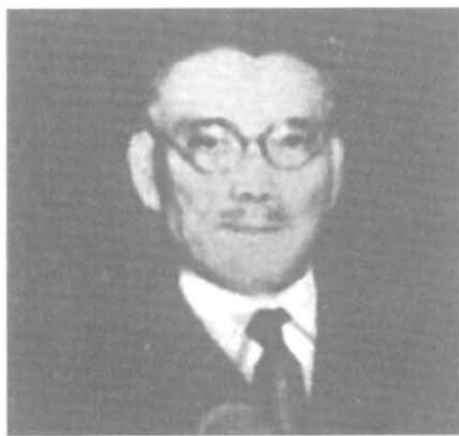
Сиратори Тосио — японский соавтор идеи континентальной оси