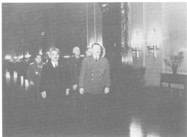
Гитлер и Мацуока возглавляют процессию