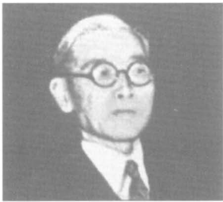
Посол (позднее министр) Того Сигэнори стремился к нормализации советско-японских отношений