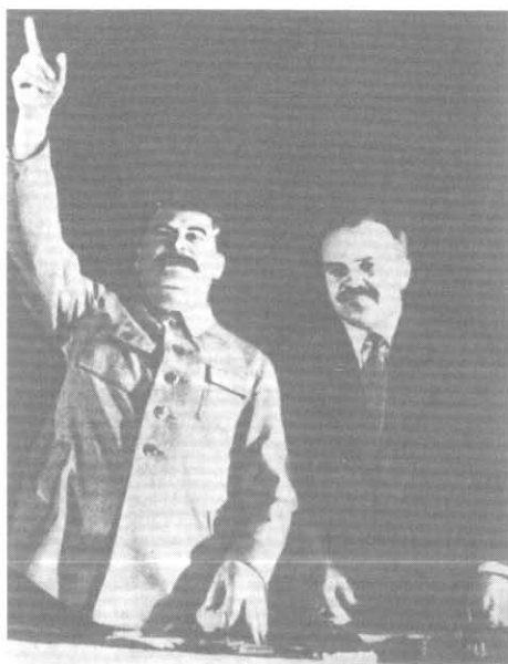
Сталин и Молотов