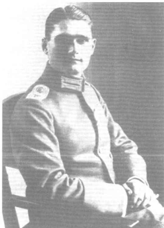
Рудольф Гесс. 1940 г.