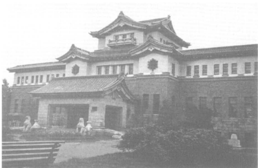
Южносахалинский областной музей (бывший японский Музей Карафуто)