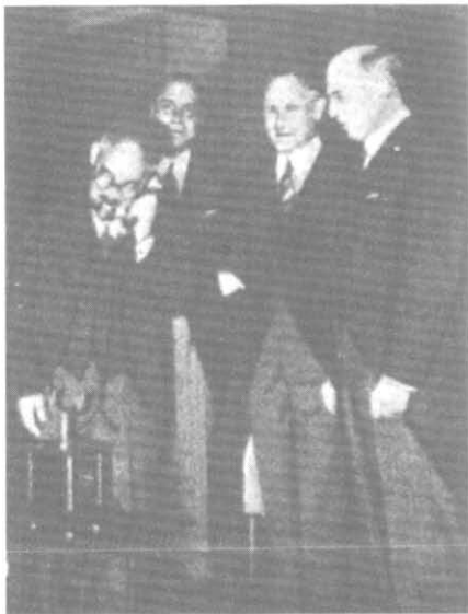
Мацуока беседует по телефону с Риббентропом в день подписания Тройственного пакта