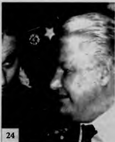
А так выглядел действительно Ельцин (см. фото 24).