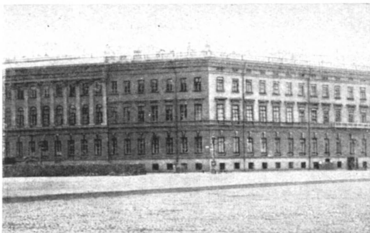
Здание бывшего Российского Министерства иностранных дел

риканскому послу, собравшемуся по обыкновению к часу дня в МИД, вдруг неожиданно сообщили, что министр занят «неотложными делами». Настоять на необходимости немедленной встречи с Терещенко Фрэнсису так и не удалось. А после того как к Фрэнсису явился крайне встревоженный Ш. Уайтхауз, один из секретарей посольства, и подробно рассказал о состоявшейся у него утром беседе с Керенским и об отъезде последнего из столицы, почти полностью вышедшей из-под контроля фактически уже изолированного и устраненного от власти Временного правительства, американскому послу стал ясен подлинный смысл всего происшедшего.