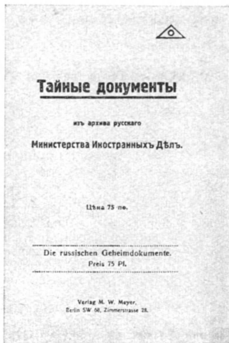
Титульный лист сборника тайных документов, изданного в Берлине

стро реализовать еще один пункт прежней программы, продемонстрировав снова верность своим обещаниям.