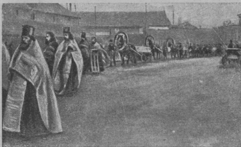
Лихоронная процессія на улицахъ Портъ-Артура.