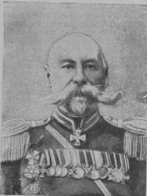
Командующій восточно-сибирской стъ вѣковой дивизіей, генералъ-маіоръ

По совѣту особаго „arbitrer elegan- tiumъ“,—какіе имѣются у многихъ аме-