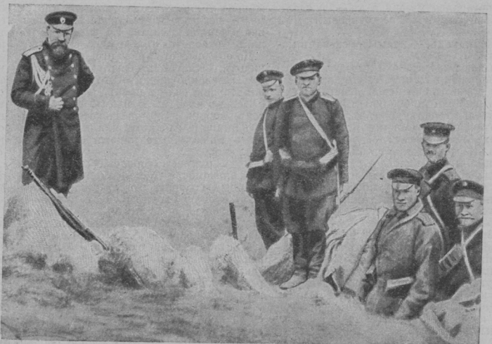
Въ Портъ-Артуръ въ дни осады.—Генералъ Кондратенко руководить минными работами на укрѣпленіяхъ Водчъ ей горы.

ранний въ гою у Шахъ и продолжавшій командо- вать своей частью, лежа на носилкахъ.