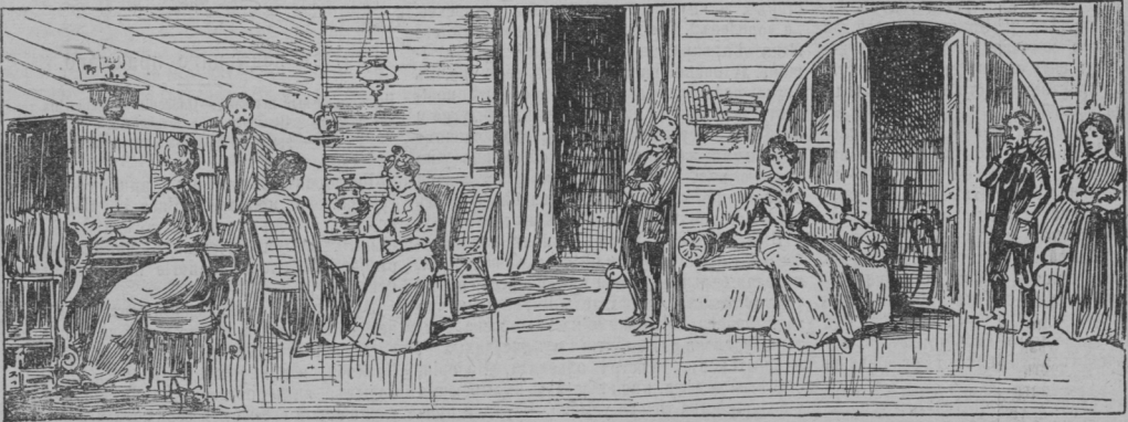
Дѣйствіе 1-е. Декламация стихотворенія Калеріей въ домъ Басова.