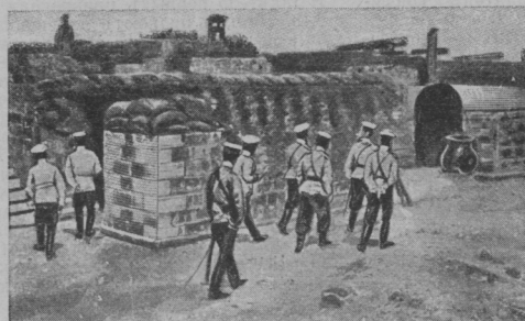
Генераль Стессель со своимъ штабомъ осматриваетъ форты. Въ Портъ-Артуръ въ дни осады.