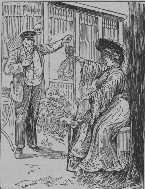
Дѣйствіе 2-е. Суловъ и жена его. — Сцена ревности.