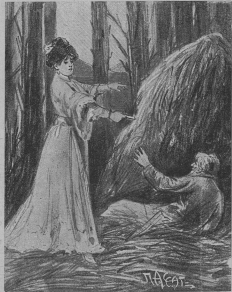
Дѣйствіе 3-е. Сцена Суслова съ его женой на дачномъ пикникѣ.