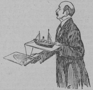
Допрось свидѣтелей по дѣлу оь инцидента въ Северномъ морь въ комисіи гуальской торговой палаты.

Русскій консулъ г. Гердъ (5) ставитъ вопросъ: вѣдѣли ли гуальскіе рыбаки среди русской эскадры суда другой національности. Мистръ Таксонъ представитель компании рыболовныхъ судовъ (6), иллюстрируетъ моделими положеніе рыболовныхъ сетей и судовъ во время инцидента. Затѣмъ дають показанія г. Михальсонъ, рыбакъ (1), капитанъ судна Сендженъ (2), капи- танъ парохода „Грауль“ Отаръ (3) и вызванный для допрось русскимъ консуломъ Водгуазъ (4).