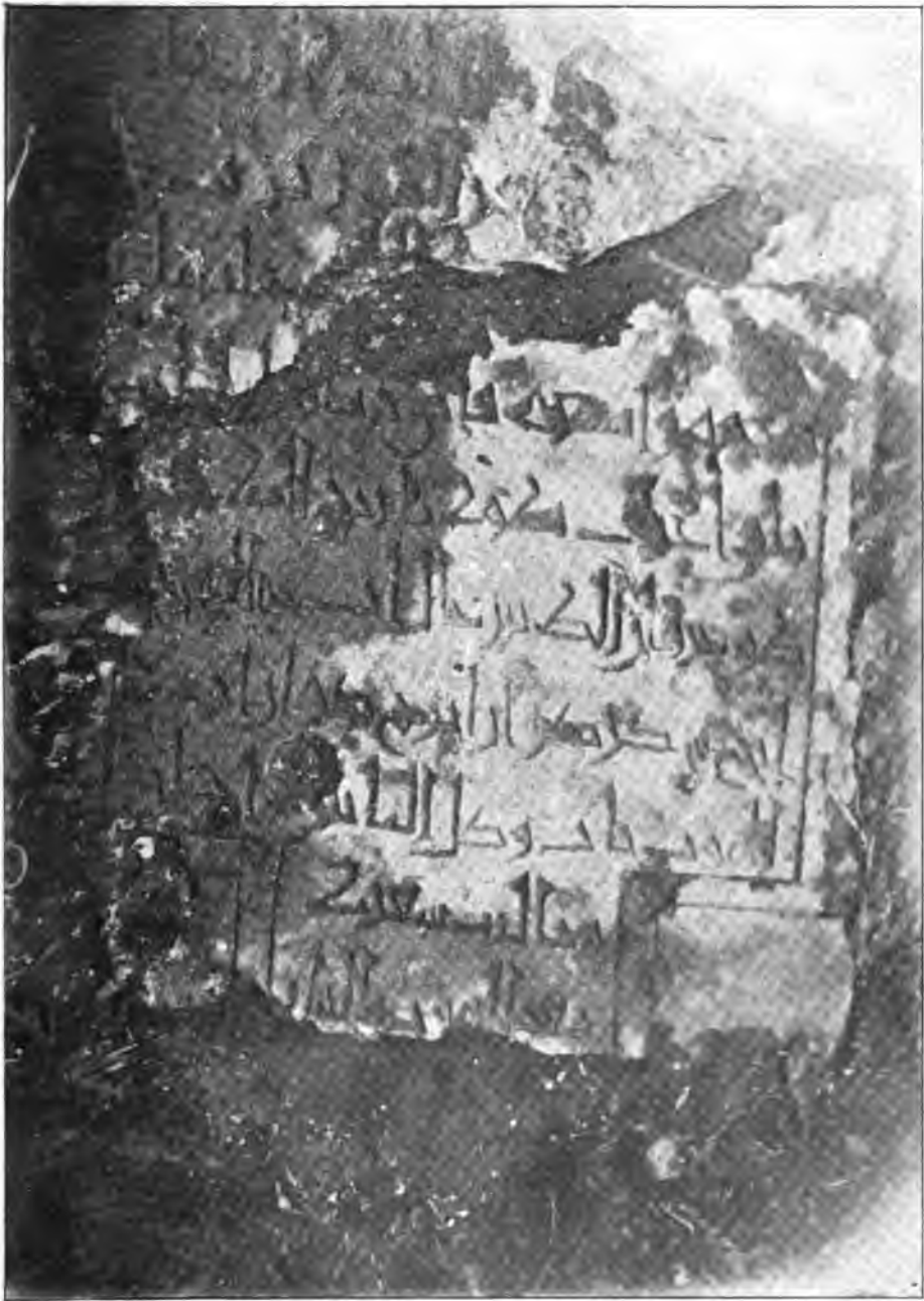
Мусульманскій могильный камень въ загородномъ архіерейскомъ домѣ около Казани.