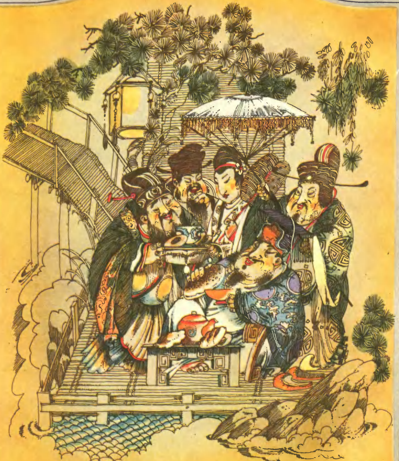
Листики с чайных кустов в Китае научились заваривать несколько тысяч лет назад.