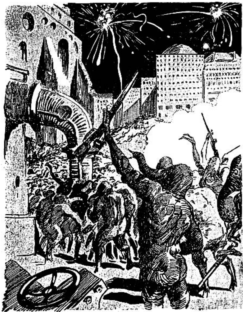
Воины могучей лавой окружили дворец (наступление началось разом и протекло всюду с одинаковым успехом).