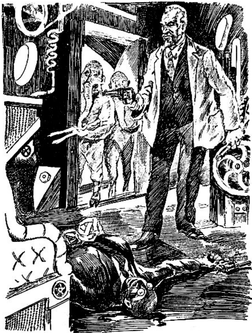
Калека повалился с кресла.