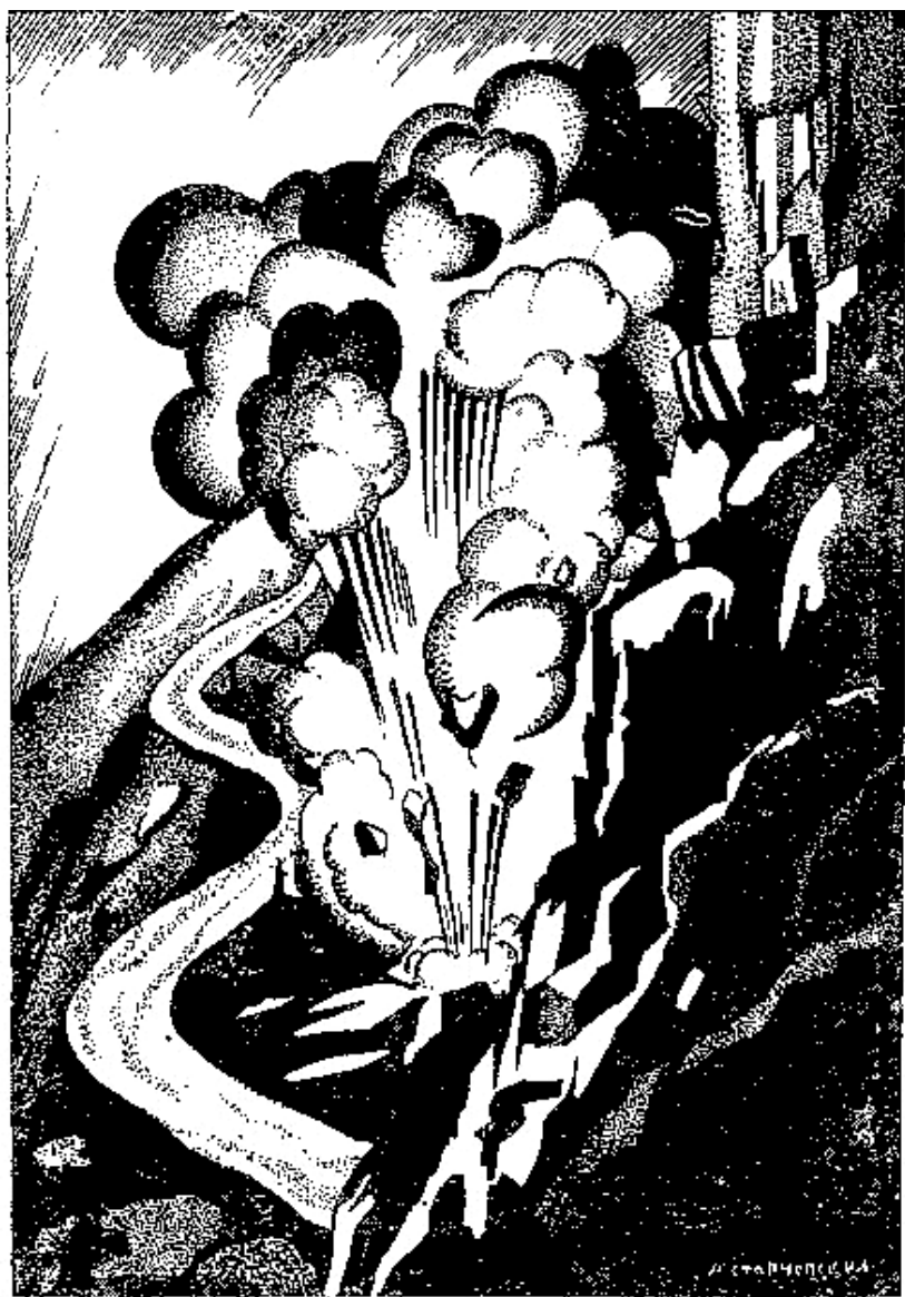
Ракета взорвалась, и скала над озером засияла, как солнце.