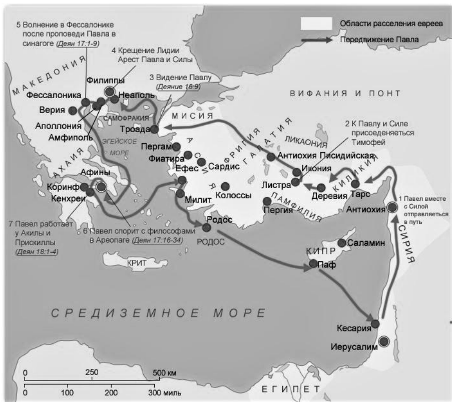
Рисунок 2. Второе миссионерское путешествие Апостола Павла.

Дальше будет ещё «веселее» (Деян.16:22,23).