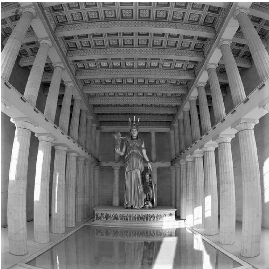
Рисунок 4. Парфенон в Афинах, храм Афины-Девы (реконструкция).

Уважаемые читатели, вы должны не просто пробежать глазами, как просматривают текущие новости, а понять и глубоко усвоить истину, что не страх и забитость породили эллинское язычество (как и любое другое язычество), а гордыня человеческая. Гордыня человека, познающего природу и покоряющего её себе (разными способами покоряющего: и путём технического прогресса, и путём колдовства). Язычество — это знак вызова людей пред Богом: хотя мы и смертны, но царствуем над этим миром. Язычество — это символом торжества плотского человеческого разума в этом мире. Язычество — это символ силы, красоты и гармонии человека — не души, а тела человека (человека, а не богов, ибо языческие боги создавались по образу человека). Вот в чём формула привлекательности язычества — и эллинистического язычества, и любого другого язычества, — а