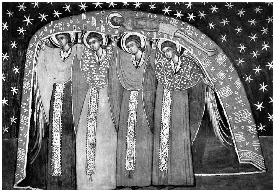
Рисунок 7. Икона. Жёны-мироносицы.

тихий, мирный». Так что Апостол Пётр пишет здесь вовсе не о том, чтобы жёны вели себя как монашки, которые тихонько семенят, кротко опустив глаза и молитвенно сложив руки, а о том, чтобы они были нежными жёнами и ласковыми матерями, ведущими себя мудро, со сдержанным достоинством, наполняя дом миром и спокойствием.