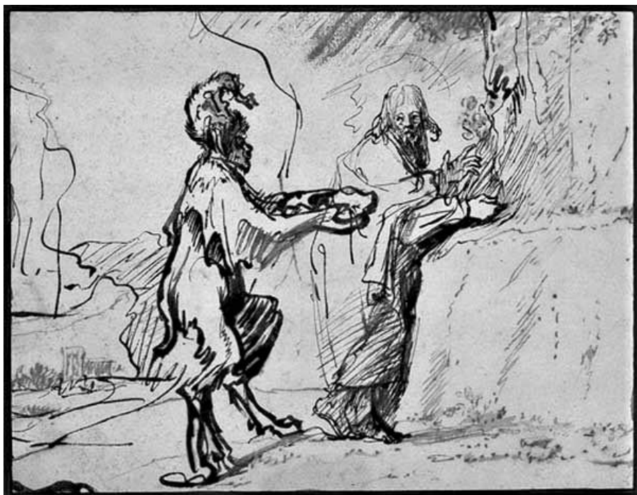
Рисунок 6. Искушение сатаной. Во время испытаний важно то, на что или на кого вы смотрите: если на хлеб – тогда легко соблазниться, а если на того, кто его предлагает – тогда легко устоять.

Обратите внимание на слова: «Дастся ему без упрёков». Даже если вы раз за разом падаете и уже готовы считать себя конченными и худшими из всех христиан, то вспомните, что Бог вас не упрекает. Бог не считает вас такими. Он не будет упрекать вас за ваши падения, ведь Он мог бы сделать и так, чтобы вы с лёгкостью выдержали все испытания веры. Но Бог желает, чтобы вы научились жить верой, а не плотским видением, жить вместе с Ним, жить Его силой, Его мудростью, чтобы вы духовно возрастали. И ещё вы должны помнить, что Иисус Христос преодолел ВСЕ искушения и испытания, как человек, а не как Бог. Значит и вы, если будете верны и настойчивы, сможете преодолеть своё искушение.