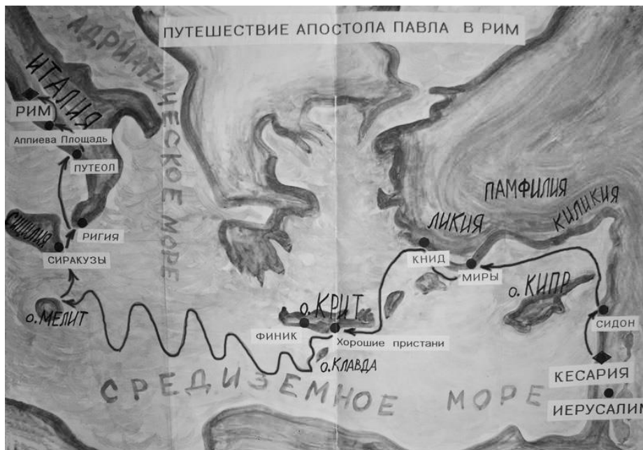
Рисунок 5. По приказу прокуратора Иудей, Феста, Павел был отправлен из Кесарии в Рим, чтобы предстать суд пред кесарем.

Эвроклидон – северо-восточный ветер, который погнал корабль от прибрежной полосы в открытое море.