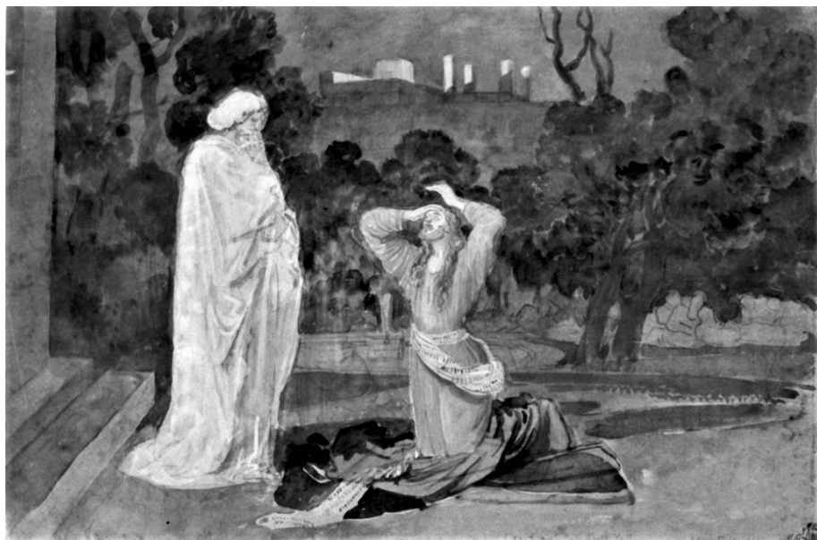
Рисунок 8. Иванов А.А. Христос в Гефсиманском саду (моление о чаше). В отличие от иконописных страстей Христовых, на этой картине виден Иисус – человек. Истинный человек со всеми Своими страхами и сомнениями, с печалью и в то же время с решимостью до конца исполнить волю Отца. Ангел же здесь лишь созерцает – в скорби смотрит на то, что переживает и что ещё предстоит пережить Иисусу Христу.

Истина, которую отстаивал Апостол Иоанн, состоит в том, что Иисус Христос был в настоящем материальном человеческом теле, и умер по-настоящему, и воскрес по-настоящему.