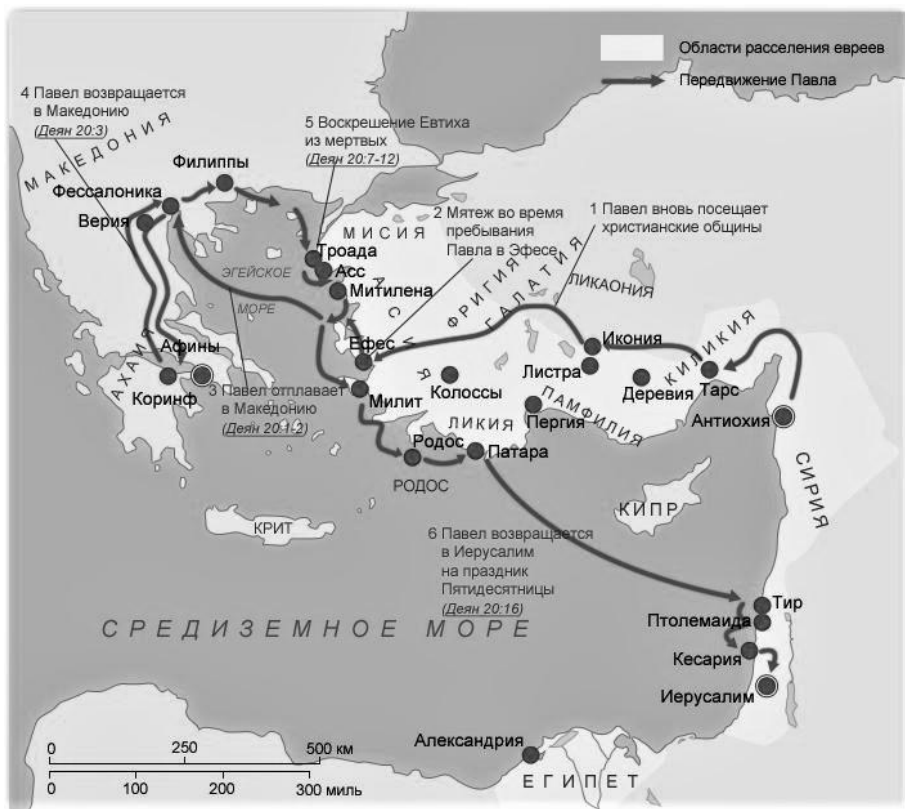
Рисунок 3. Третье миссионерское путешествие Апостола Павла. Эфес и вся Асия были объаты духовной тьмой идолопоклонства, и потребовалась длительная, кропотливая работа Духа Божьего, чтобы приготовить сердца людей к благовестию о Христе.

«Ниспѣл на них Дух Святой, и они стали говорить [иными] языками и пророчествовать» – здесь Лука уже в третий описывает случай крещения Святым Духом со знамением говорения языками и с пророчествами (см. комментарии к Деян.2:1-6,38-39; 10:43-48). Уточняю: Лука не ставил перед собой задачу рассказать обо всех случаях крещения Святым Духом со знамением говорения языками как Дух даёт проповедовать, поэтому то, что он описывает третий пример, совсем не означает, что, кроме этих трёх, не было других случаев крещения верующих Святым Духом, скорее, наоборот, их было очень много.