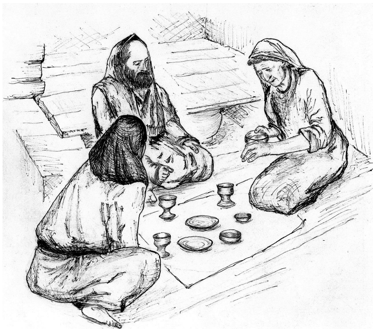
Рисунок 4. Потом мать тяжело встала, принесла ещё одну миску, налила в неё солёную воду как символ слёз...

Не будет! И как жить с расплывшимся душой камнем такого знания? Забыться в вине? Так вина нет — есть только смердящая страхом и смертью действительность.