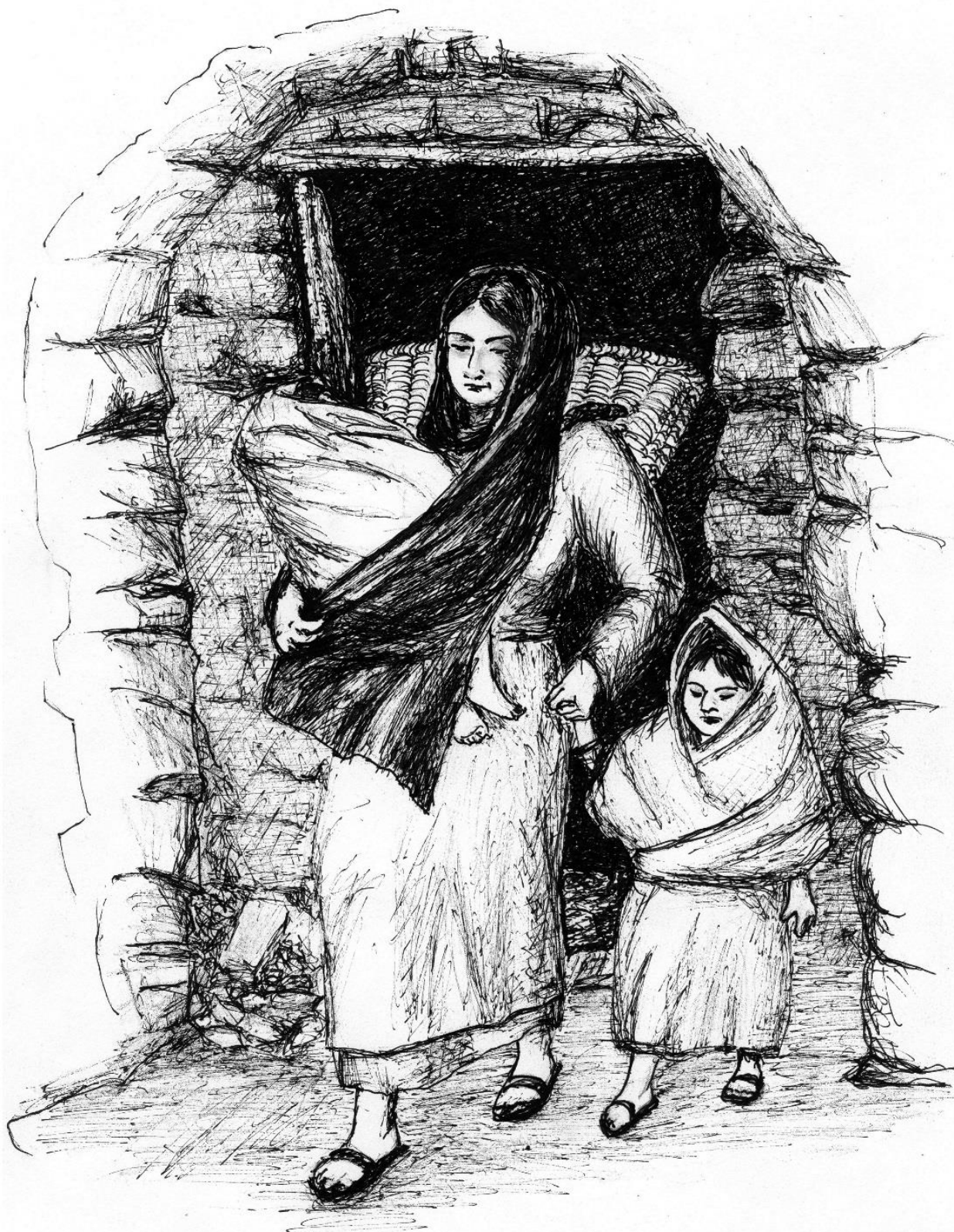
Рисунок 2. И в одну из промозглых дождливых ночей, укутав ребятишек, она пошла с ними к Воротам Источника...