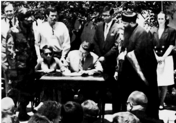
Президент Рональд Рейган подписывает 31 июля 1988 г. документ, объявляющий «Неделю порабощённых народов».