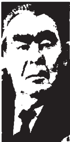
Leonid Brezhnev would like nothing better than a Nuclear Freeze at present levels.

It is no coincidence that this strategy serves to implement the aims of the Soviet Union. It is clearly an integral part of the massive campaign to disarm the West which the Soviets have conducted over the past five years. This effort has been very effective so far, resulting in the cancelling of plans to develop the so-called neutron bomb in 1978 by President Carter, and more recently in making it politically impossible to deploy Pershing II and