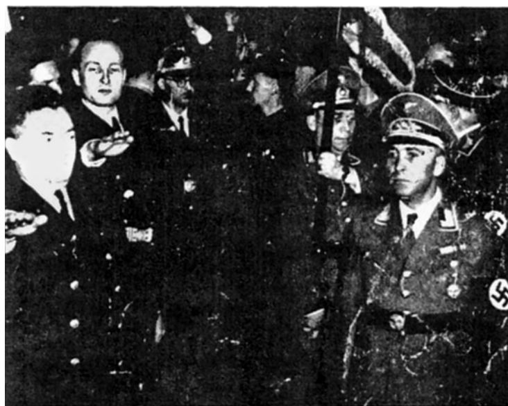
Усташские лидеры независимой Хорватии отдают фашистское приветствие, точно отражающее политические принципы нового хорватского государства