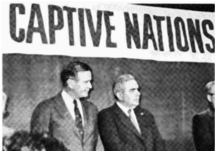
Вице-президент Джордж Буш (слева) с Богданом Федораком на банкете в честь «порабощённых народов» 20 июля 1988 г. в Уоррене, штат Мичиган. Мероприятие было организовано Комитетом порабощённых народов и пронацистским Антибольшевистским блоком народов. Федорак представлял Буша.