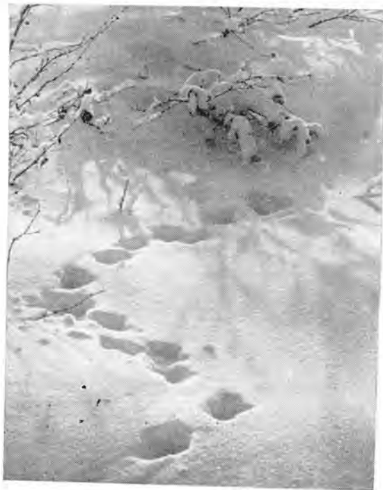
2. ...след его на снегу навывается — малик.