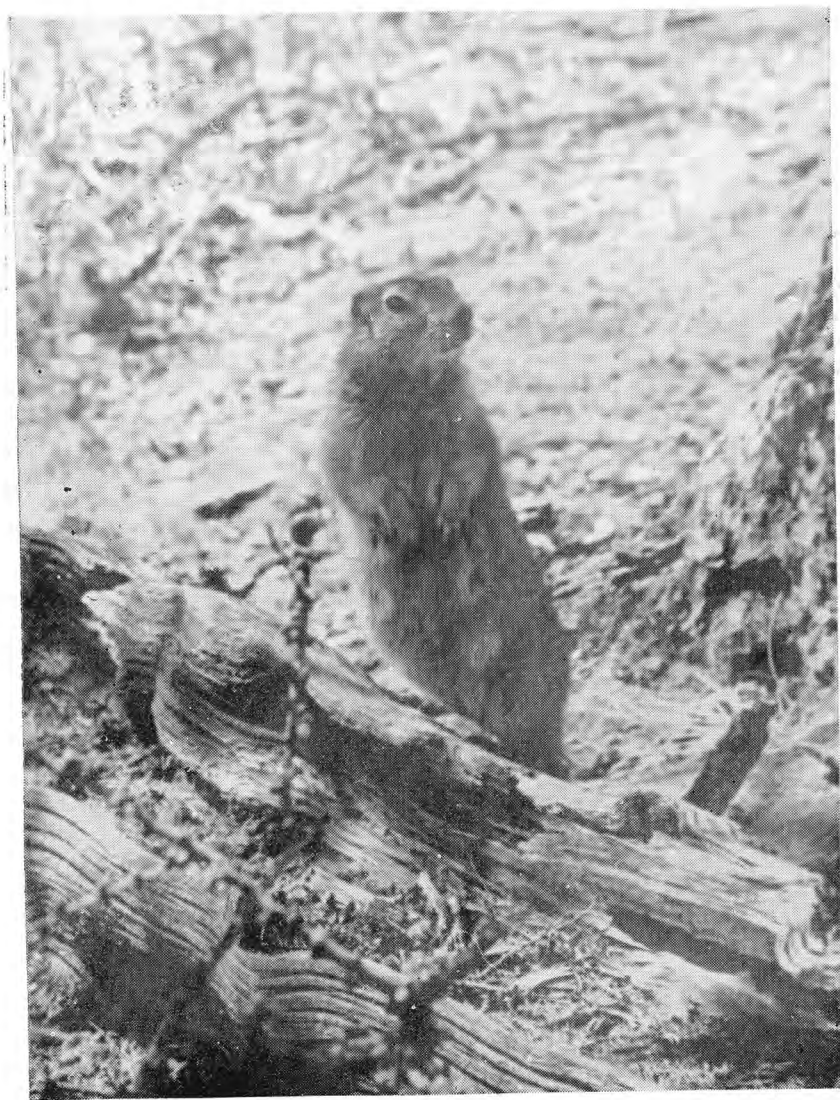
11. Опасность постоянно подстерегает евражку не только с земли, но и с воздуха.