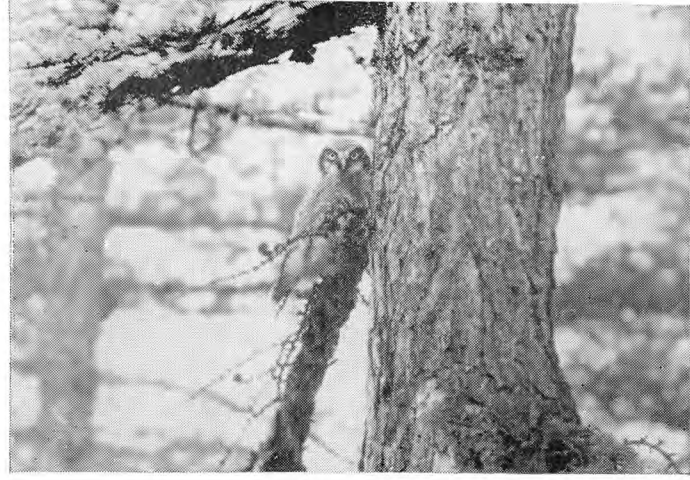
18. Ястребиная сова и днем держится в открытых местах.