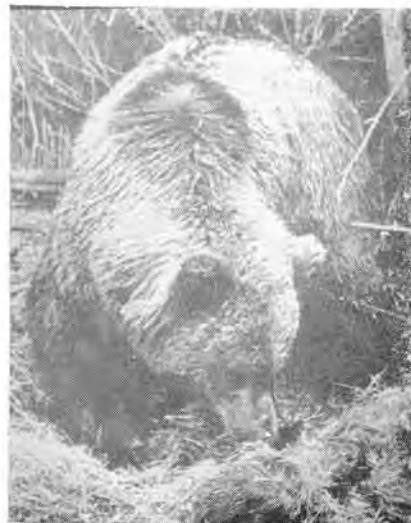
10. Отыскав бурундучью кладовую, медведь нередко вместе с припасами съедает и самого хозяина.