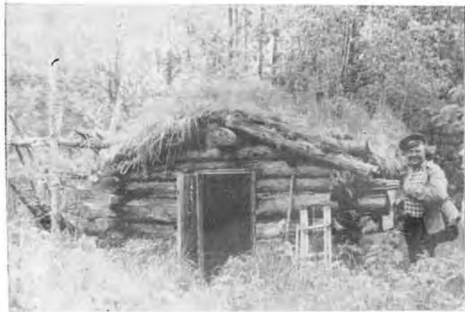
7. Летом в таежной избушке прохладно, зимой тепло и уютно.