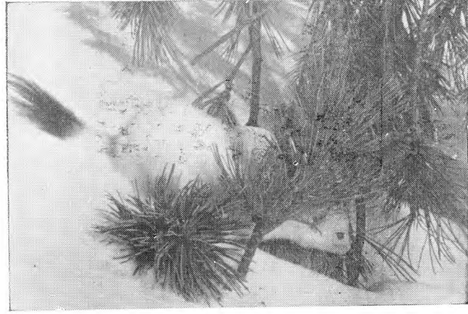
4. Иногда горностай выходит на охоту и днем.