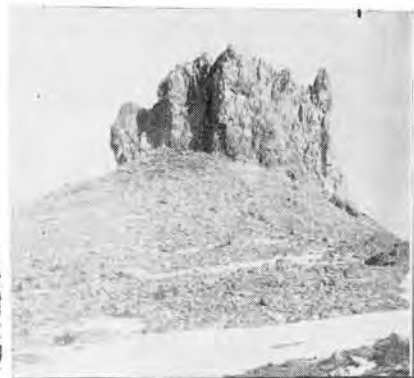
24. Останцы — прибежища снежных баранов.