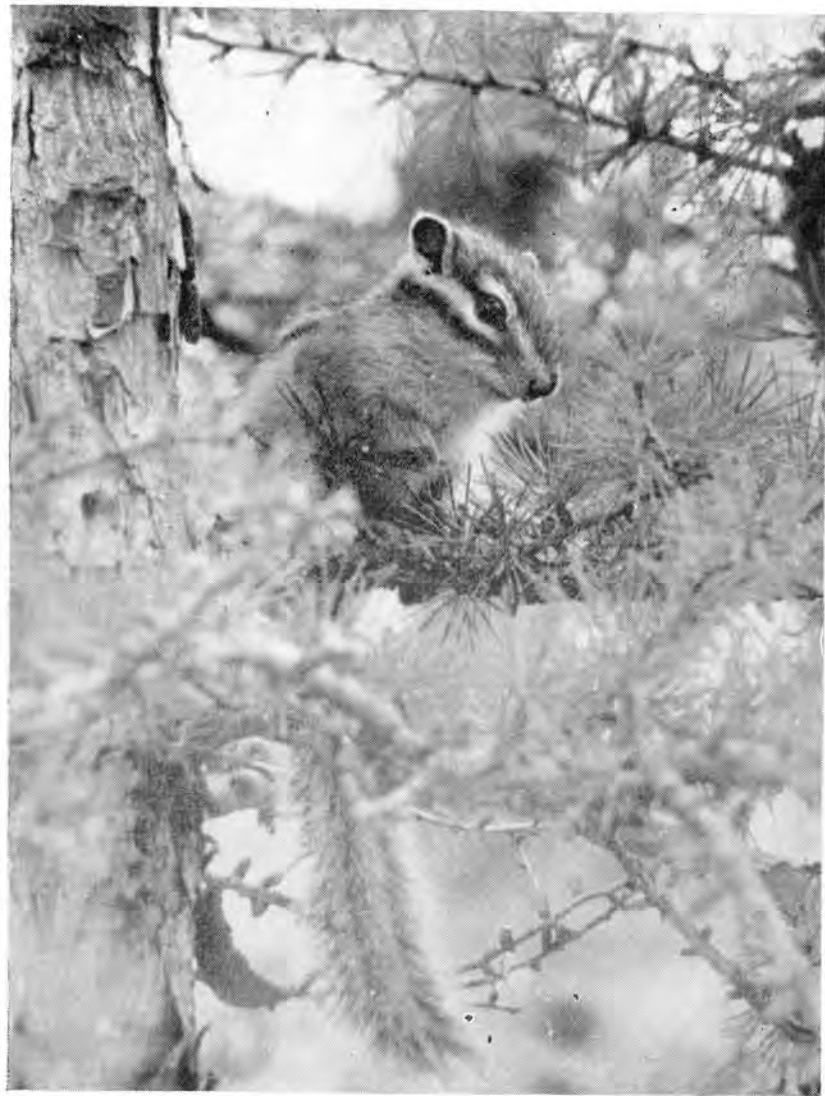
22. Бурундук — земляная белка.