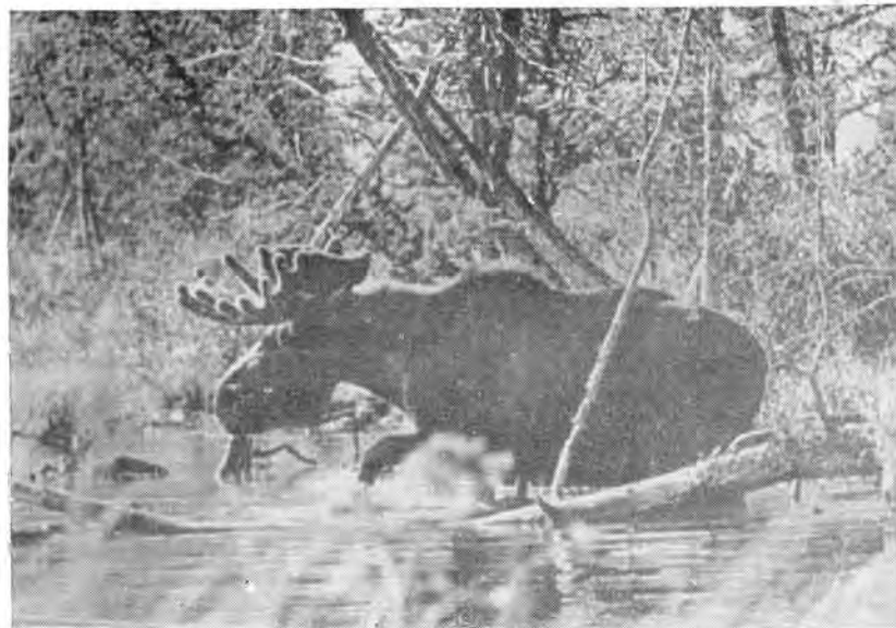
26. Все лето лосиха с детенышем держится на одном участке.