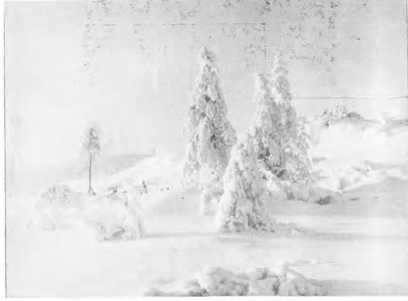
3. Редколле — излюбленное место обитания лисы.