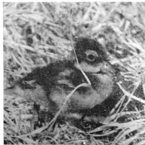
29. С первого дня жизни утята добывают корм самостоятельно.