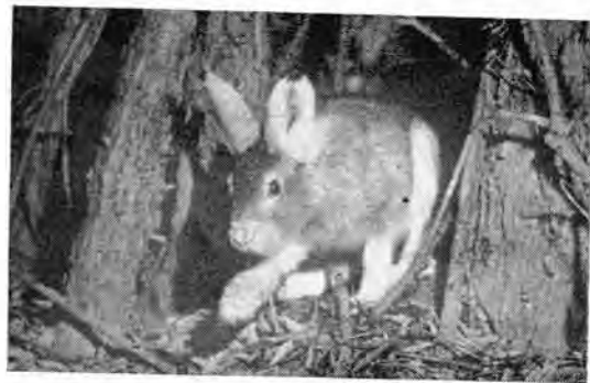
1. До снегопадов заяц-беляк держится в глухой чаще...