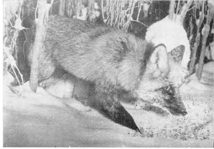
6. Лиса в поисках мышей.