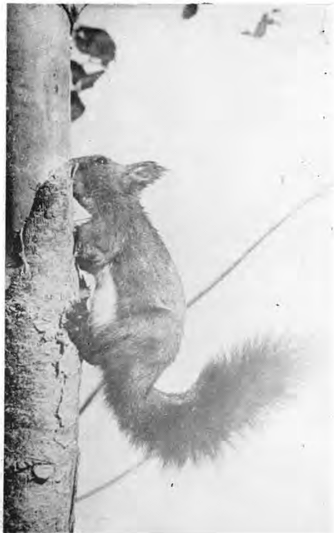
30. Белка — исключительный древолаз.

В воде полно водорослей. Слабое течение все же смогло расчесать их длинные зеленые косы. На берегу следы оляпки, чуть дальше кто-то пропахал длинную борозду. Это след выдры. В метре от воды, под грядой галечника, у нее туалет.