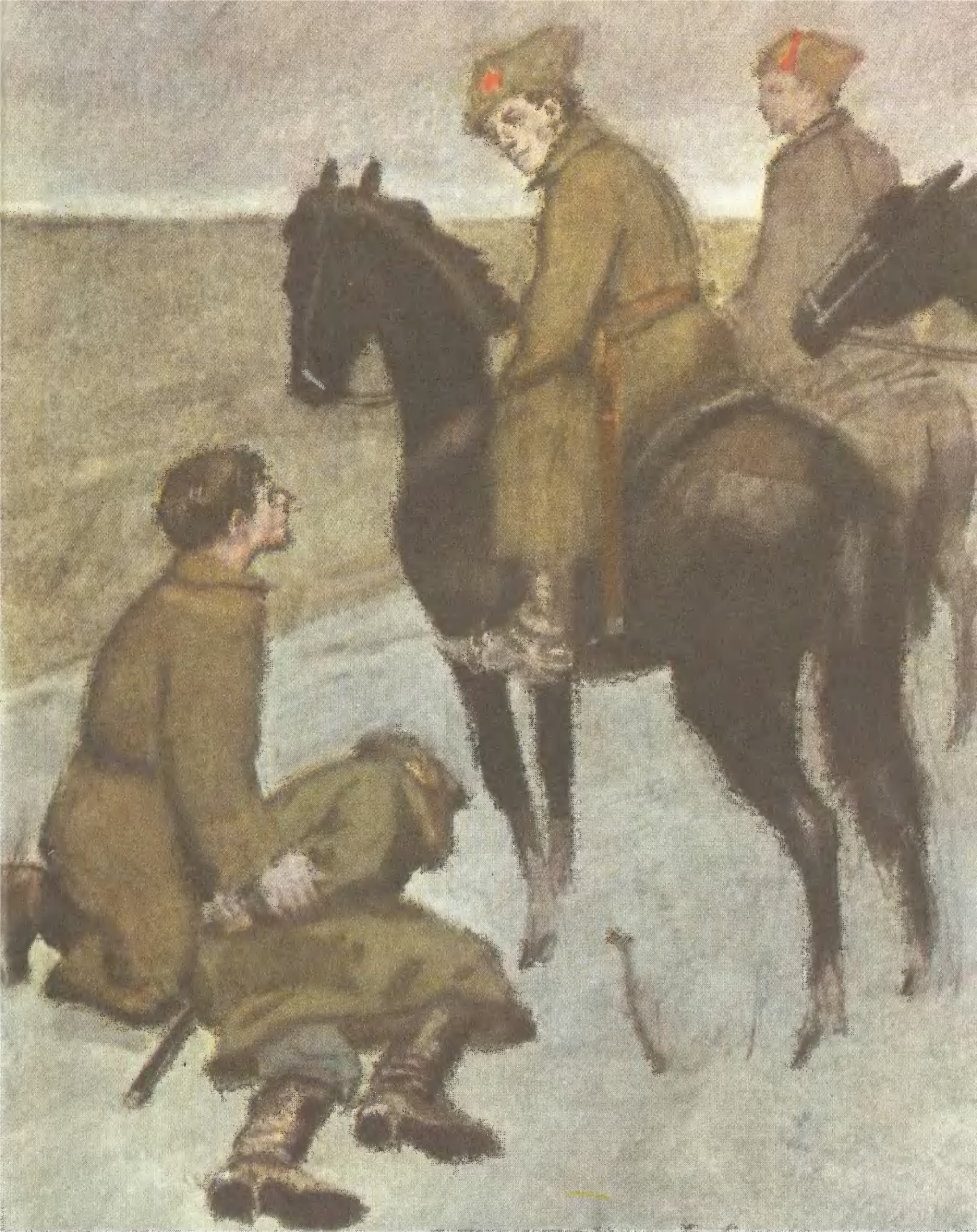
«ХОЖДЕНИЕ ПО МУКАМ» («Хмурое утро»)