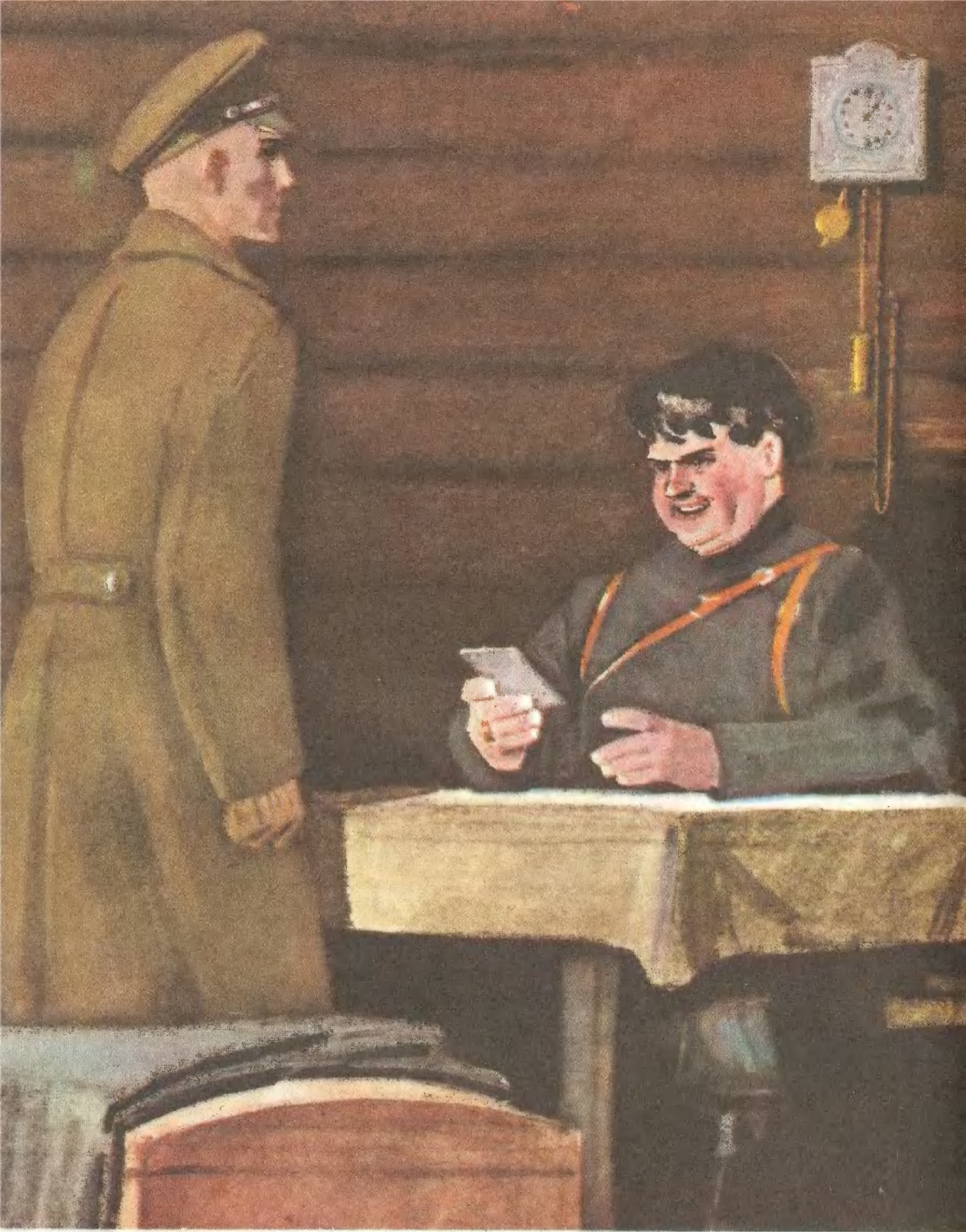
«ХОЖДЕНИЕ ПО МУКАМ» («Хмурое утро»)