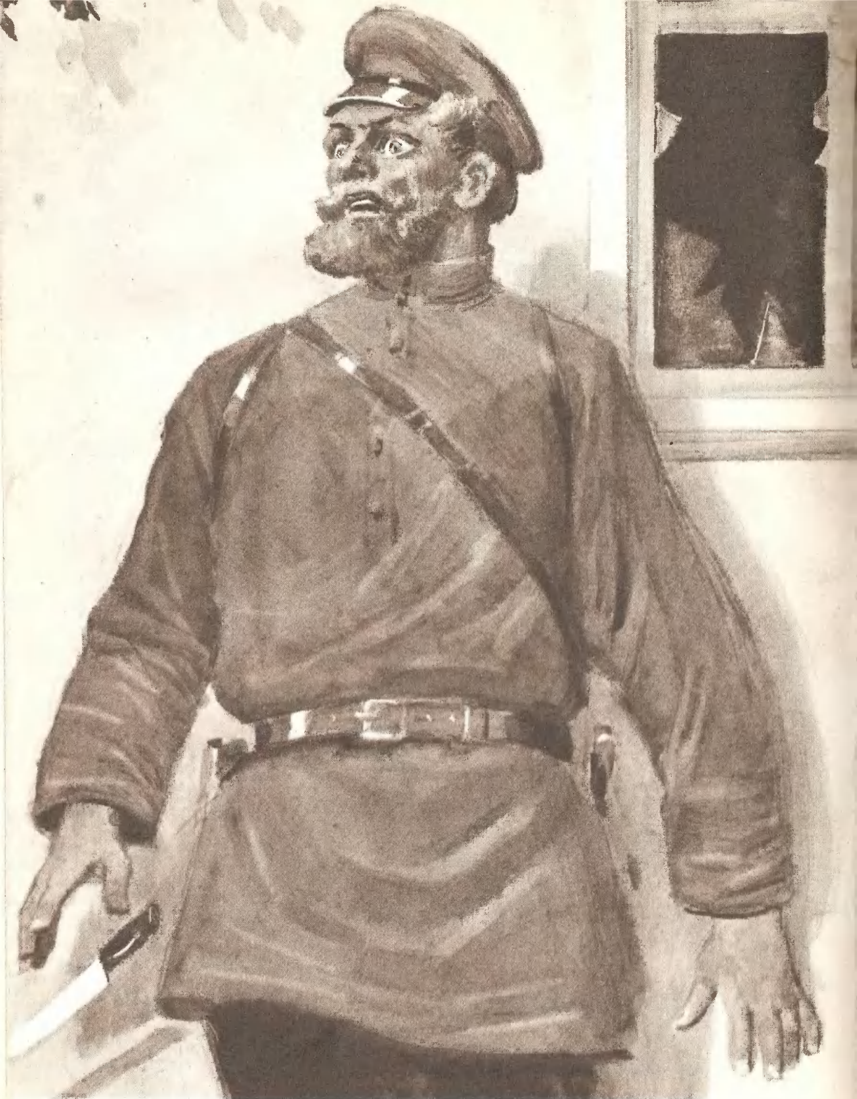
«ХОЖДЕНИЕ ПО МУКАМ» («Хмурое утро»)