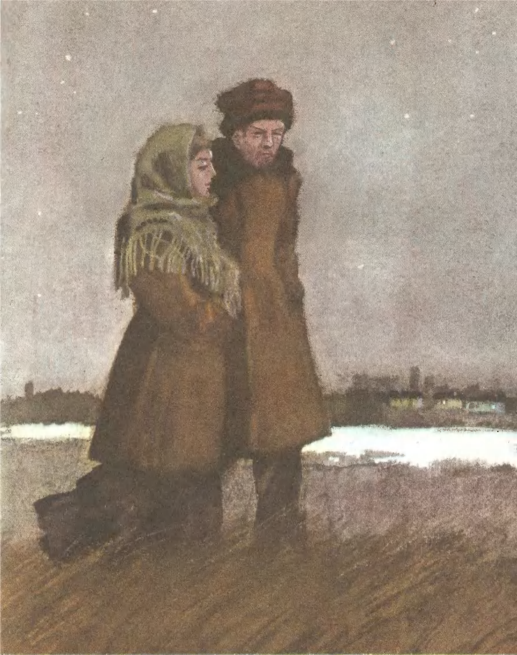
«ХОЖДЕНИЕ ПО МУКАМ» («Хмурое утро»)