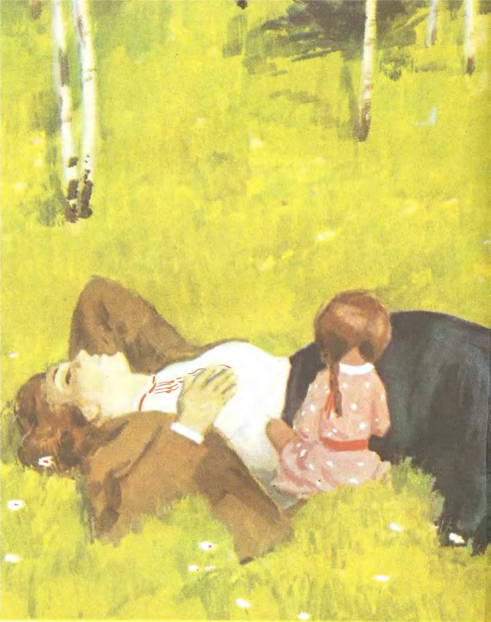
«РАССКАЗЫ ИВАНА СУДАРЕВА» («Нина»)