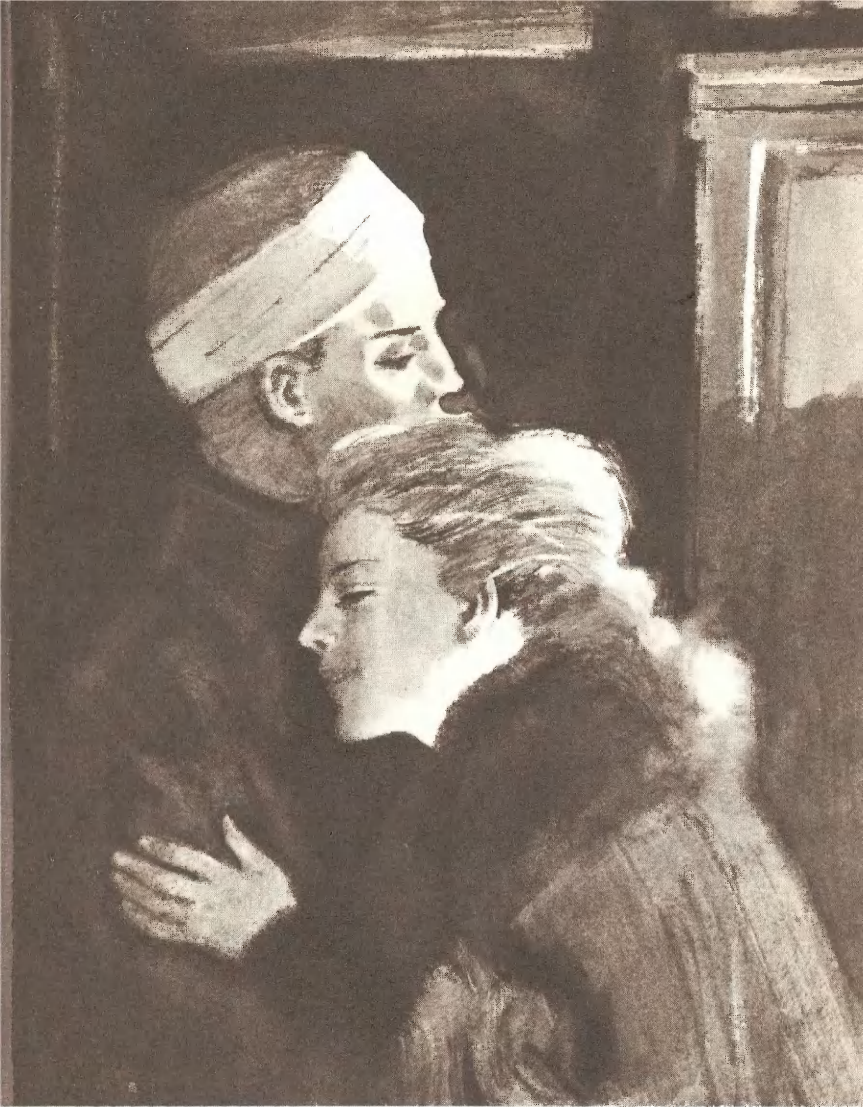
«ХОЖДЕНИЕ ПО МУКАМ» («Хмурое утро»)