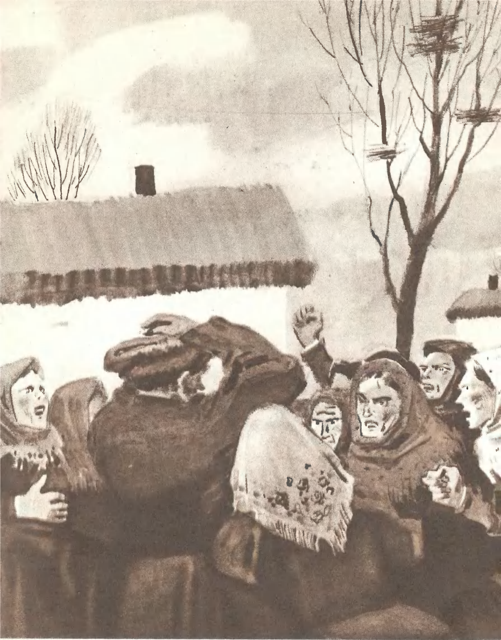
«ХОЖДЕНИЕ ПО МУКАМ» («Хмурое утро»)