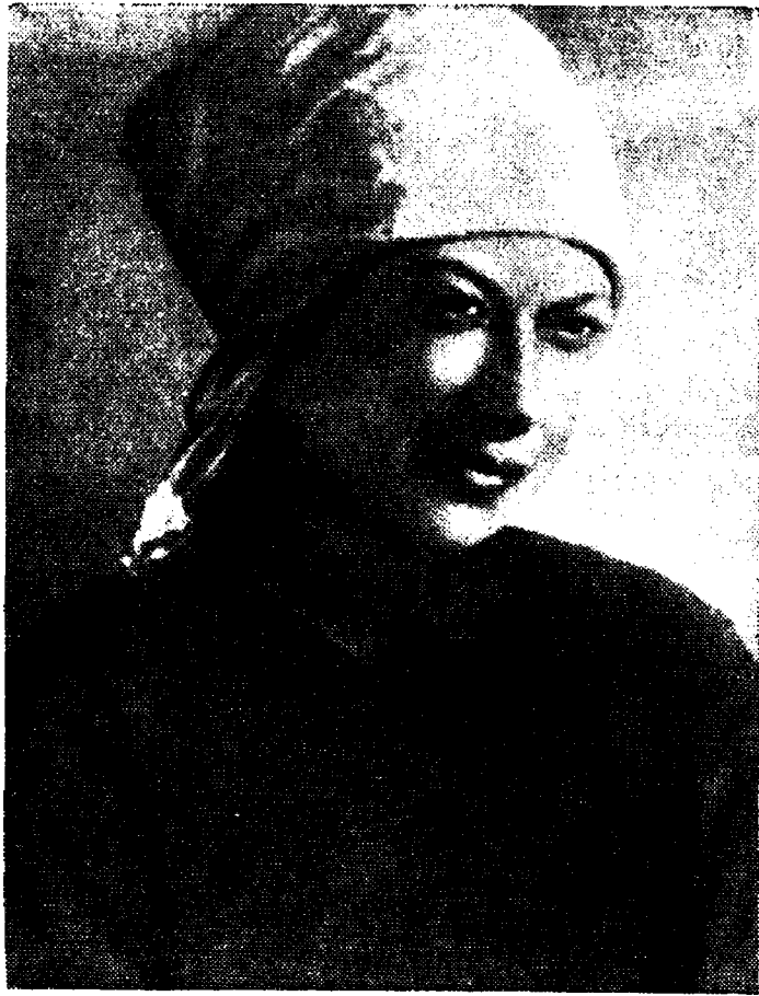
Н. К. Крупская, переодетая в костюм крестьянки при поездке к В. И. Ленину на станцию Разлив. 1917 год.

во многих районах большинство получили большевики. Надежда Константиновна прошла по Выборгскому району. Это было для нее хорошей школой партийной массовой работы после годов эмиграции. Эта же работа помогла ей побороть, наконец, ее обычную застенчивость. Надежде Константиновне после выборов пришлось принимать работу Выборгского отделения комиссии помощи солдаткам от старой знакомой, с которой она вместе училась в гимназии и которая когда-то, на заре революционного движения, была социал-демократкой, — от жены бывшего «легального марксиста» Струве, переметнувшегося в лагерь буржуазии. «Нам солдатки не верят,—сказала Струве, передавая дела,—что бы мы ни делали, они недовольны, они верят только большевикам». Это доверие масс к большевикам непрерывно росло.