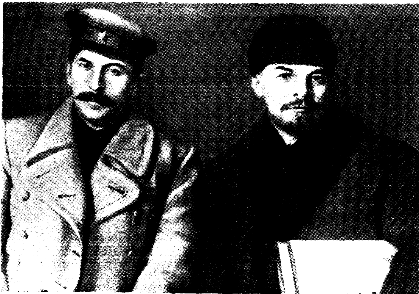
в. И. Ленин и И. В. Сталин.