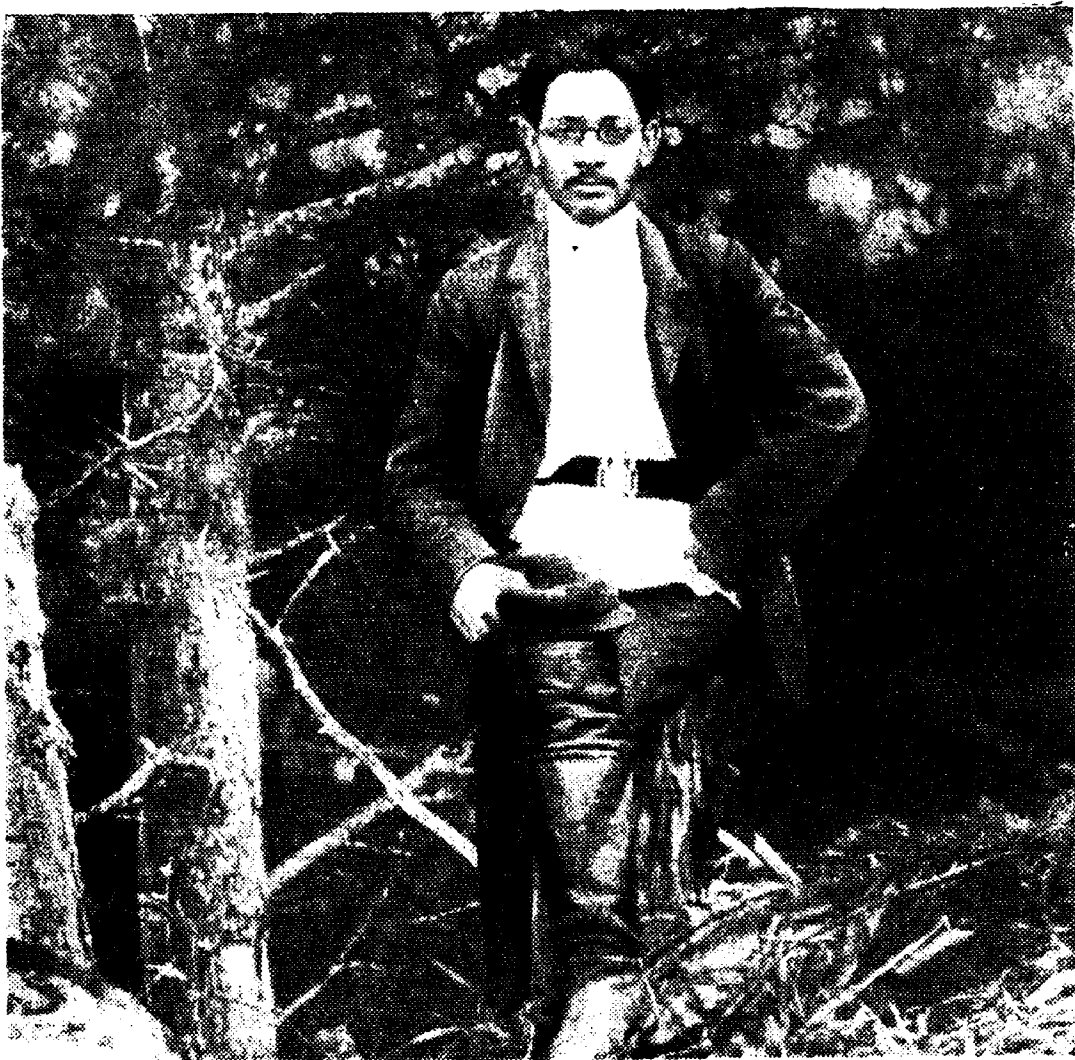
Я. М. Свердлов в нарымской ссылке.