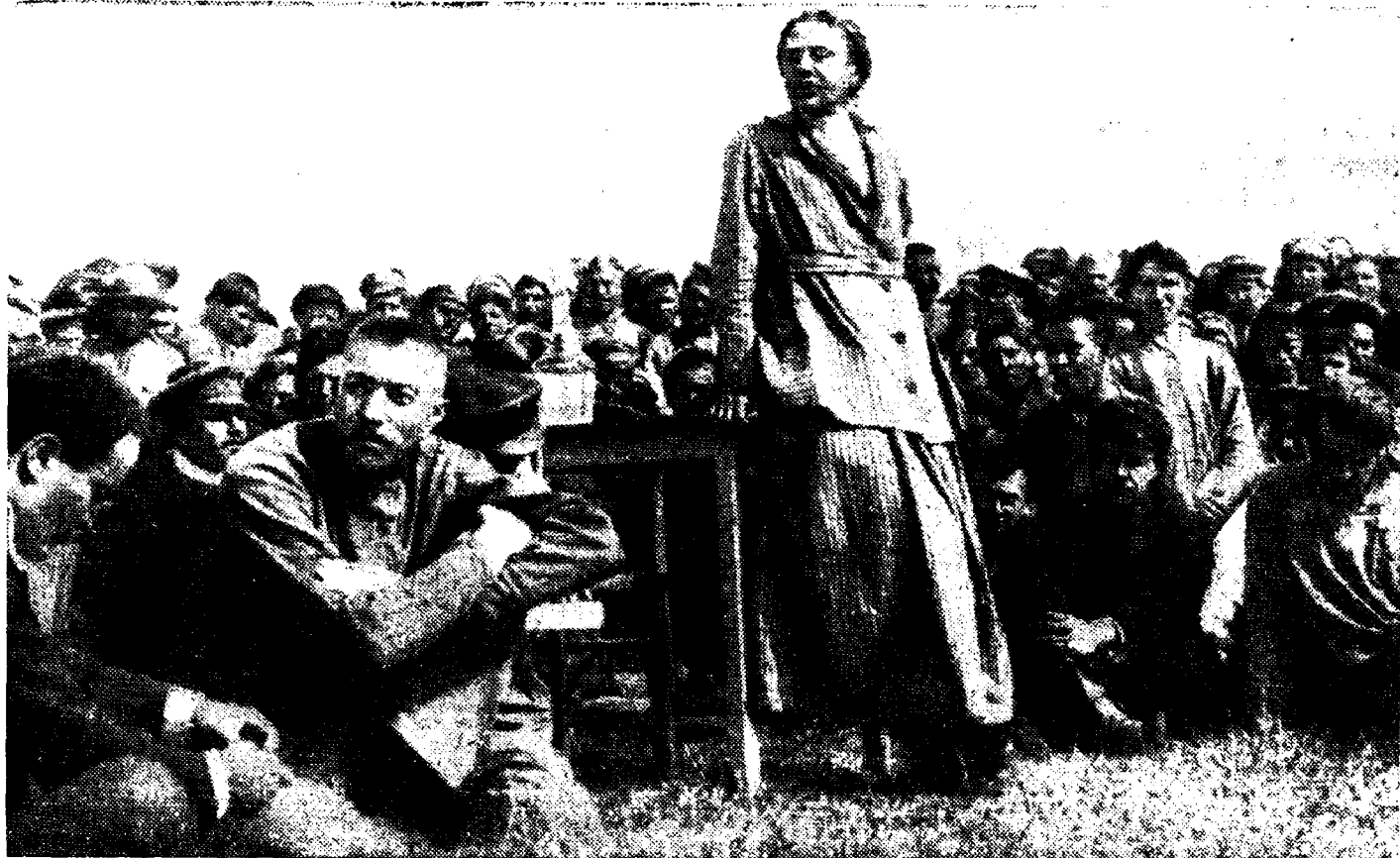
Н. К. Крупская и В. М. Молотов (слева, сидит на земле) на митинге в 250-м полку.