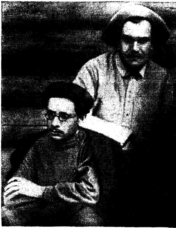
Я. М. Свердлов и В. Куйбышев в туруханской ссылке.

Но снова его кипучая деятельность была прервана арестом. Выданные провокатором Малиновским, Сталин и Свердлов снова оказались в тюрьме, а затем в ссылке в Туруханском крае.