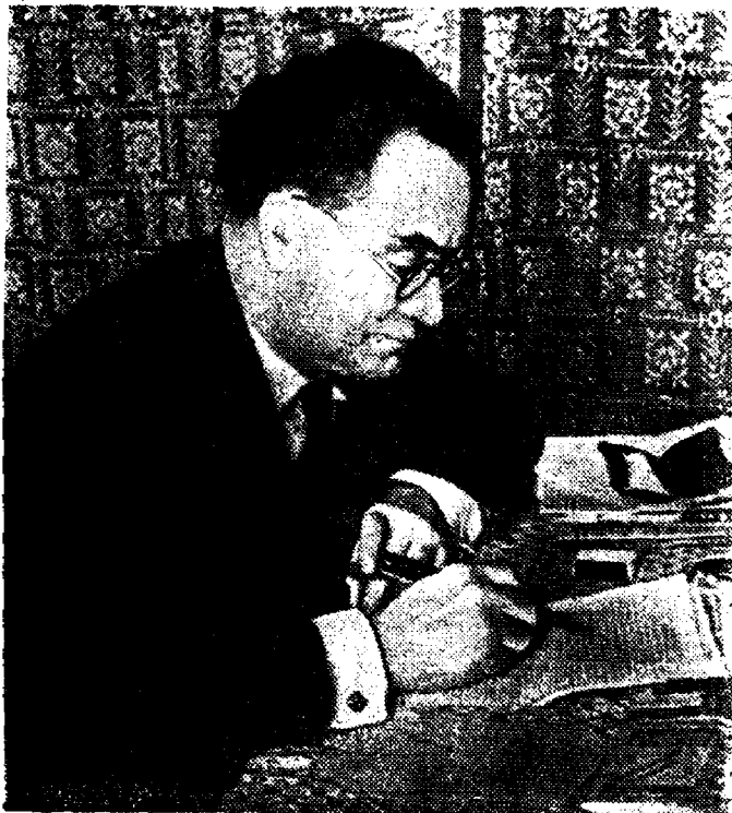
Тов. Георгий Димитров.

стического Интернационала. Вместе с тем эта новая ориентировка не была отрицанием старой тактики. Эта новая тактическая ориентировка означала дальнейшее развитие старой тактики, поворот в тактике, вытекающий из новой обстановки, когда самой главной и самой революционной ближайшей задачей в странах капитала является разгром фашизма.