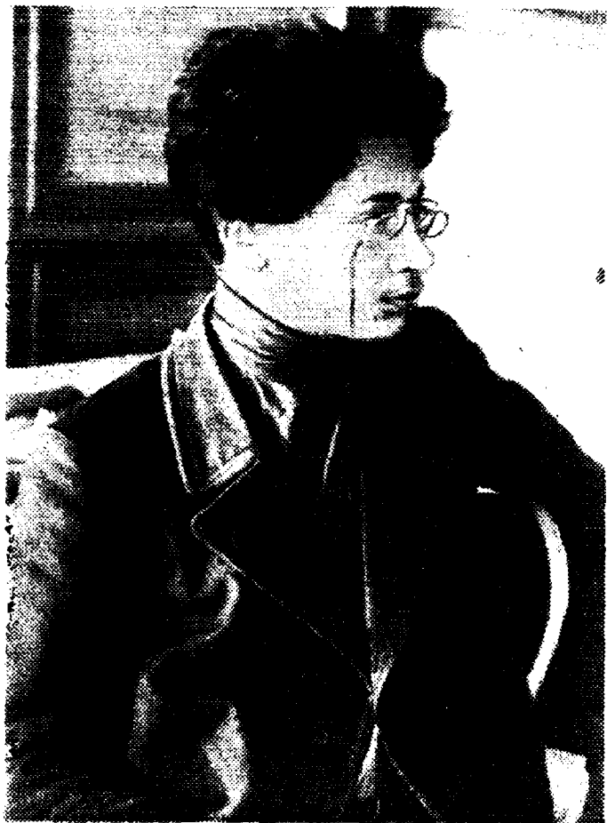
Я. М. Свердлов. 1902 год.

«Бесчисленное количество раз голос Якова гремел на рабочих массовках, митингах, когда затихали сотни и тысячи слушателей и когда над сормовскими пролетариями вырастал призывный пламенный голос борьбы, бросаемый в толпу этим черненьким, на вид небольшим человеком...»