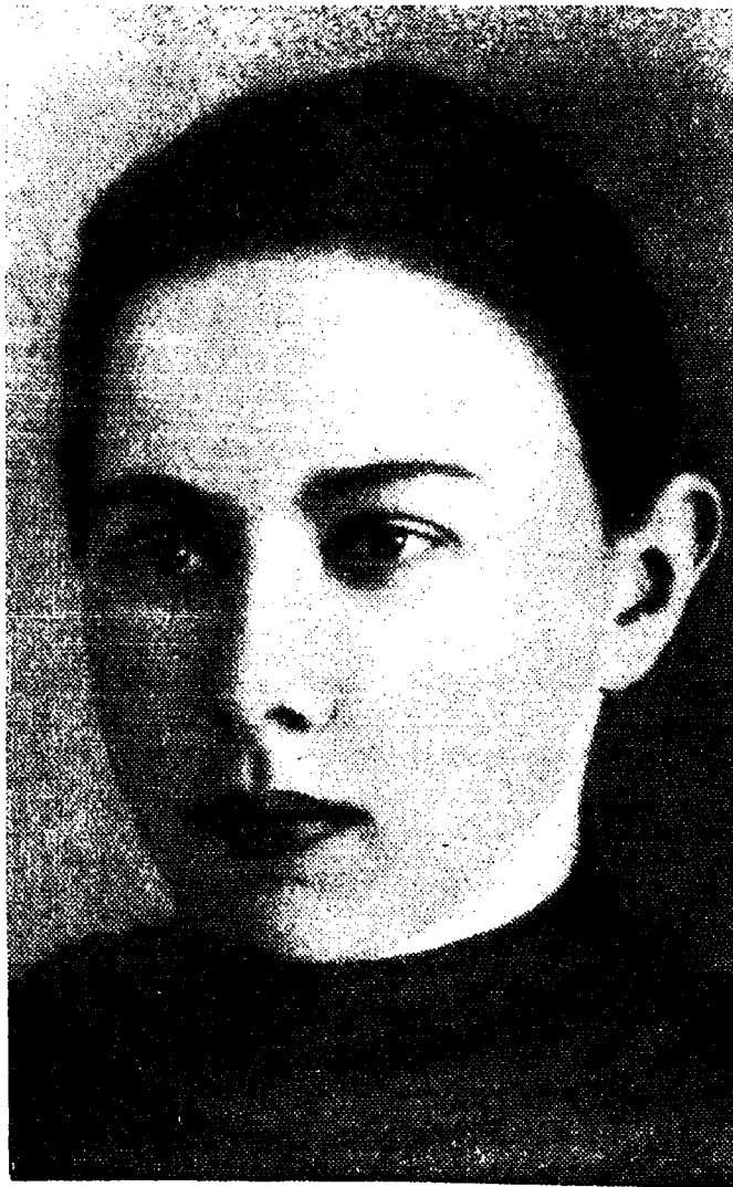
Н. К. Крупская. 1900 год. Музей революции СССР.