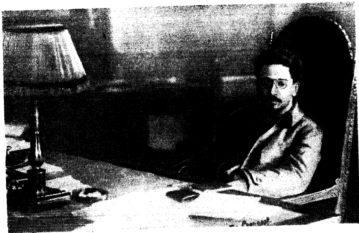
Я. М. Свердлов — председатель ВЦИК.

Тов. Свердлов, создавая конституцию, продолжал проводить огромную работу по созданию нового государственного аппарата, по укреплению советской власти на местах.