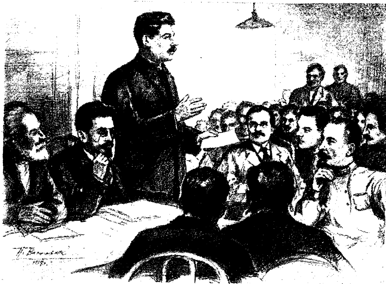
VI съезд РСДРП(б). 1917 год.