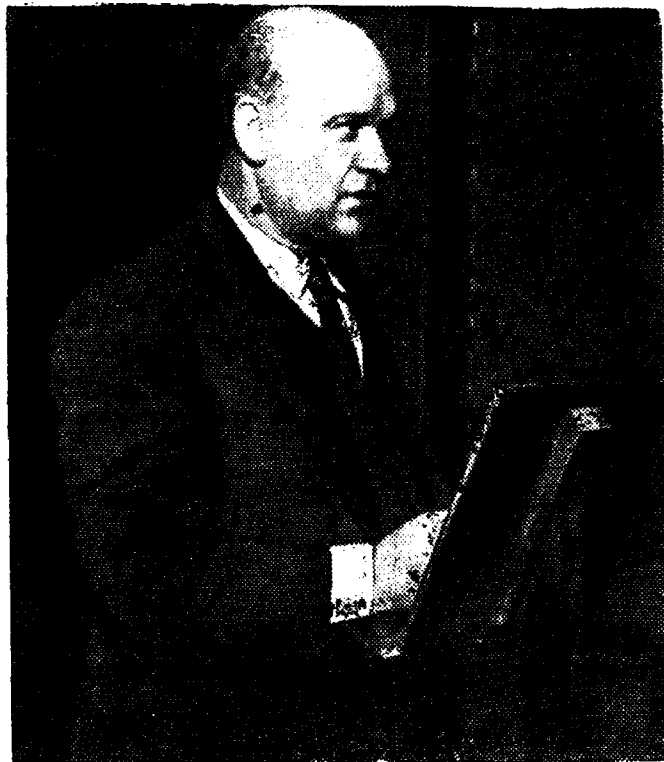
Тов. Эрнст Тельман.

Блестящая победа народного фронта над фашизмом на общих выборах в Испании и