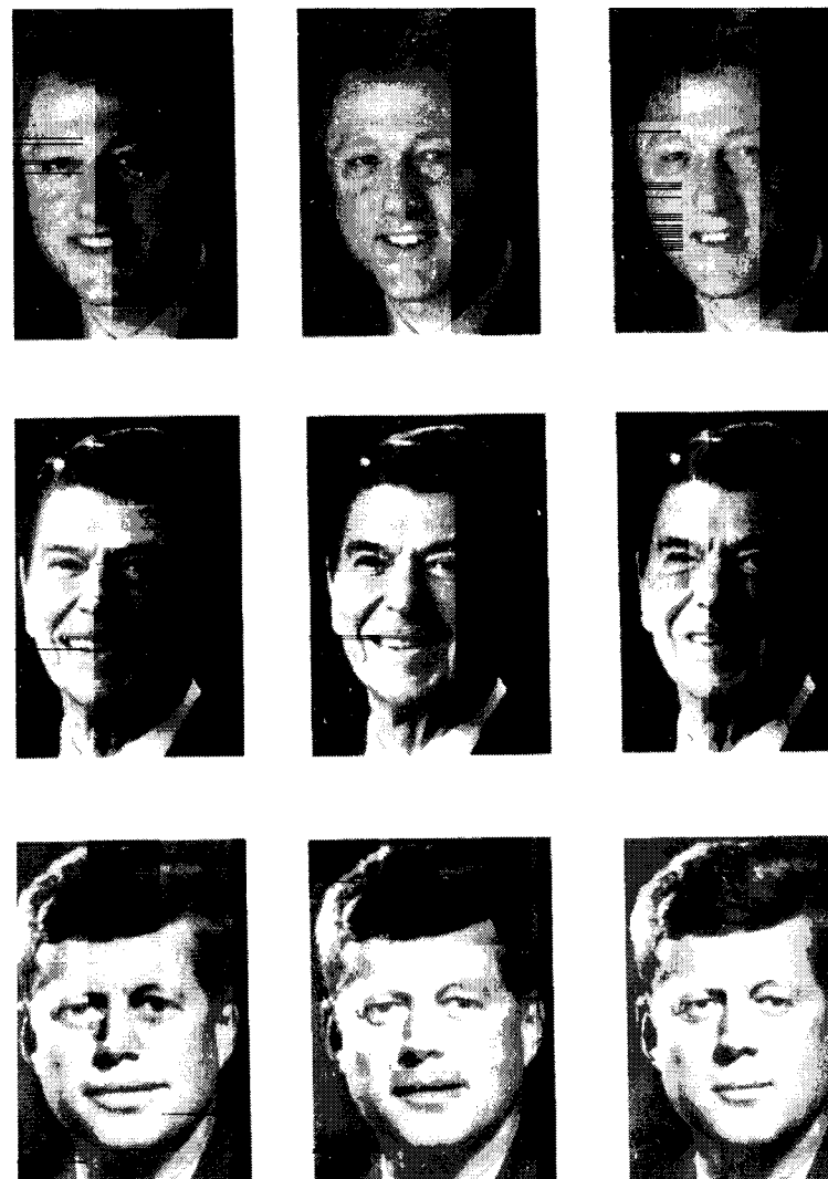
Рис. 1. Выразительные, нормальные и зрелые версии лиц президентов Клинтона, Рейгана и Кеннеди. Выразительные версии находятся слева, нормальные (неизменные) в центре, зрелые версии справа.